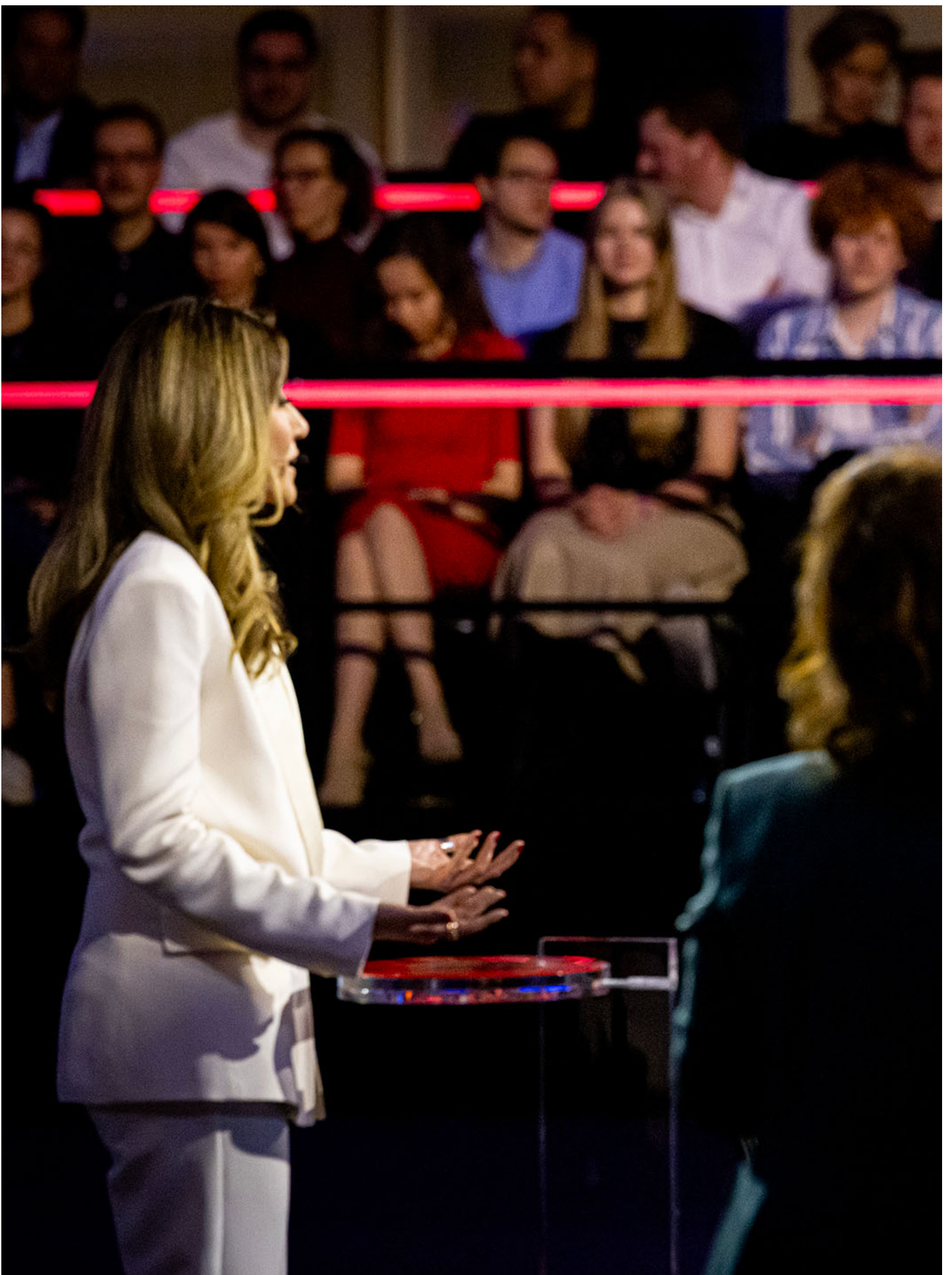
2023年11月21日，荷兰海牙，VVD的Dilan Yesilgoz（左）和PVV的Geert Wilders（右）出席全国选举辩论。