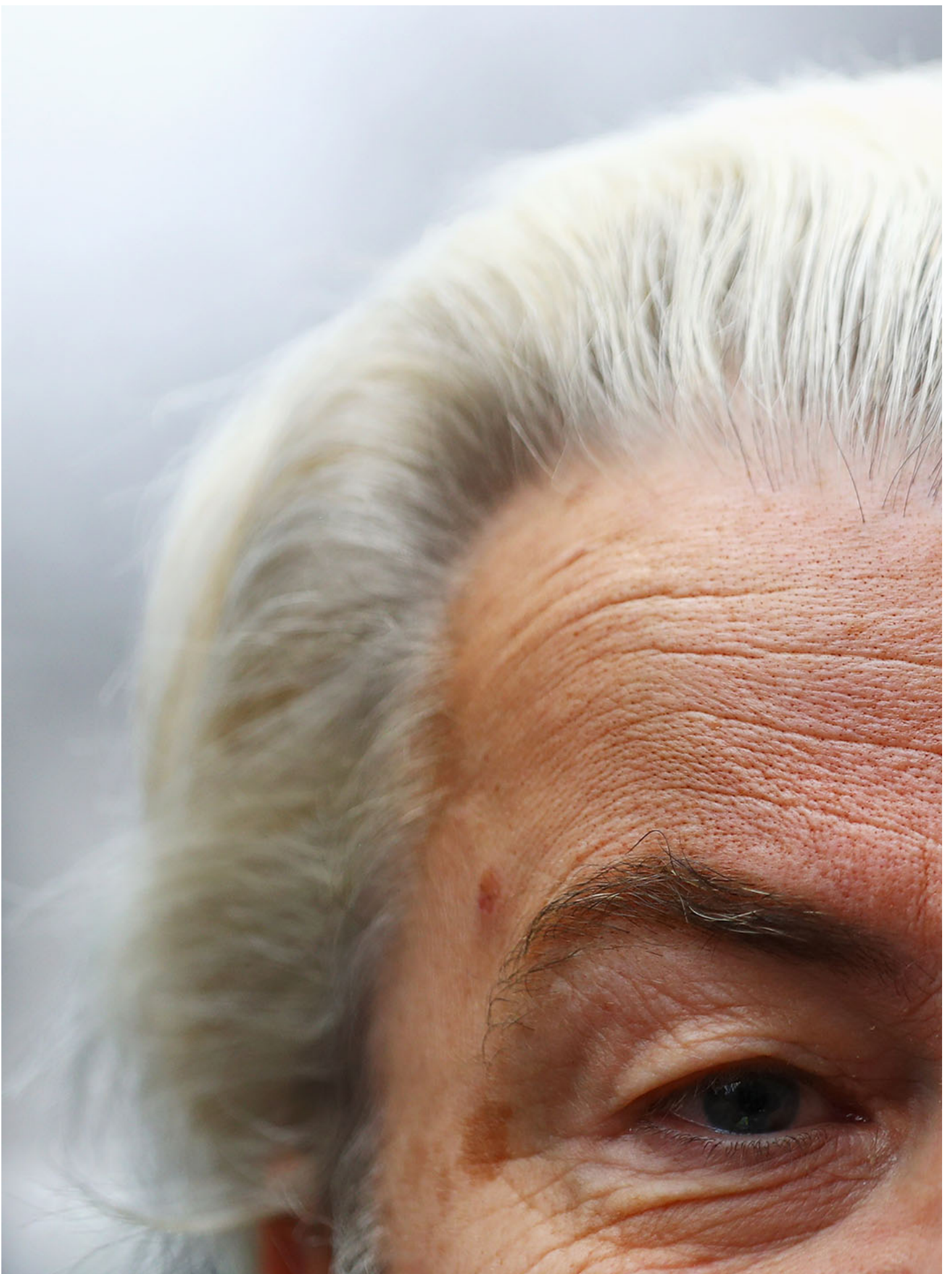
2017年2月18日，PVV候选人Geert Wilders在竞选集会上向人群发表讲话。

在疫情和俄乌战争之后，欧洲普遍物价飞涨，通胀居高不下，对生活质量下降的体感是普遍存在的。而住房是首当其冲的问题。