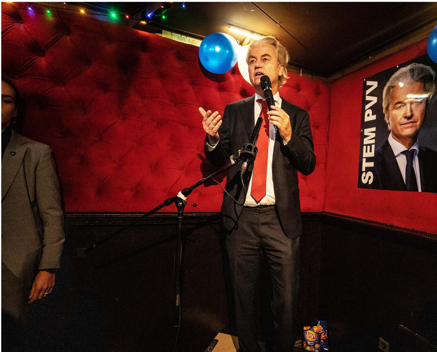
2023年11月22日，“荷兰特朗普”的极右翼政客Geert Wilders赢得大选，在选举之夜派对上发表讲话。

荷兰政坛在过去25年间一直在有意无意地迎合极右翼选民，如此做的政客们却常常宣称，这样做正是为了击败极右翼政党。