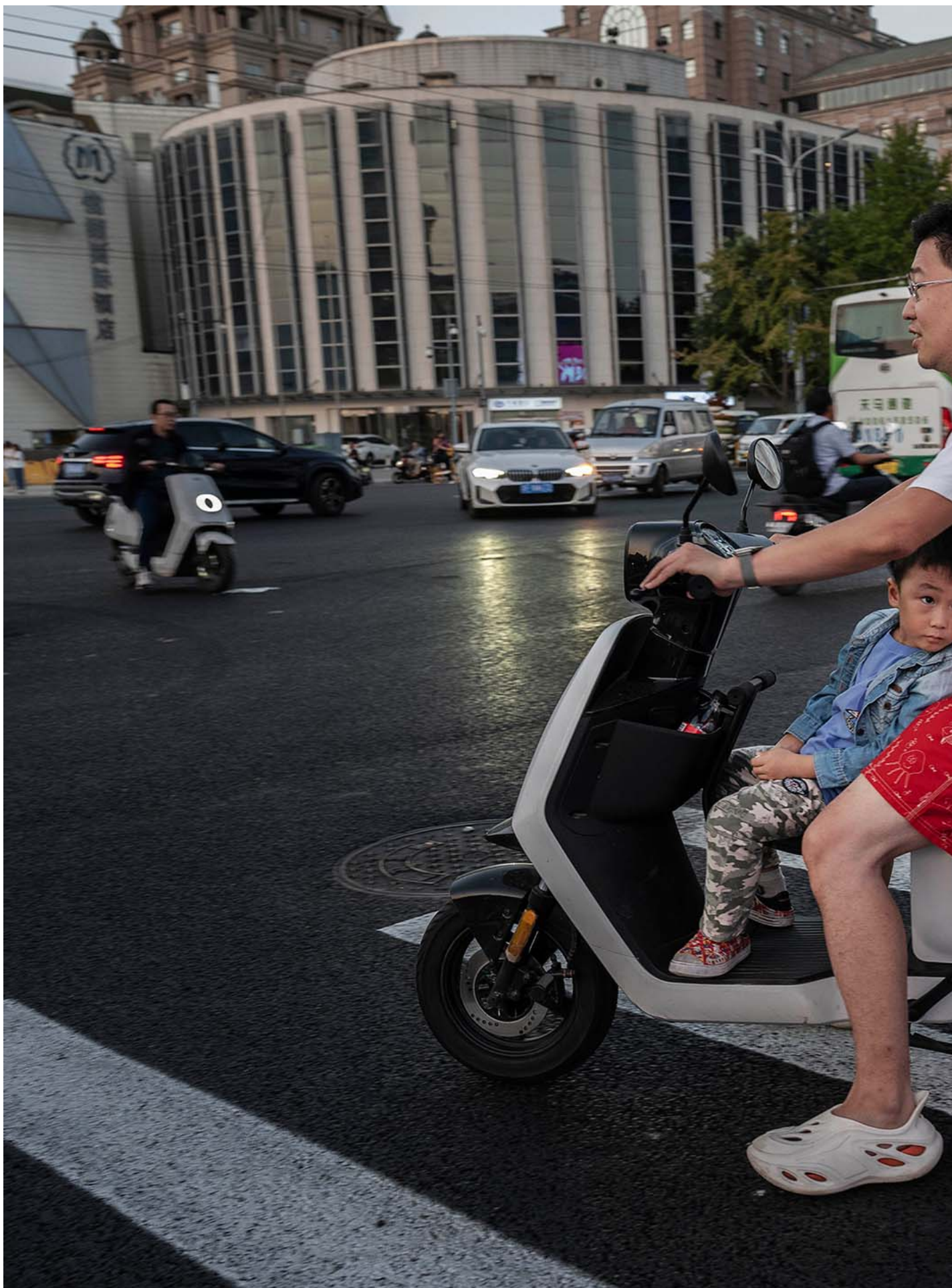
2023年9月13日，中国北京，一家人骑著摩托车在马路旁边等待。

小黄：对，然后这次我就发现她根本就不在乎我结不结婚，可能生孩子也不是一定那么重要，她只是需要我被人照顾。