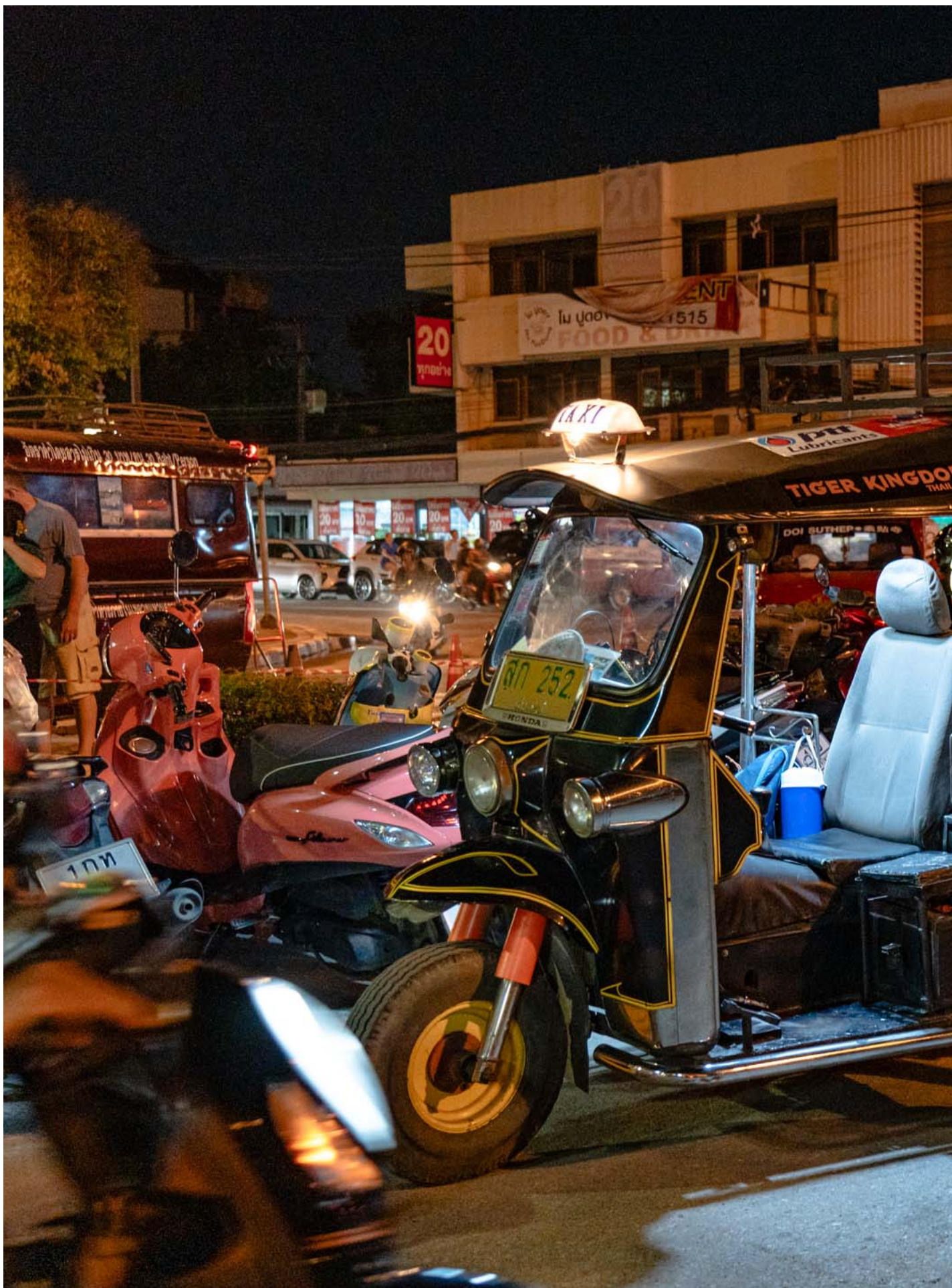
泰国清迈的夜市。

小黄：我觉得有，因为那几天都是基本上都是我弟和我在伺候我爸妈，他们不想去吃饭，那我们就在外面吃饭，带他们去菜市场。他们不想让我做饭，那他们就自己做饭，然后那我洗碗。我弟是司机，全程都是他开车带他们去逛街。