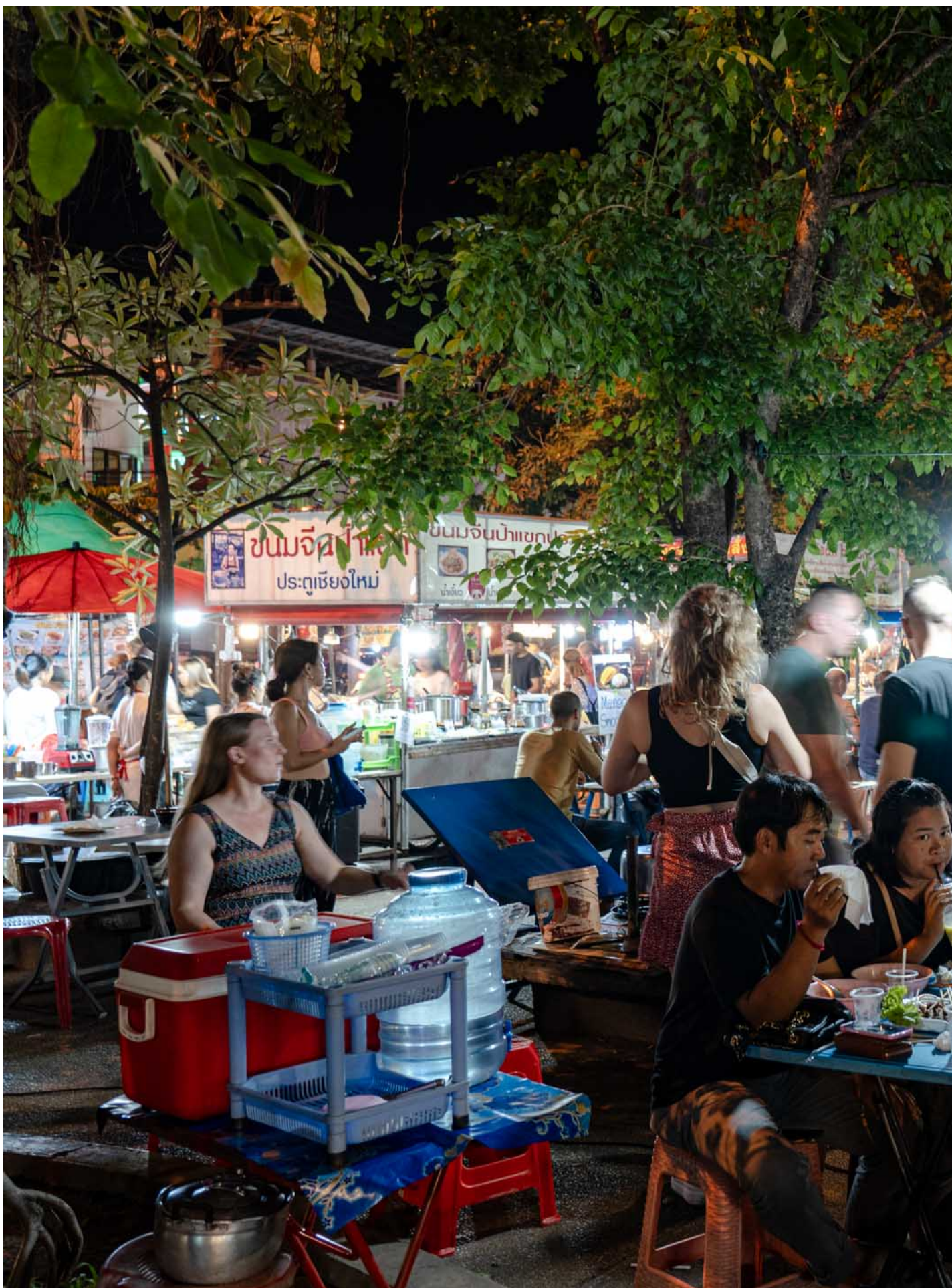
泰国清迈的夜市。

小黄：对，然后他们不喜欢吃泰国菜，觉得太甜太酸太辣，反正 Everything was too much for them. 我们大概是第一天是在古城里走了大概不到 10 分钟，我妈就不行，受不了太热要回去。总之我当时就在一个，“我已经为你们组织了这一次的家庭的旅行。我买了机票，我给你们搞了签证，我租了这个 Airbnb，我做了这个行程，你们什么都不满意”——又回到了小时候的那种无论我做什么，我的父母都不满意的状态。大概到了第二天就开始好转，因为我带我爸妈去做了泰式按摩。