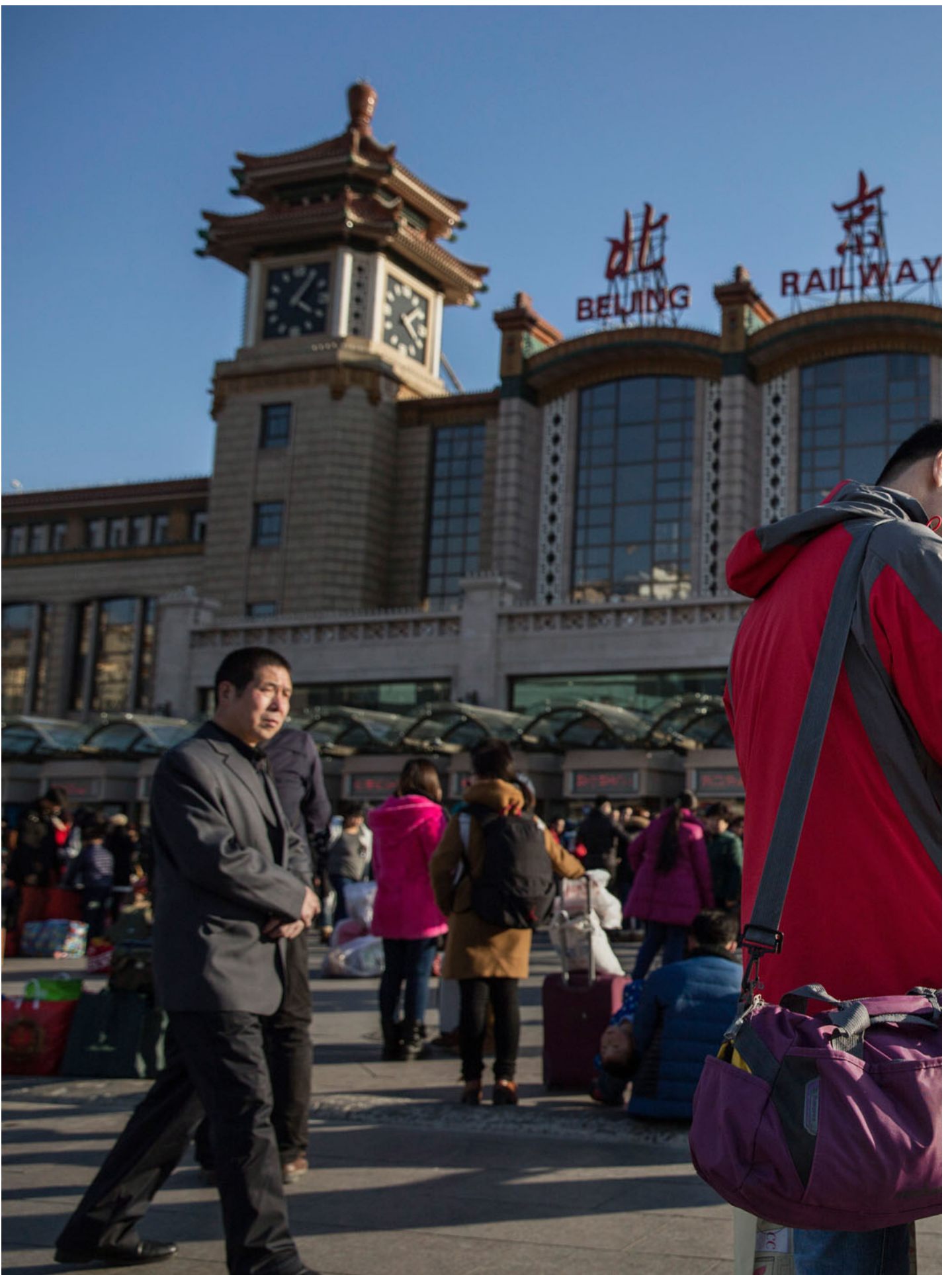
2015年2月17日，中国北京，春节假期前，市民在当地火车站外告别。

小黄：尤其是我觉得这三年之后，会更加觉得和父母的相聚一年比一年不容易，可能以后会更不容易。我应该是意识到了以后见一面少一面这件事情。但是我会我又觉得说我们都有各自的人生要过，父母的的生活是他们的生活，我的生活是我的生活，我能够做到尽可能地和他们一年见一次，不管是在纽约还是在其他的地方，保持这样的频率，我就觉得已经很不错了。其实甚至我觉得，这次在国外见，比我以前回国和父母相处的状态好太多了。