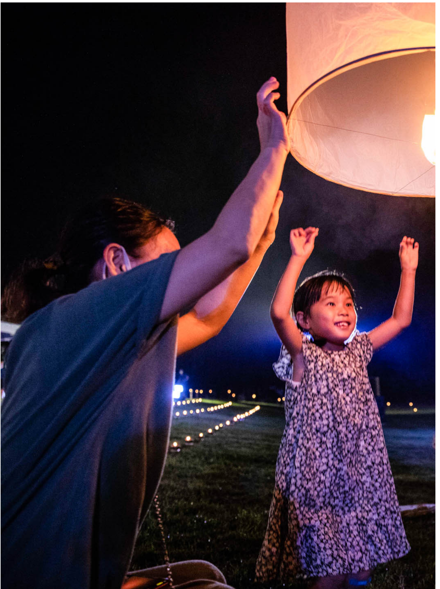
2021年11月20日，泰国，一年一度的天灯节。

小黄：去之前我有跟家里要过一些吃的东西，带回美国的梅干菜之类的。我很意外的是他们给我拿了三大盒月饼，因为我爸大概在临走前几天问我要不要吃月饼，我说可以，来，给我带一个月饼。