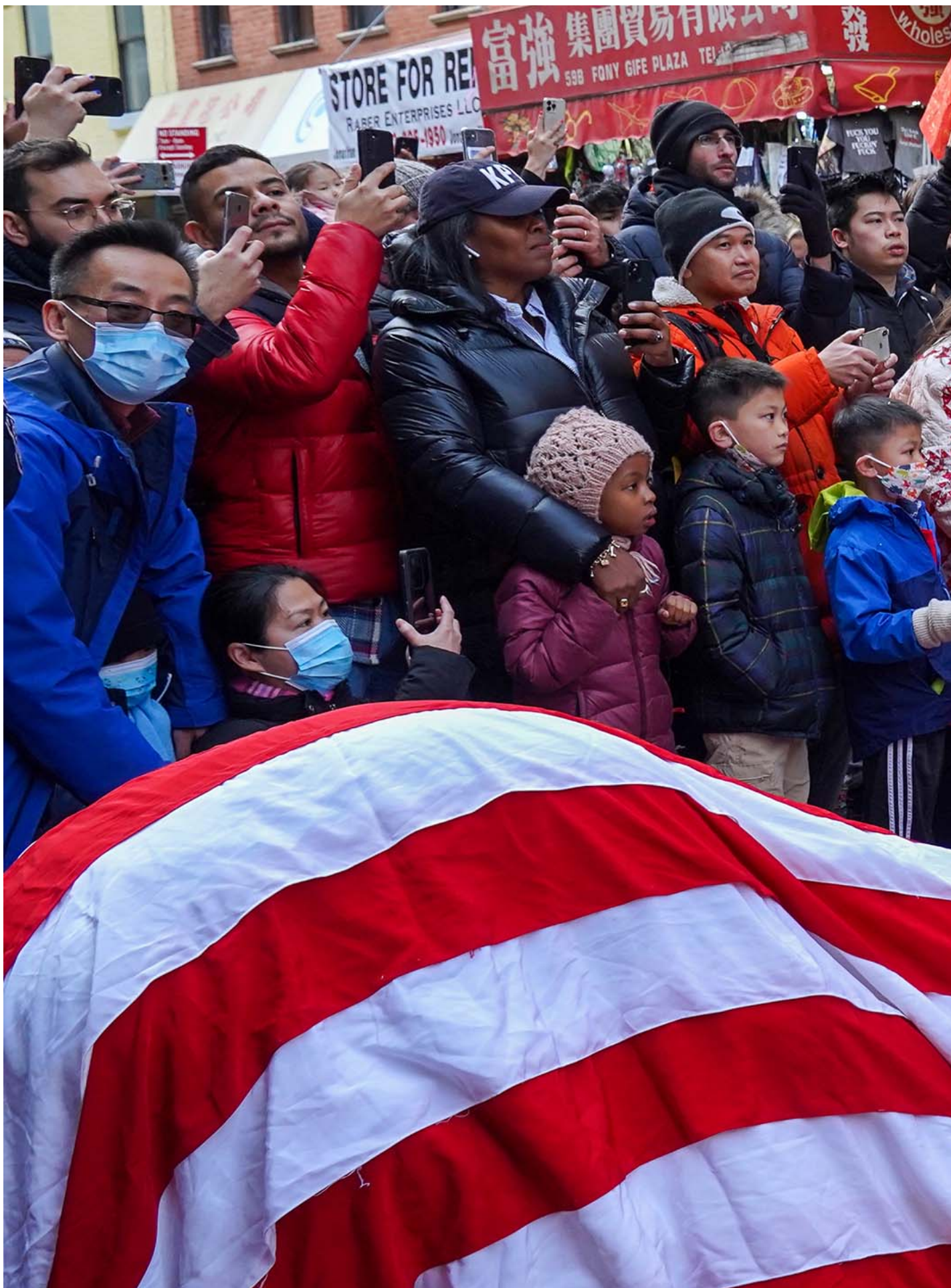
2023年1月22日，美国纽约，唐人街的居民在庆祝农历新年。

我就说纽约？那不是随时都能来的事情吗？所以我觉得其实这一次见完父母，其实心里的一块大石头放下了。