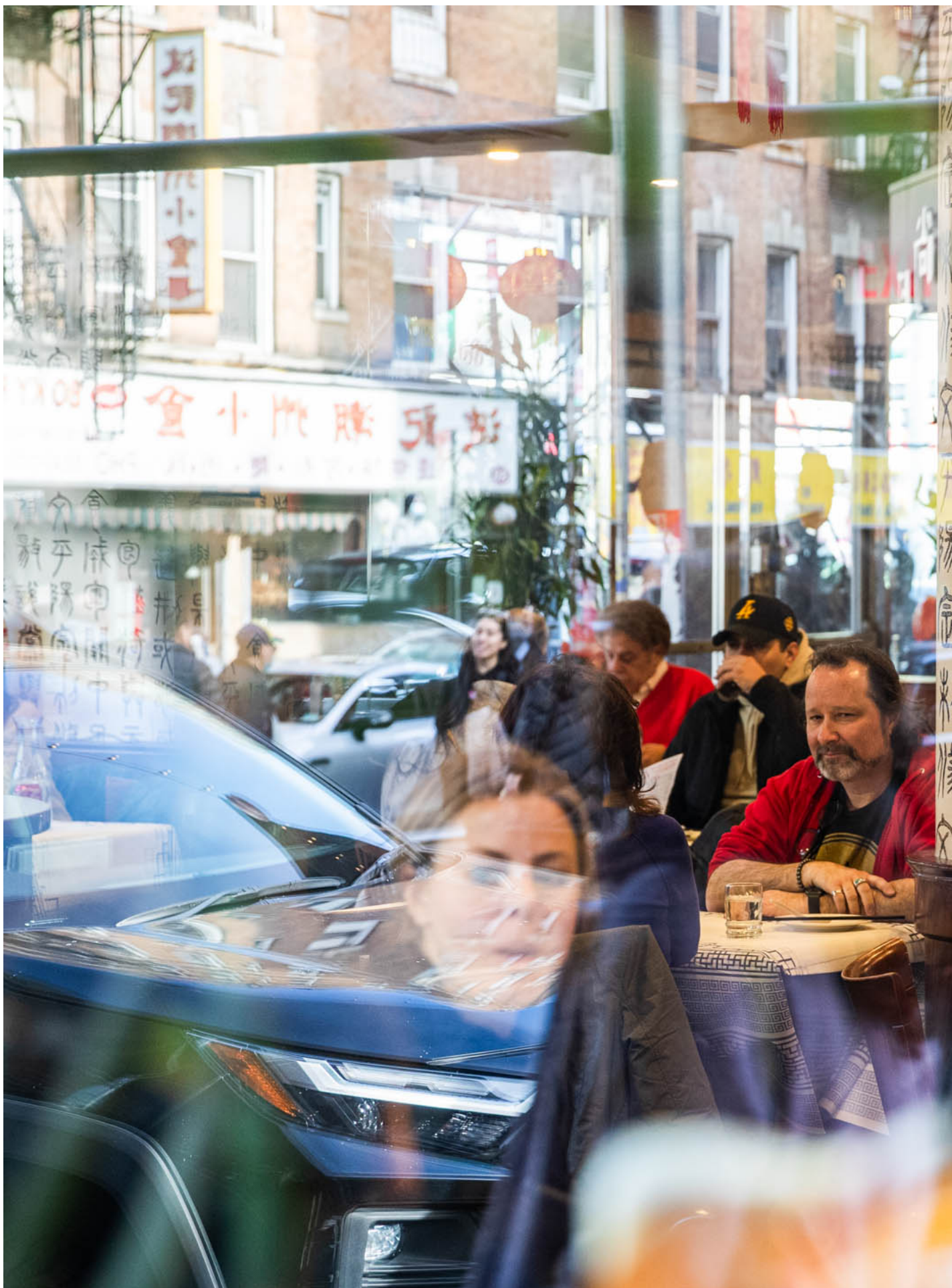
2023年1月28日，美国纽约，唐人街的中餐馆。摄：Liao Pan/China News Service via Getty Images

东尼：也不光是拖延，其实这件事情比起几年前复杂了非常多。我们的世界已经不一样了，我们自己的生活也不一样了，所以其实这件事情真正的难度是很大的，要协调一家子怎么去旅行，怎么做让大家聚到一起来。