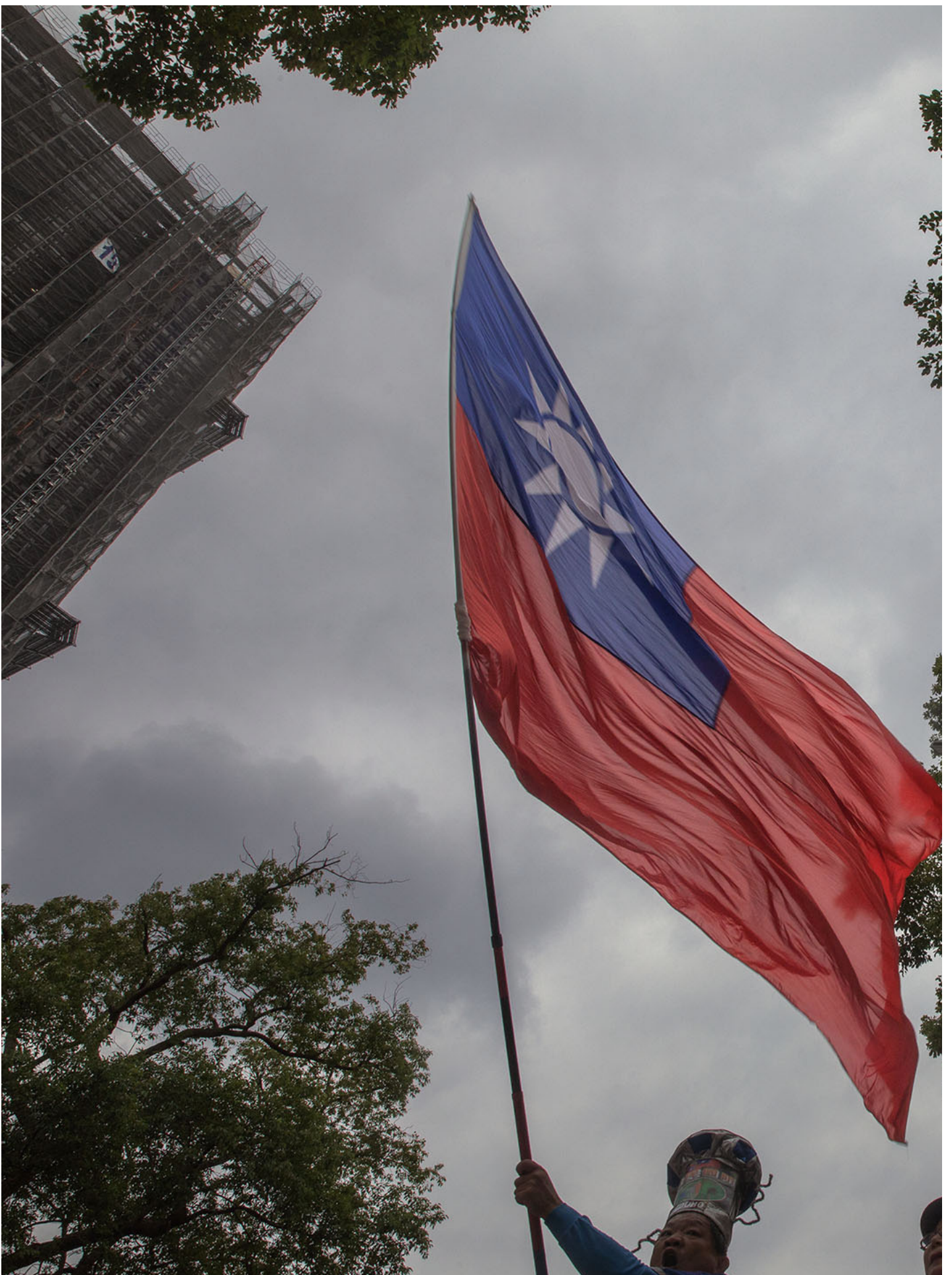
2023年11月24日，台北，国民党总统参选人侯友宜和其副手中广董事长赵少康前往中选会登记参选，国民党的支持者到场摇旗呐喊。

面对蓝白合问题，赵少康指侯友宜去年竞选连任新北市市长，大赢对手四十几万票，显示侯的政绩在新北市受到肯定，反观柯文哲竞选台北市市长连任时，差点落选。接下来他与侯友宜会南北分工，相互合作、互补。最后他更向蓝营支持者喊话，希望蓝军能够归队，“集中力量、集中选票，才会赢”。