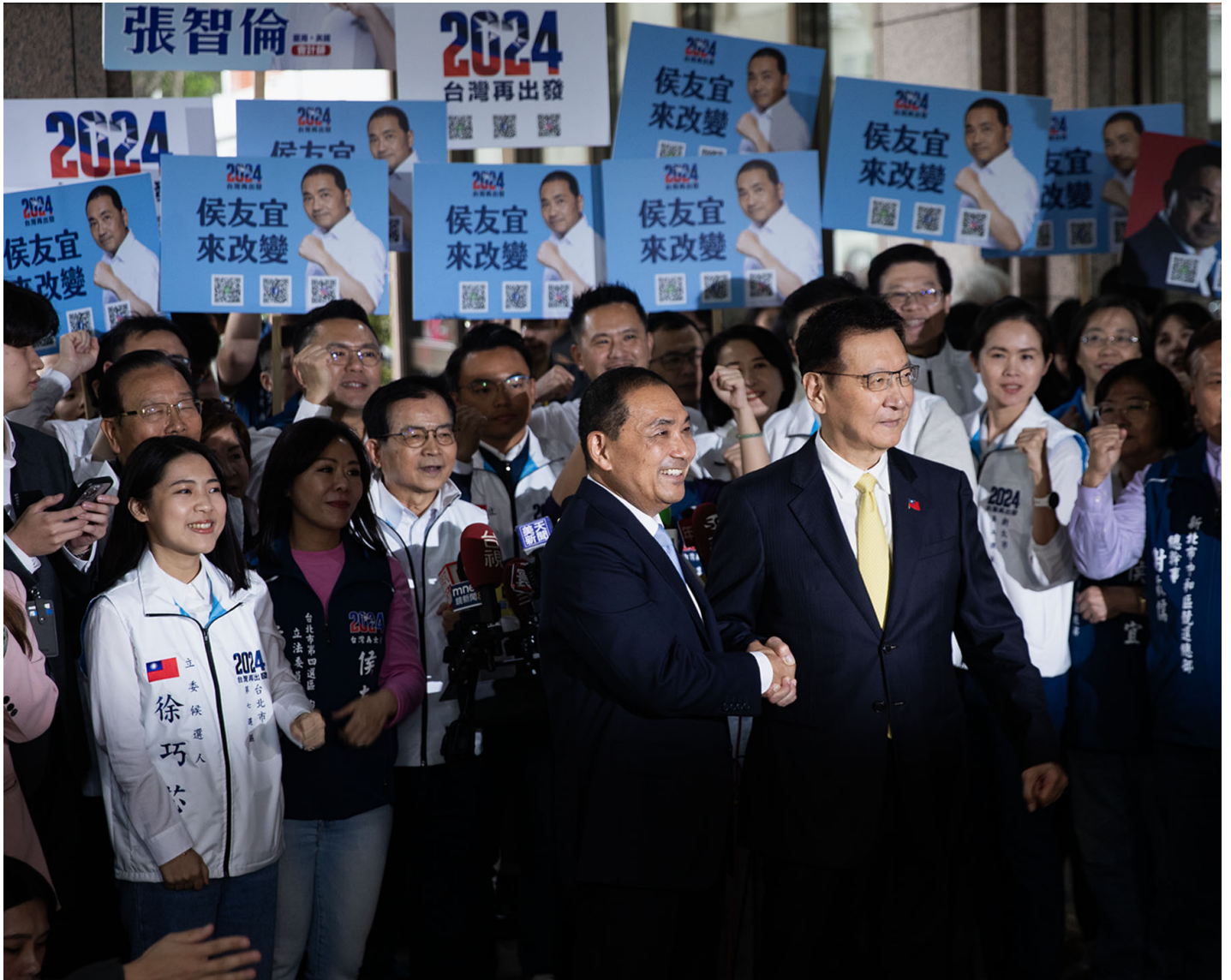
2023年11月24日，台北，国民党总统参选人侯友宜和其副手中广董事长赵少康前往中选会登记参选。