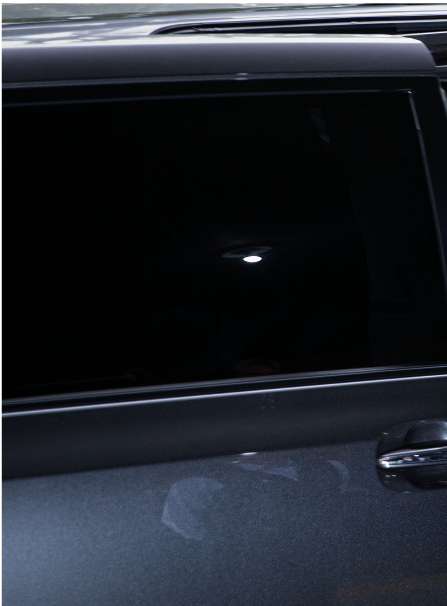
2023年11月24日，台北，国民党总统参选人侯友宜和其副手中广董事长赵少康前往中选会登记参选。

侯友宜曾表明反对台独，也反对一国两制，分析指他在两岸关系和台湾前途议题上较国民党其他人选倾向于更温和的路线。他也在确定征召后表示，会做出让人民有感的成绩，重点是“好好做事”，因此以台语发音与“侯”类似，故“侯侯做代志”便成为他竞选市长期间的口号。不过，他的地方性强的特性也被外界质疑能否胜任国际外交工作。