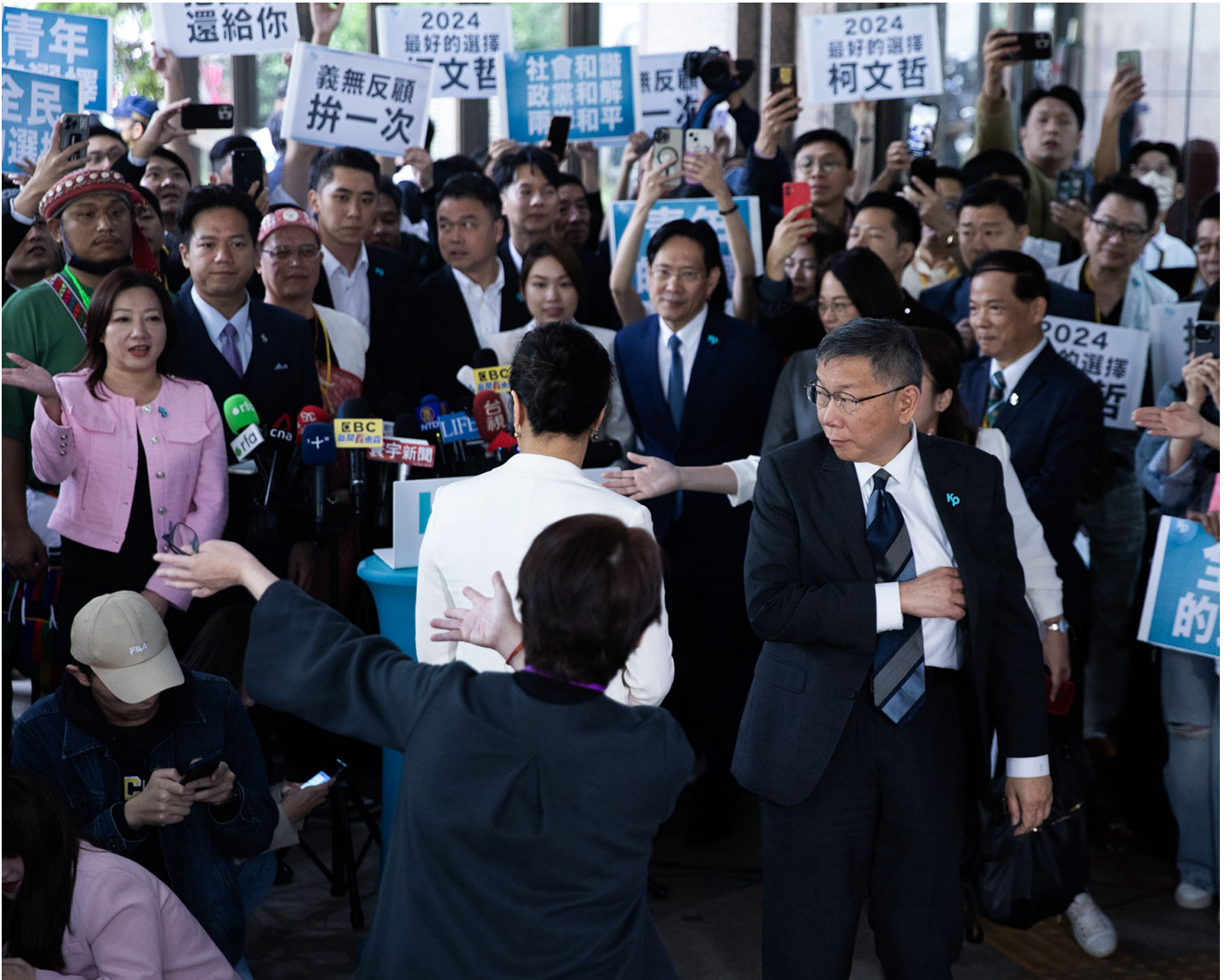
2023年11月24日，台北，台湾民众党主席兼总统参选人柯文哲与副手吴欣盈前往中选会登记。