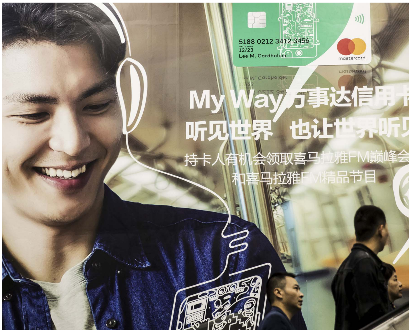
2017年10月13日，人们乘坐自动扶梯经过中国上海农业银行万事达卡的广告。