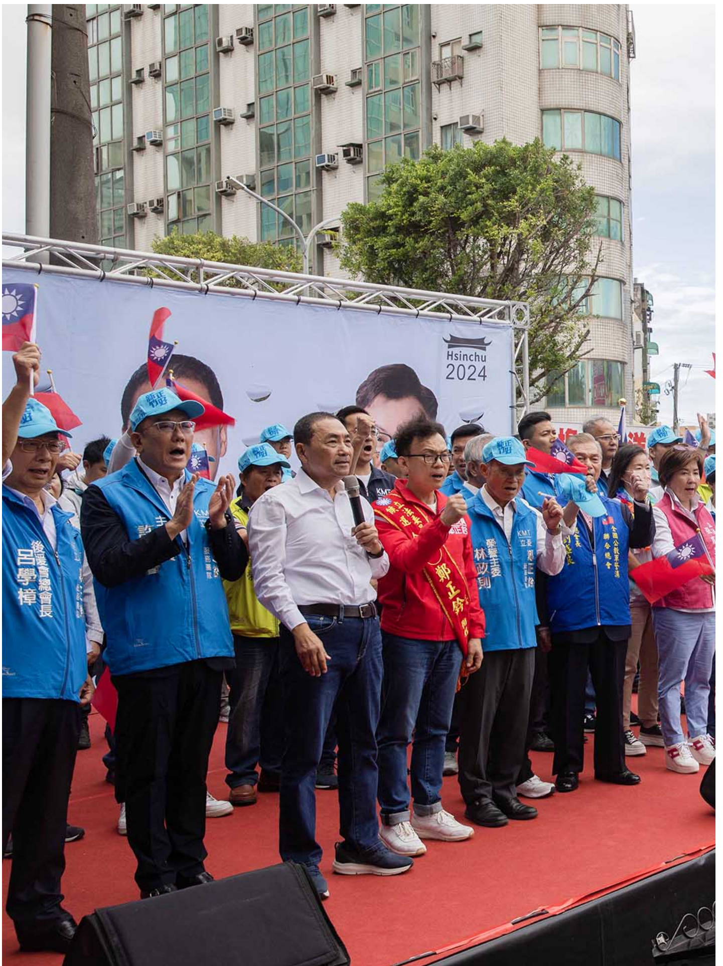
2023年11月12日，新竹，国民党总统参选人侯友宜出席党籍新竹市立委参选人郑正铃竞选总成立大会。