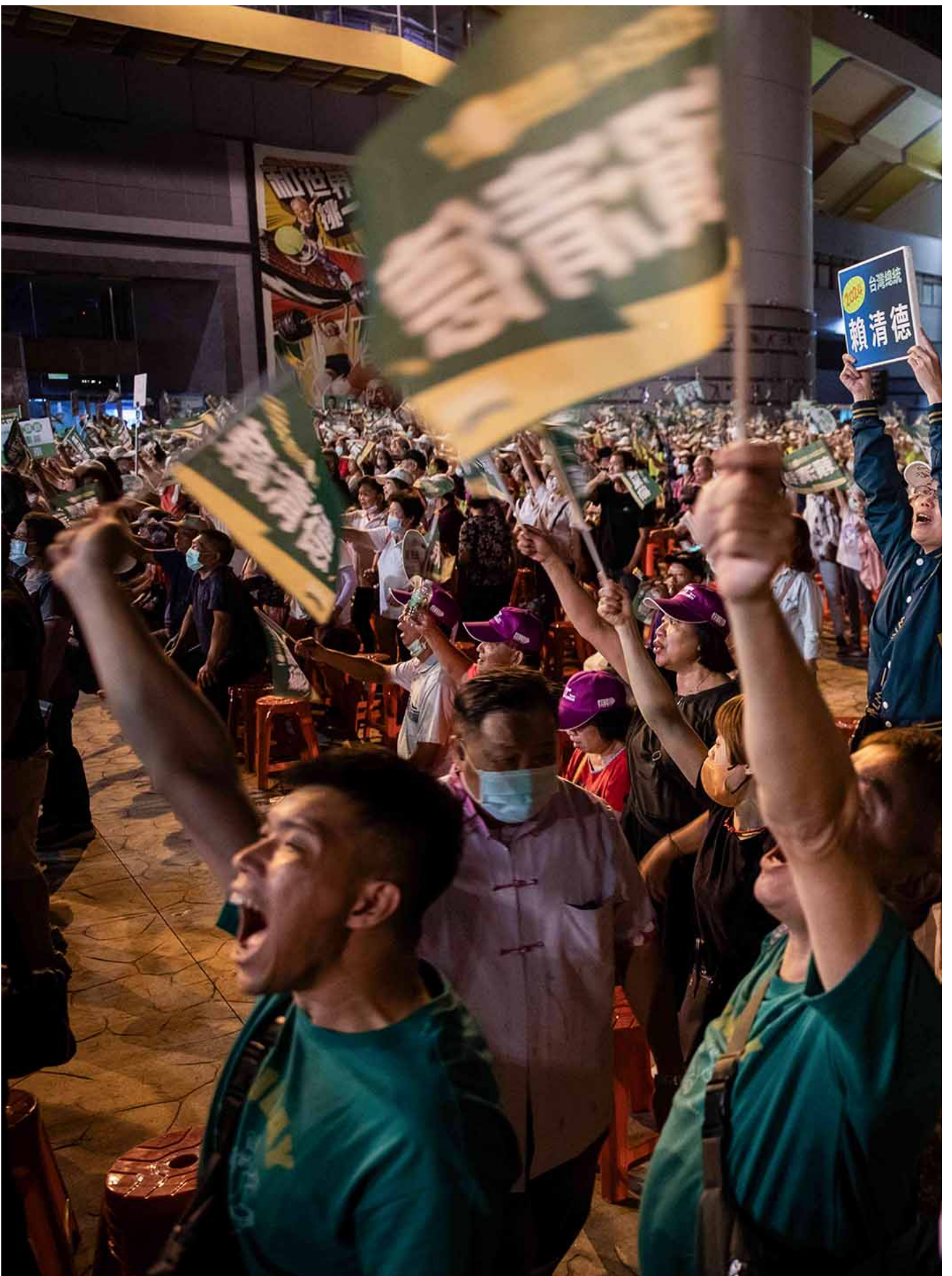
2023年11月5日，板桥第一运动场，民进党总统参选人赖清德举行新北市竞选总部成立造势活动。