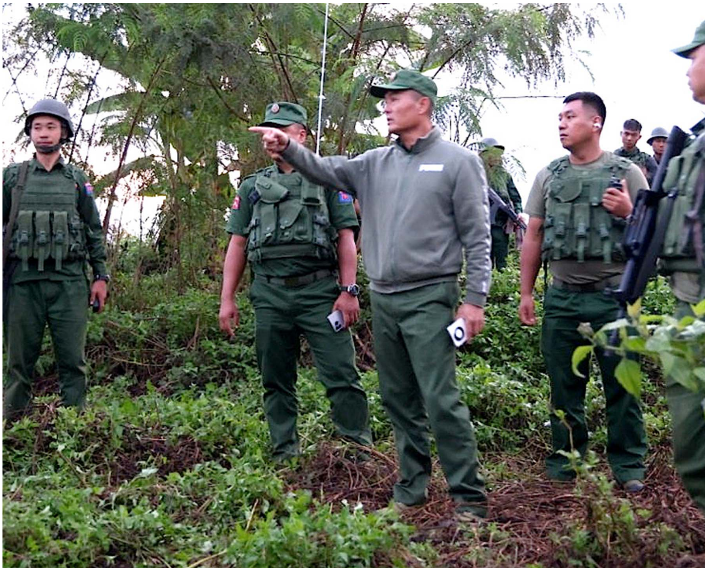
缅甸民族民主同盟军。

缅东北的变局，是缅甸各地战争烈度升级一部分。“反诈”，也许更多是为了“师出有名”的宣传。