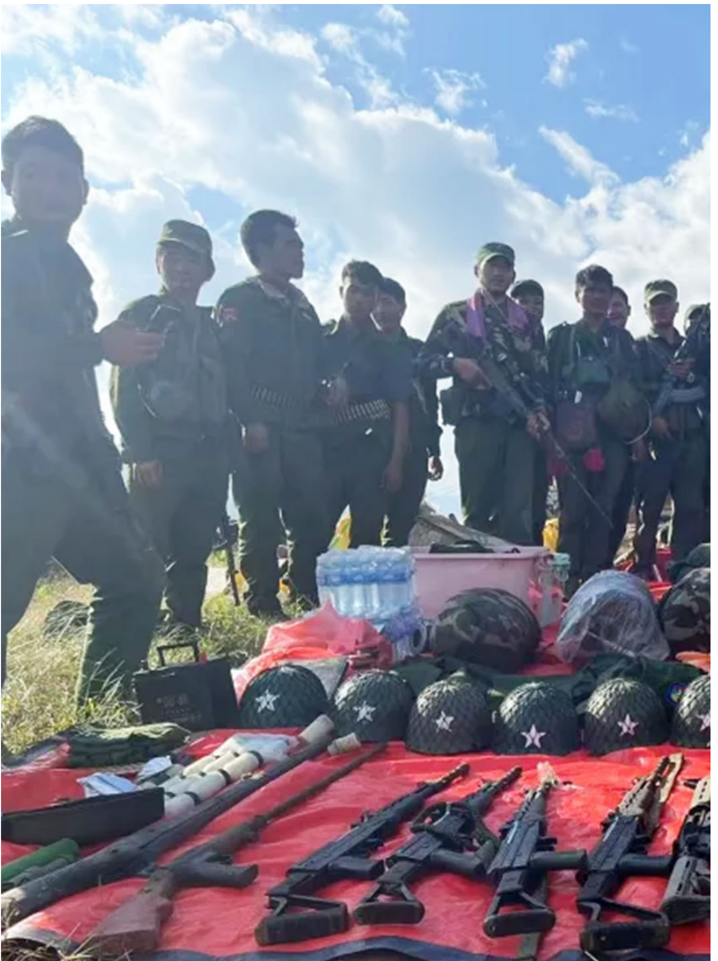
民族民主同盟军占领据点后的画面。

11月1日，中国仅剩的三个国务委员之一的公安部长王小洪罕见出访缅甸，并会见军政府领导人敏昂莱。同月12日，浙江温州公安宣布对明学昌、明国平、明菊兰、明珍珠4人公开悬赏通缉，直指果敢核心家族。通缉令发布后，缅军将近年来一直是果敢代理人集团成员的后三人移交中国，而明学昌则被指“畏罪自杀”。