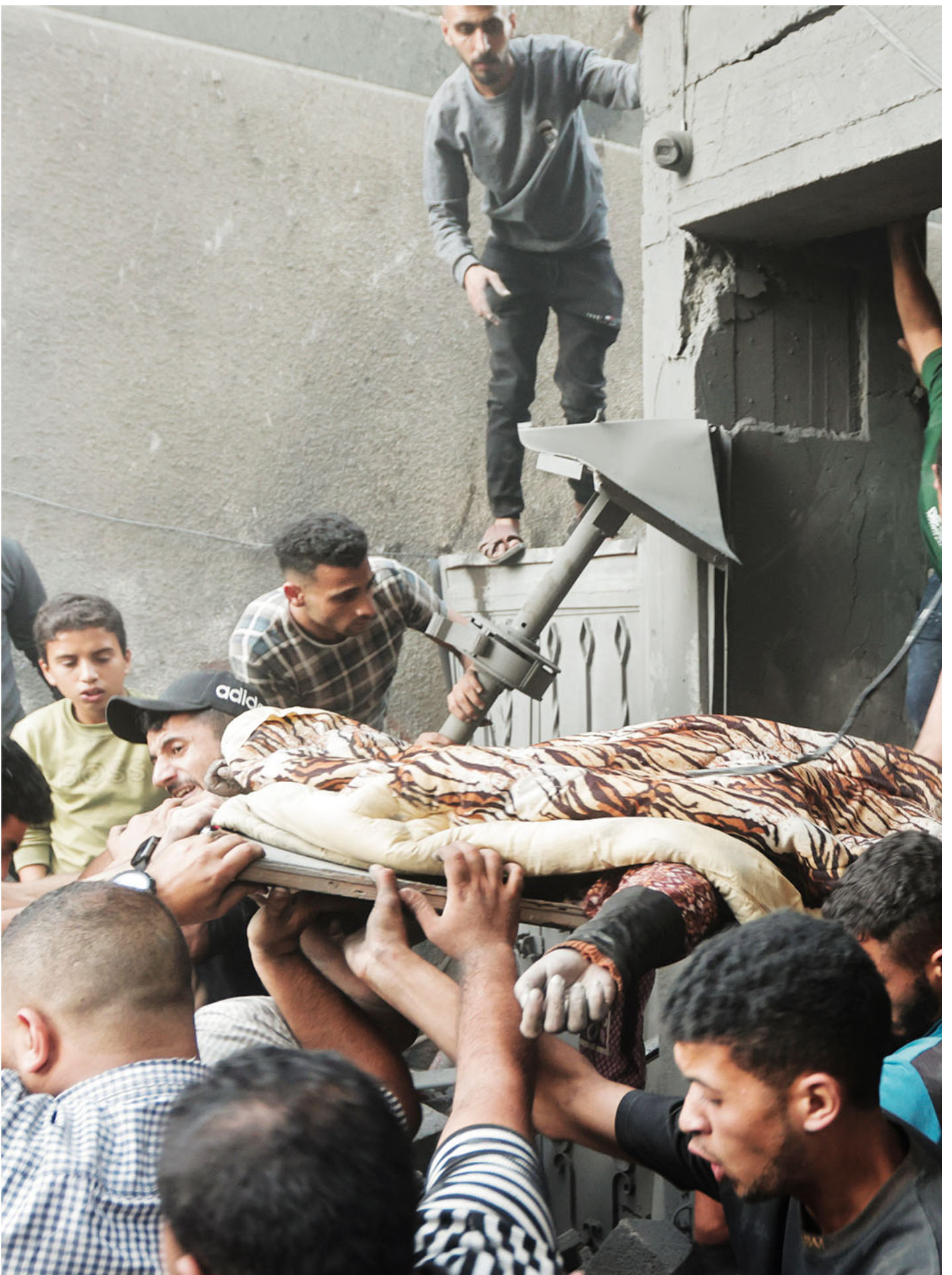
2023年11月18日，以色列空袭加沙后，巴勒斯坦人在被毁房屋的废墟下发现一具尸体。

从以色列视角出发，更为直接、恰切的类比和例子则就在眼前。那就是1982年的 黎巴嫩战争 。2005年，强硬派以色列总理沙龙选择单方面结束对加沙占领，拆除犹太定居点并撤退回以色列边境（但是保留对加沙领海、领空、陆地关口的全面控制），是出于理性的政治计算而非什么单方面的善意。作为利库德集团贝京内阁的国防部长，沙龙是1982年入侵黎巴嫩的第一手策划与执行人。以色列在当时的战略目标同样是驱逐盘踞在黎巴嫩南部巴勒斯坦难民营的巴解组织，斩除巴解武装派系对以色列北部越境安全威胁。