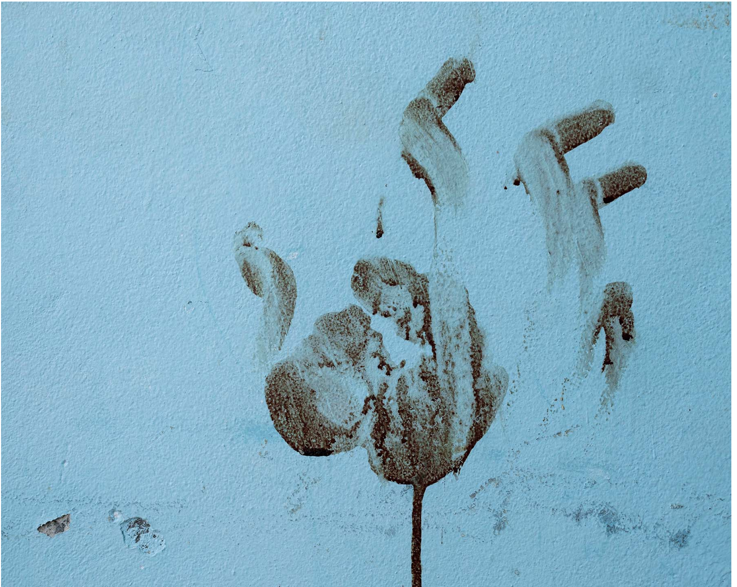
2023年11月9日，在加沙地带，防空洞墙上印有一只手的血迹。

以色列寻找安全伙伴的可行性渺茫，继续单方面撤退不可接受的前景下，对加沙的重新占领成为战后最可能的情况。