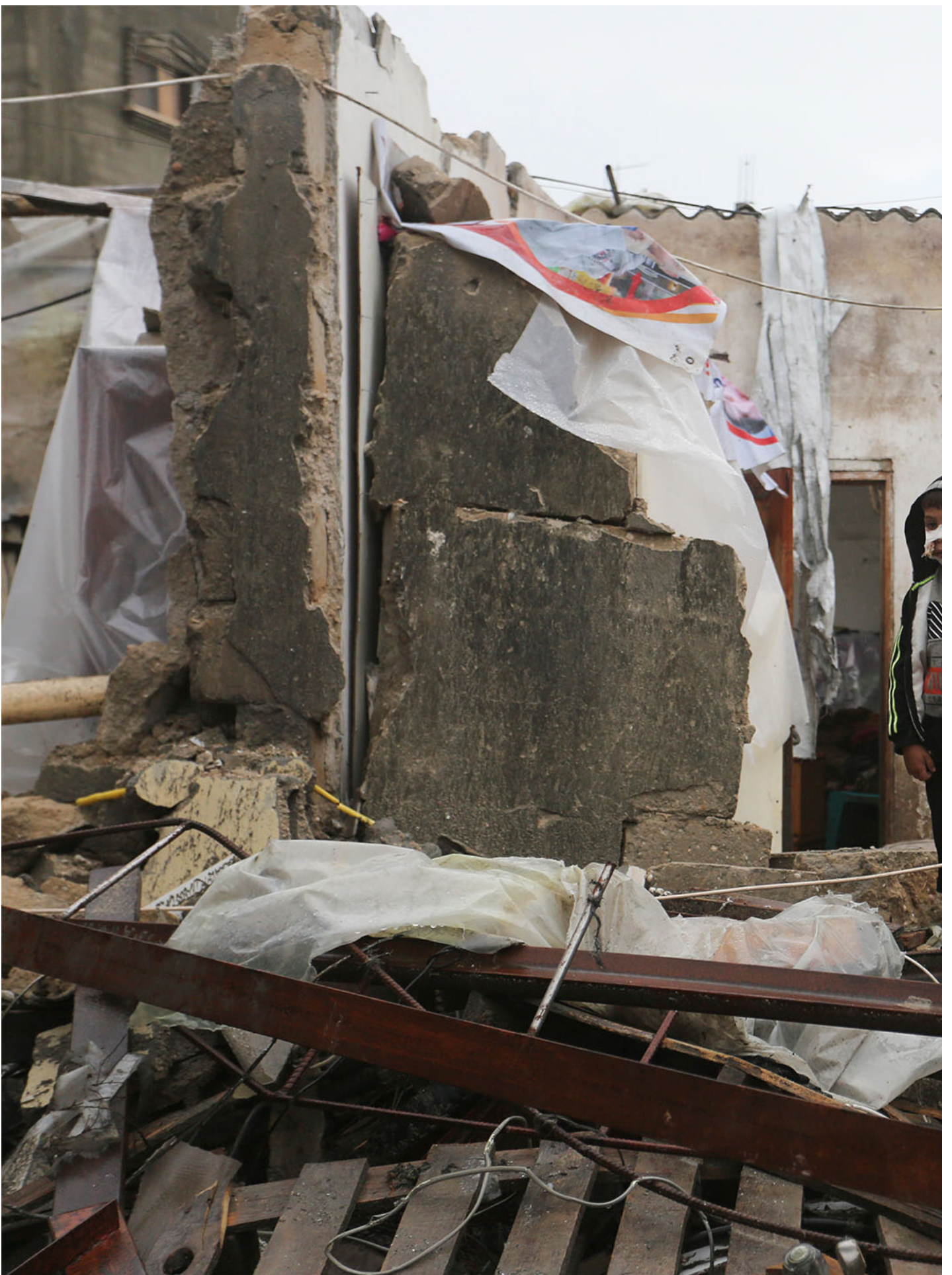
2023年11月15日，以色列袭击加沙地带后，一名巴勒斯坦男孩站在废墟中。

从哈马斯表现出的高协同、多领域作战的效能来看，以色列定期空袭的割草战术（mowing the lawn）没能阻止哈马斯发展出精巧与高度协同的军事能力与指挥手段。从军事角度来说，哈马斯的作战在面对世界上最强大的情报能力的军队，实现了战术奇袭，以联合武装作战的方式发动了旅一级别的摩托化步兵突击：这不是“独狼式”的“恐怖组织”，而是一支训练良好、作战意志坚定的军队。以色列围绕加沙建立的情报网与高科技隔离墙都没能有效地制止这一大规模地面入侵的发生——自1948年的第一次中东战争以来，以色列本土第一次遭受如此惨重的损失。这意味着，以色列通过拒止的威慑已经失败。哈马斯在袭击中取得的令人震惊的成功，一方面严重打击了以色列情报部门与以色列国防军“不可战胜”的形象，另一方面也让以色列针对之前小规模袭击的报复手段相形见绌。