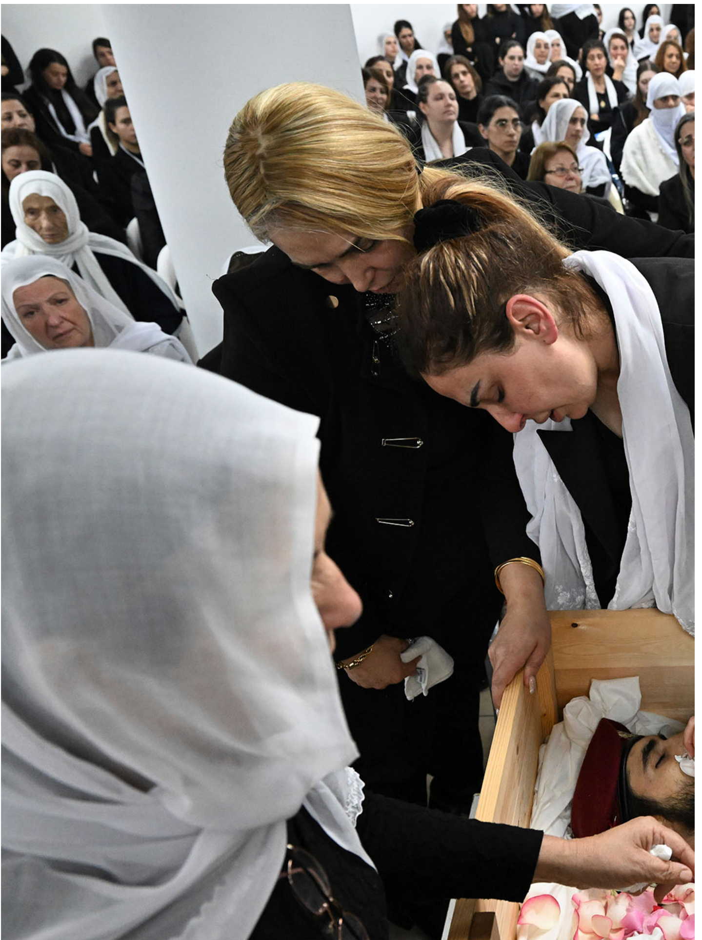
2023年11月19日，以色列举行战事身亡的士兵的葬礼。

这两根大棒加一根胡萝卜的“不是战略的战略”至少在过去的15年间卓有成效。相对于其他地区的混战，巴勒斯坦和以色列的“平静”局面让以色列、美国、乃至阿拉伯国家认为巴勒斯坦问题已经走向中东战略图景的后台，可以在他们的战略规划与计算中充当背景板的角色。