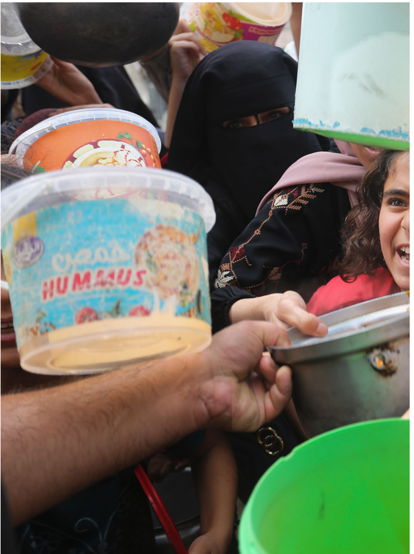
2023年11月13日，以色列袭击加沙地带后，巴勒斯坦的孩子们排队领取食物。

在目前以色列寻找安全伙伴的可行性渺茫，继续单方面撤退不可接受的前景下，某种形式和程度的对加沙重新占领似乎又成为战事结束后最可能的场景。