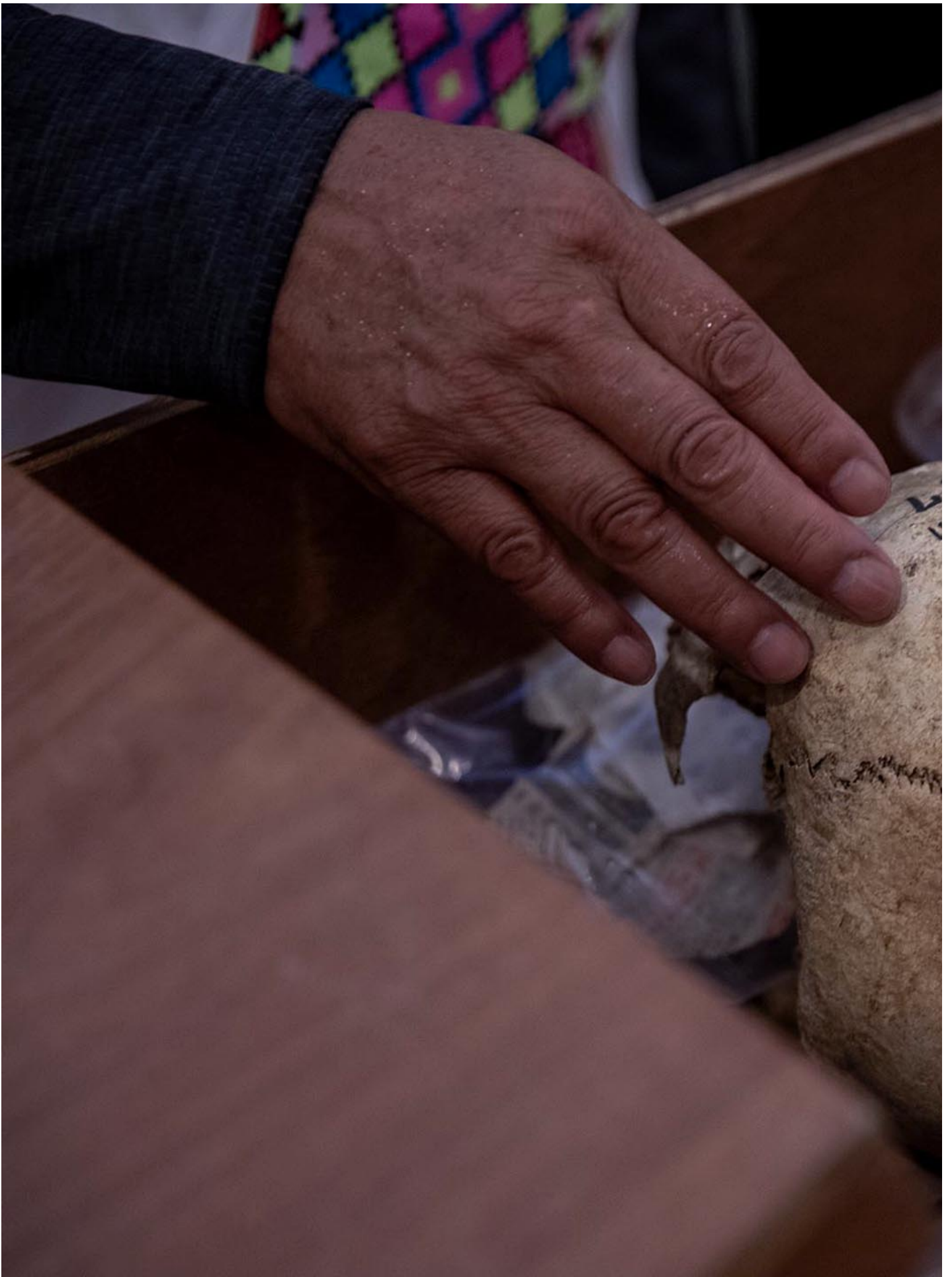
2023年11月15日，台大医学院，马远部落的布农族人抚摸祖先遗骨。摄：陈焯辉/端传媒

族人尝试突破警力不成，又一次一次尝试；台大原住民学生拿着抗议布条入校，最初亦受阻挡，而后在旁人抗议之下，校方被迫放行，由台大主任秘书王大铭带进去，但当学生入内后，校方又以“入校布条要受到审查”为由，没收族人所做的抗议布条。学生们直播整个过程后，出面泪诉：在5月言论自由月践踏原住民的风波后，我们仍然受到这样的对待。