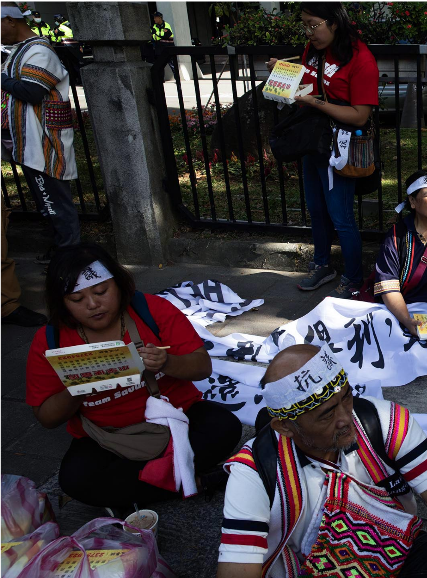
2023年11月15日，台北，马远部落的布农族人到教育部外抗议。

每段行程，马远部落皆会以布农语“报战功”，“报战功”的内容约略如下：布农加油、还我公道、台大道歉、还我祖先、誓死达成、没有退路。