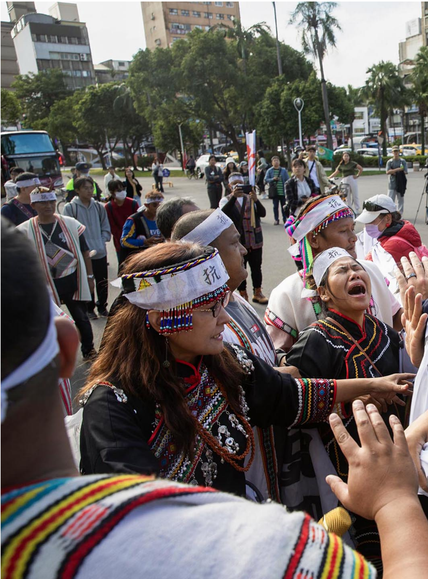
2023年11月15日，台北，马远部落的布农族人到国立台湾大学外抗议。

就读台大的原住民学生原本相伴在侧，此时也加入推挤。有女同学因深感不舍，以毛巾抹泪，自头到尾都哭到不能自己。