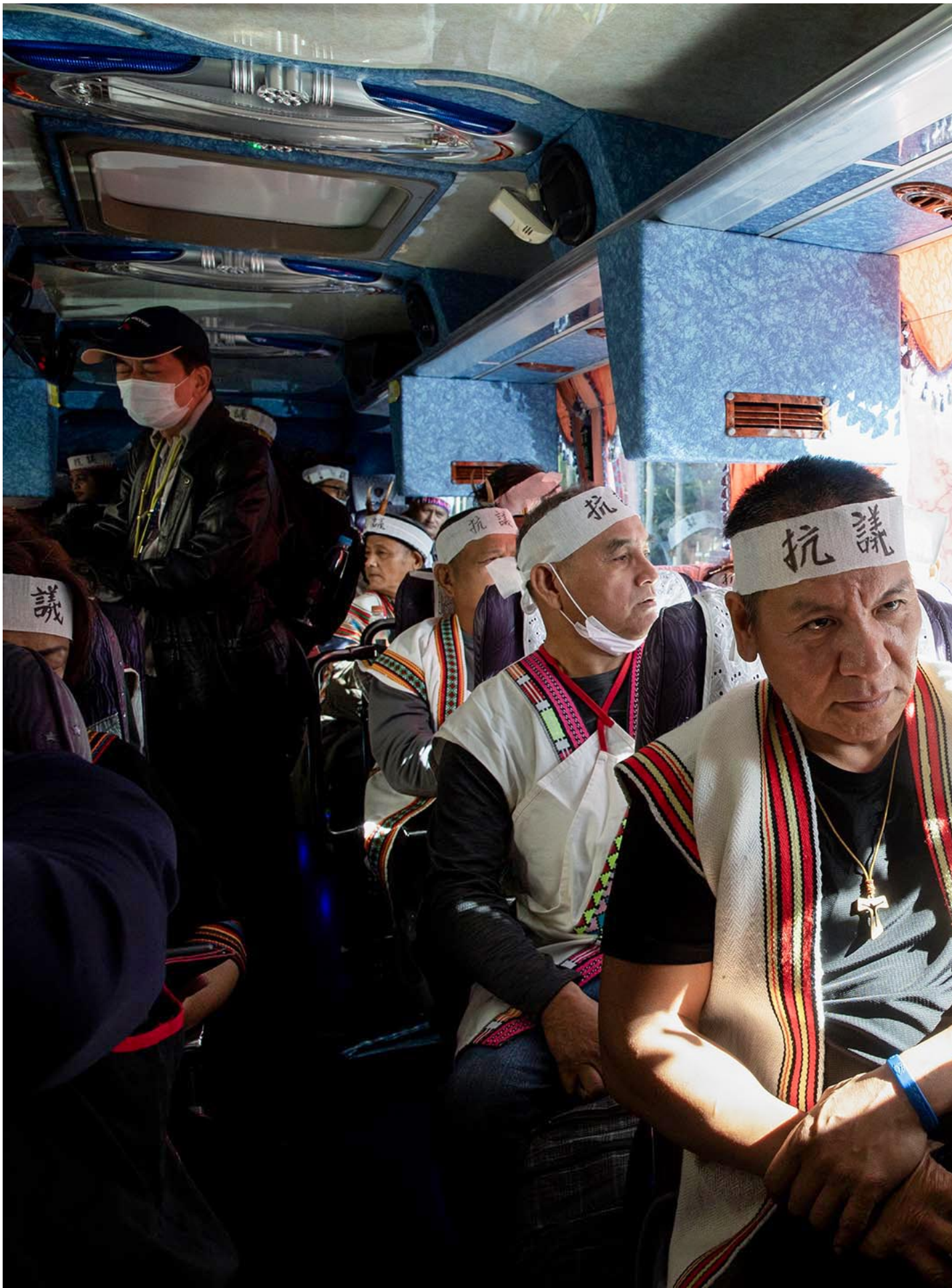
2023年11月15日，台北，马远部落的布农族人乘车到国立台湾大学。

因此，马远部落族人日前申请集会游行，并告知相关部会后，四十余位族人凌晨两、三点搭游览车、花上六、七个小时到行政院，与旅北的族人、长老教会牧师群还有声援的原住民青年会合，呼着口号，唱着 mulumaq（回家吧）要求行政院长出面。