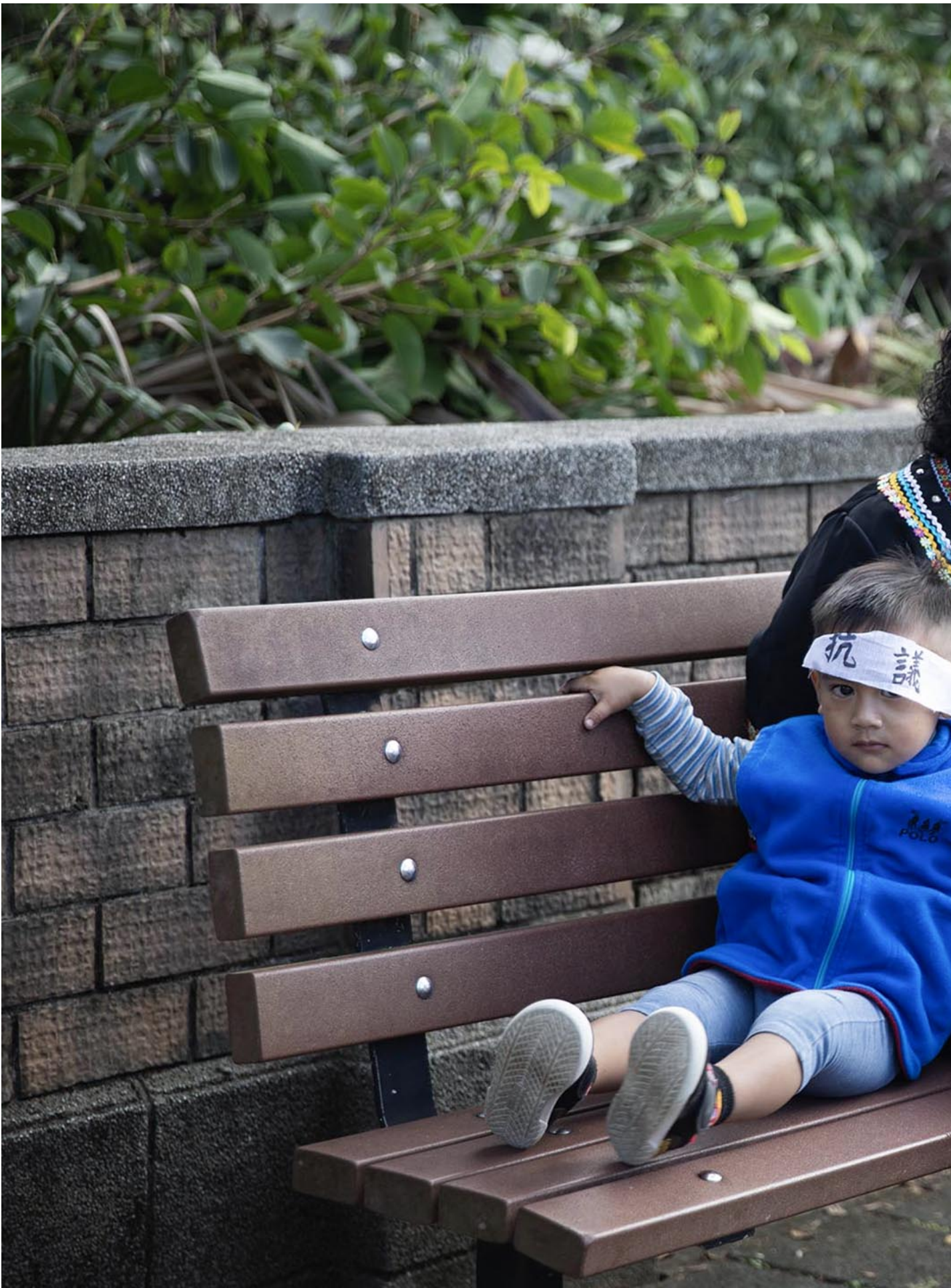
2023年11月15日，台北，马远部落的布农族人到国立台湾大学外抗议。

行政院仅派出处长与教育部专门委员出面协调，族人在递交陈情书后，便步行到半公里外的教育部，请见部长。教育部以部长出差为由，派高教司长出面保证会尽快协调，也电请台大校长陈文章出面。