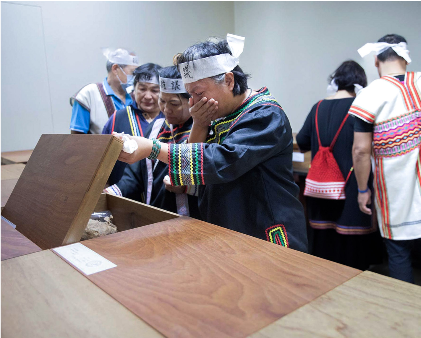
2023年11月15日，台大医学院，马远部落的布农族人揭开放置祖先遗骨的盒子。