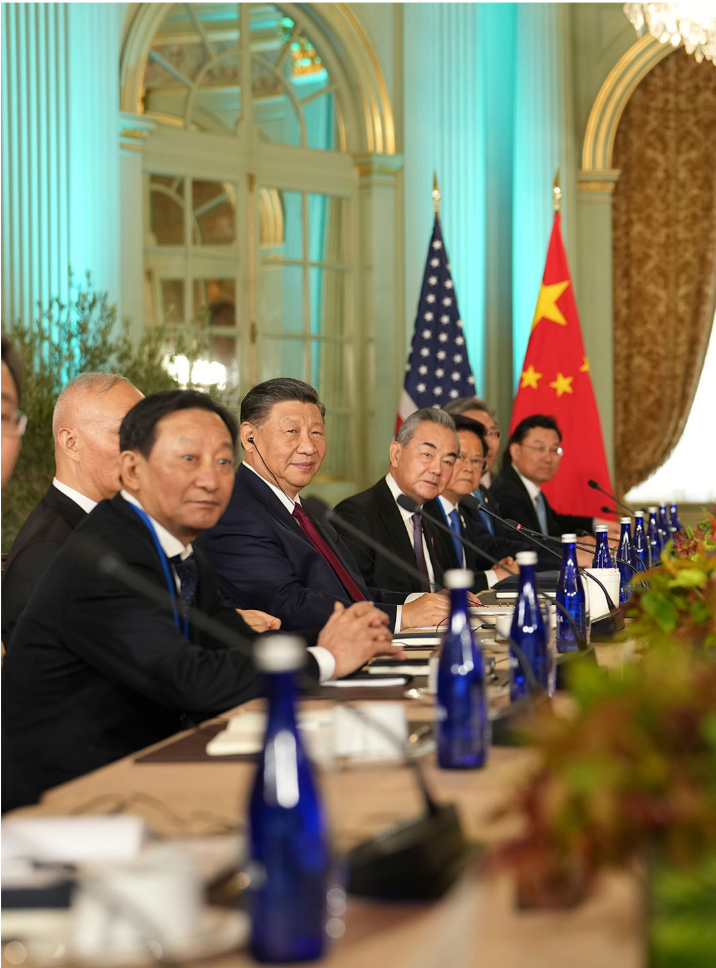
2023年11月15日，美国加州，亚太经济合作组织会议（APEC）期间，美国总统拜登会见中国国家主席习近平。