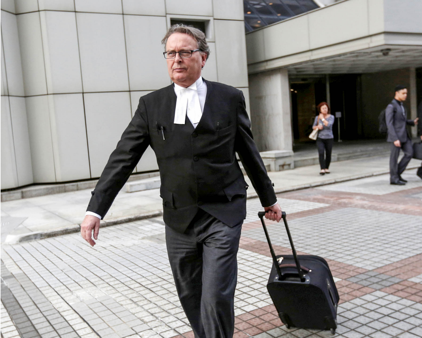
2016年11月2日，英国御用大律师Tim Owen 离开香港高等法院。

Tim Owen曾于2022年受黎智英委聘为其《港区国安法》案件代表律师，最终引人大常委会首次就国安法释法。