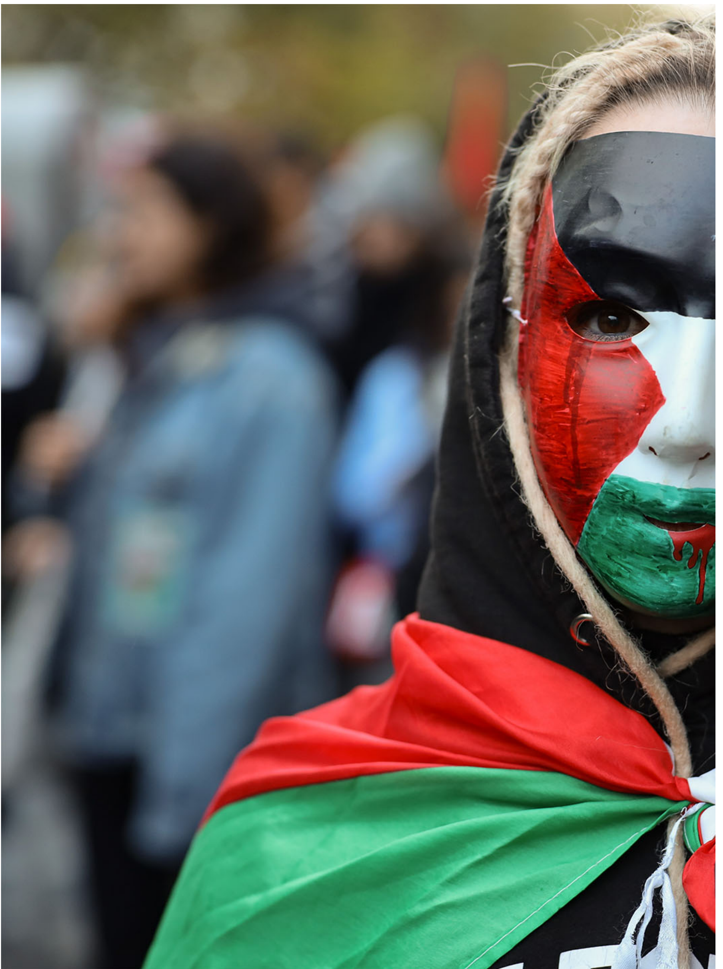
2023年11月11日，法国巴黎，抗议者在民族广场示威时高喊口号，呼吁加萨立即停火。

支持停火的游行人群中，更多可见的是穆斯林移民、法共青年翼和一些其他生态主义、女权主义、LGBTQ+活动家等意识形态相差甚远的左翼团体。反排犹的游行人群则以犹太团体和中老年民众居多，其中有不少是二战时期法国犹太幸存者的后代，他们将如今的时局重新置于二战时期维希法国（Régime de Vichy）的阴霾之下，在这种叙事下，反对谴责哈马斯的梅朗雄和其他左翼成了“维希刽子手的同谋”。（延伸阅读： 《访谈犹太活动家：因为支持巴勒斯坦抗争，我被起诉“反犹”》 ）