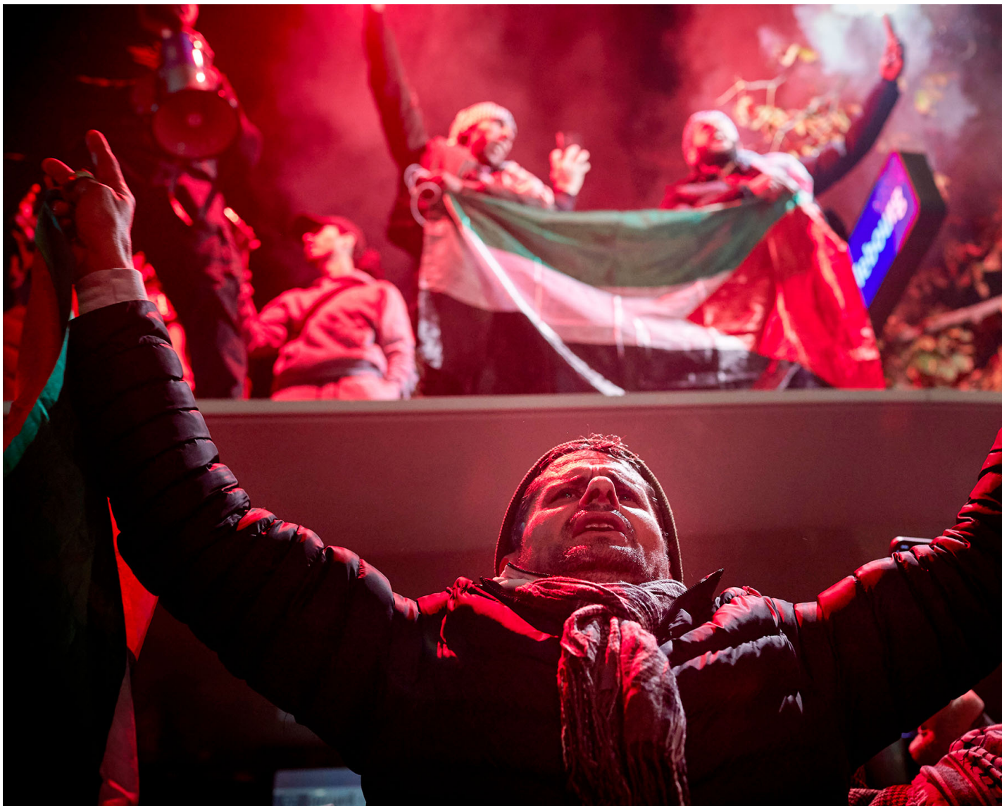
2023年11月11日，法国巴黎，抗议者在民族广场示威时高喊口号，呼吁加萨立即停火。