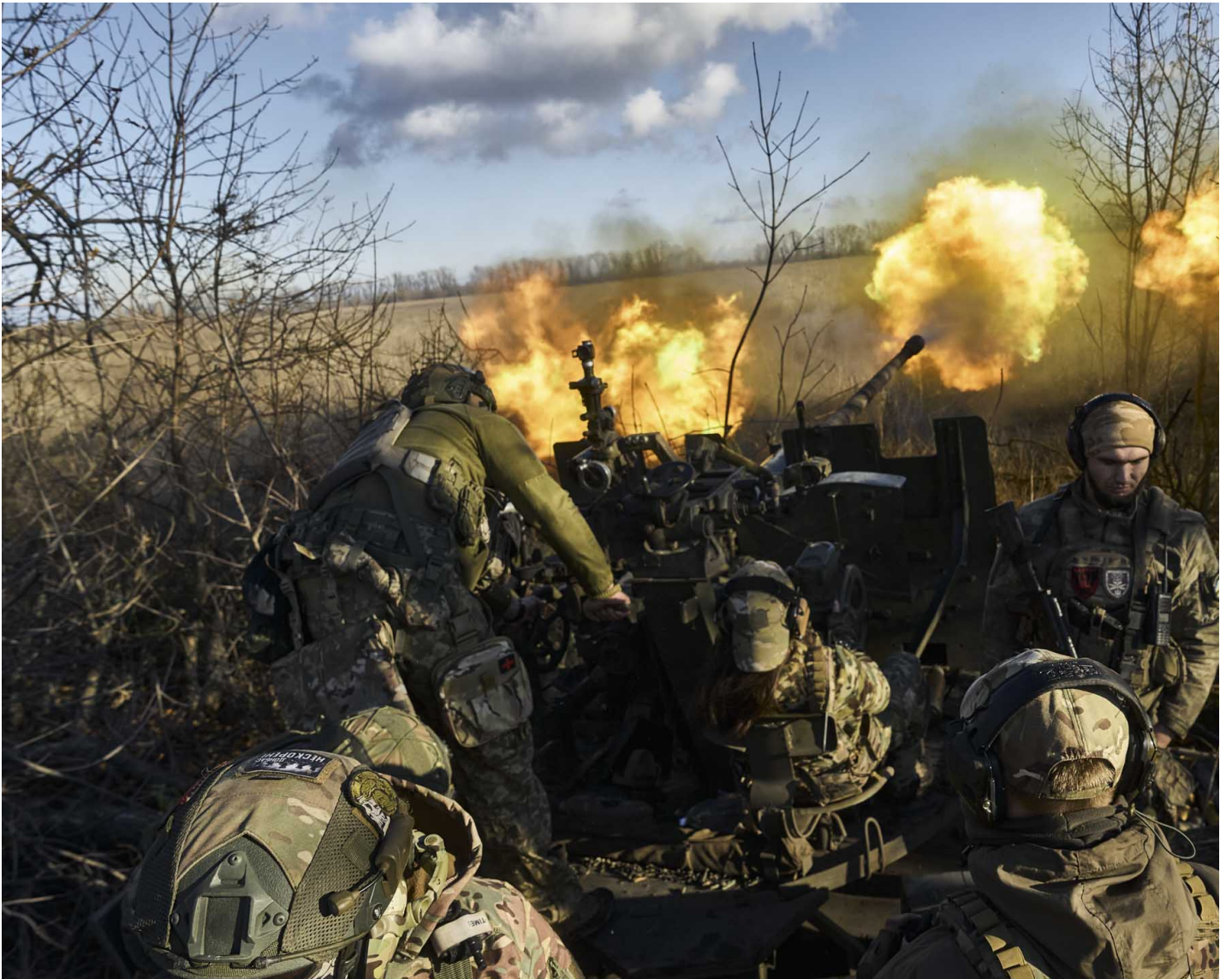
2023年11月10日，乌克兰巴赫穆特（Bakhmut），乌军第56旅成员继续为夺回巴赫穆特而战，士兵向敌方发射 AZP S-60 自动高射炮。