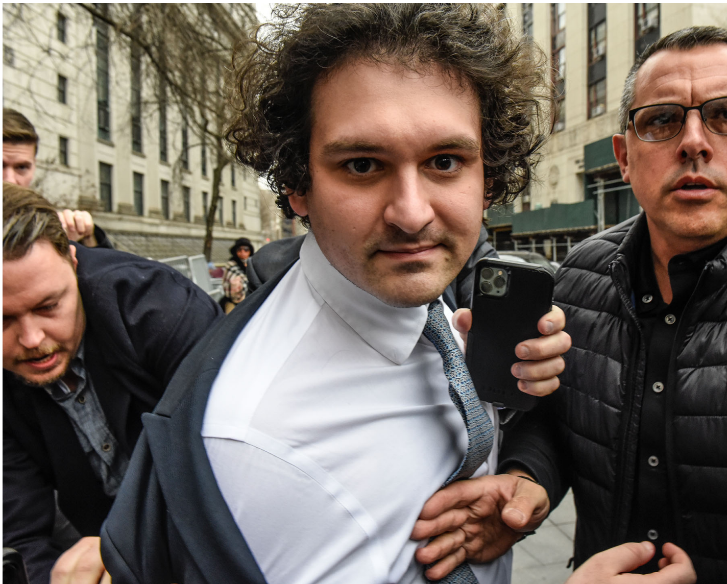
2023年2月16日，美国纽约，加密货币衍生品交易所FTX创办人Sam Bankman-Fried离开法庭。

加密货币交易所既做交易平台又自己发行加密货币的运营方式饱受质疑，能够保障用户资金安全的日本相关立法成为了监管参考对象