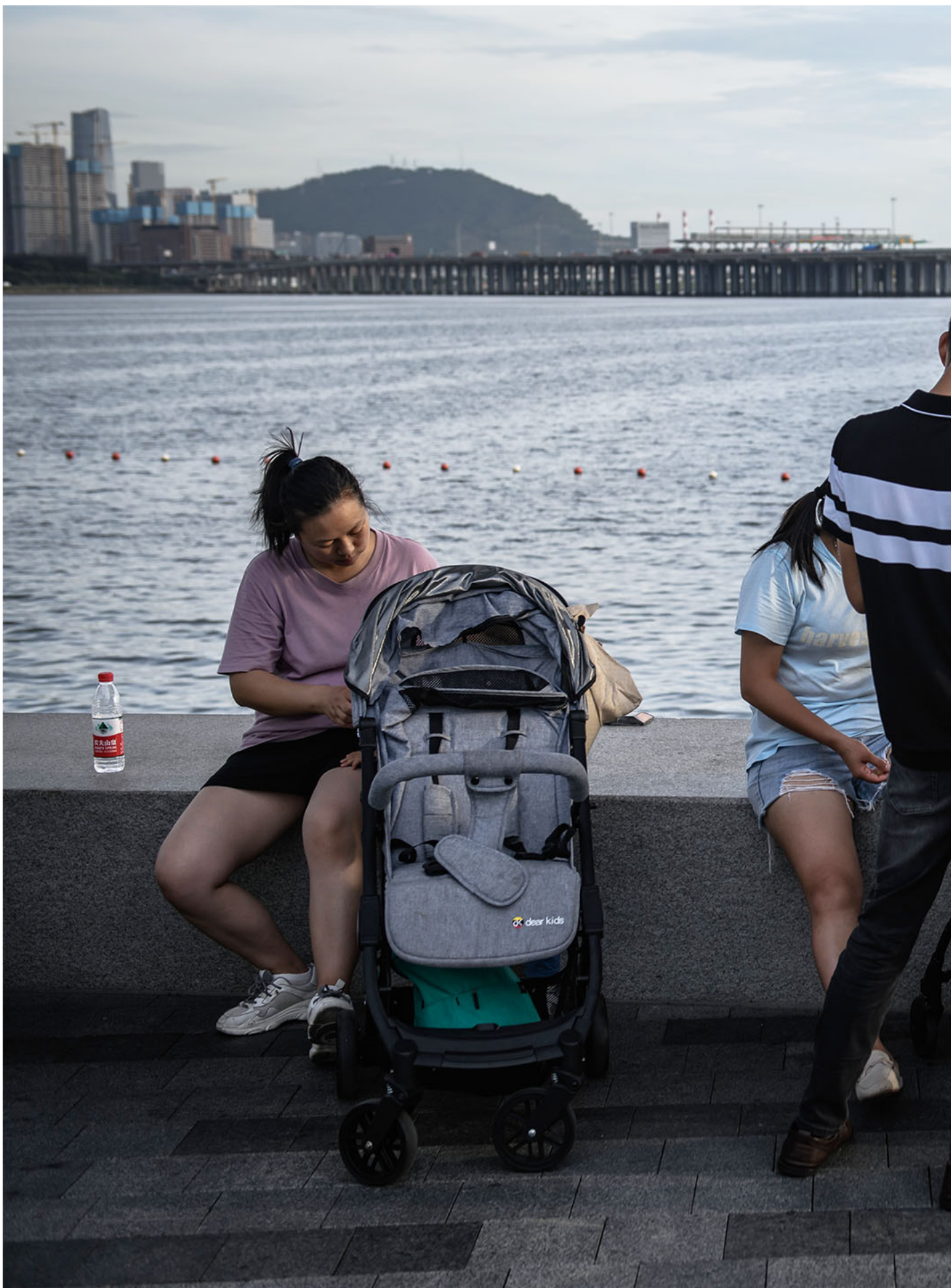
2022年6月6日，中国深圳，父母手推婴儿车到海旁散步。

东尼：我疫情之间看Sky Castle，一边被trigger一边看。里面的妈妈很多时候都没有名字，就“某某妈”。