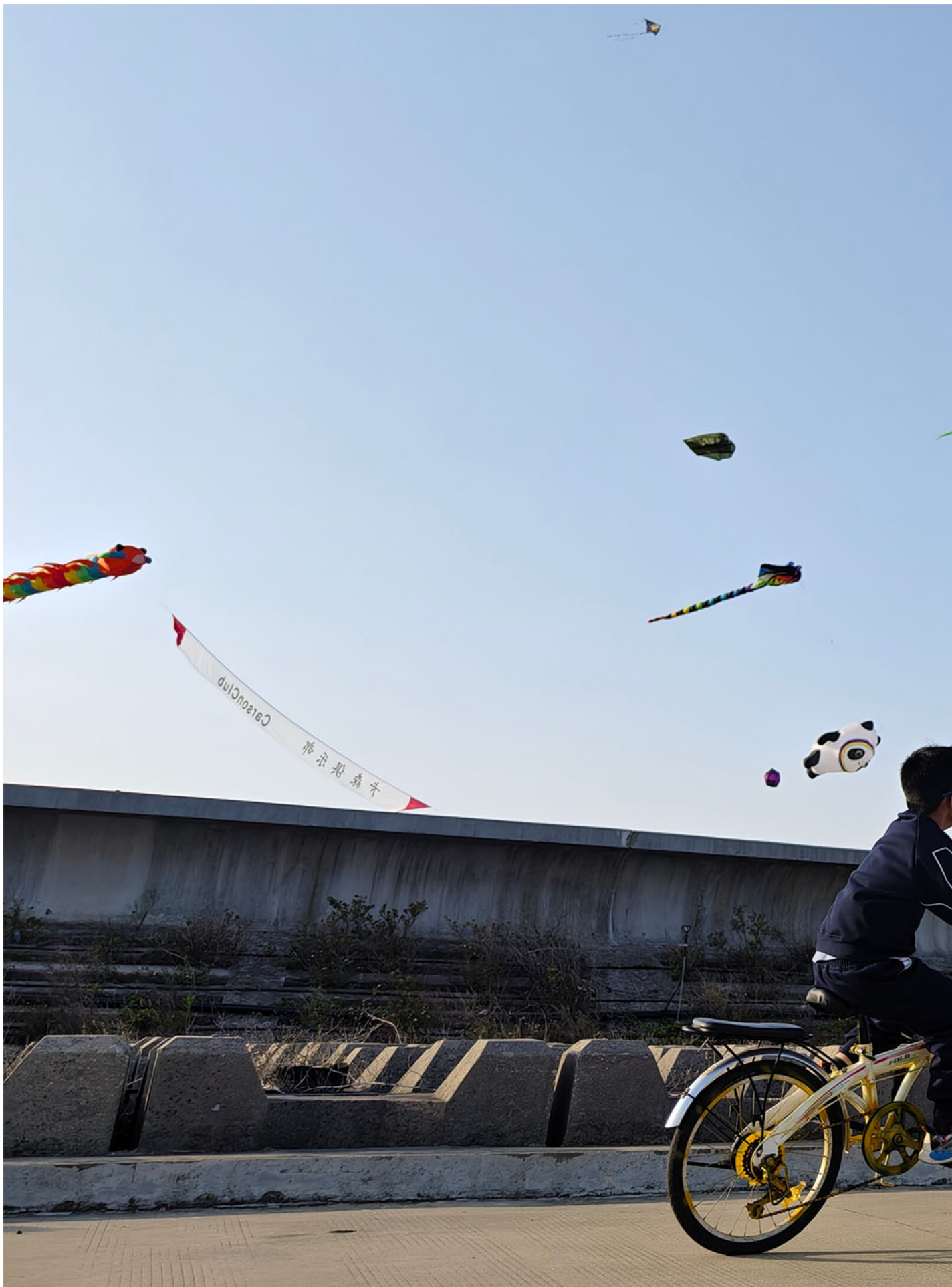
2023年3月5日，中国汕头，市民在公园放风筝。

我结婚的对象，我们就叫他大卫吧。他是个不能再广东的广东人：一半潮汕人，一半客家人。我在疫情期间结婚，其实是elope，就是在没有父母在场的情况下结了婚。我没有见过公公婆婆。