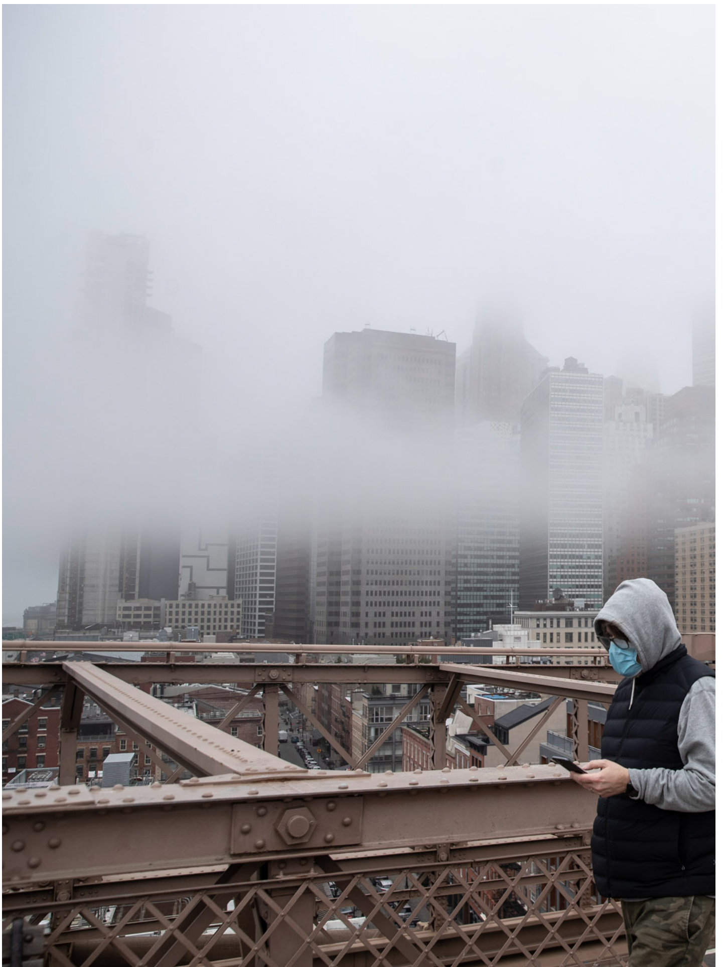
2020年3月20日，美国纽约，疫情大流行下，一名戴著口罩的男子在大桥上行走。

也只有在这样的时刻，我们才能真正地看见，“时代的一粒沙”究竟在个体身上留下的陨石坑，究竟是什么形状。