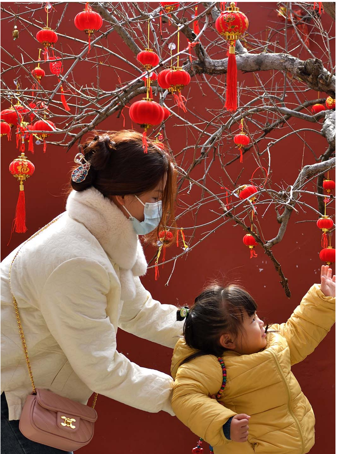
2023年1月26日，中国潮州，一名孩子触摸挂在开元寺许愿树上的小红灯笼。

小杨：作为一个女性来说，这是一个娜拉出走的过程。娜拉出走的过程里面一个必要的部分，就是和你的父母也好，和生你养你的环境也好，要有一个物理的距离。没有这个物理距离的话，会有很多东西把你吸回去，让你没有办法自我实现，没有办法成为你必要成为的那个人。