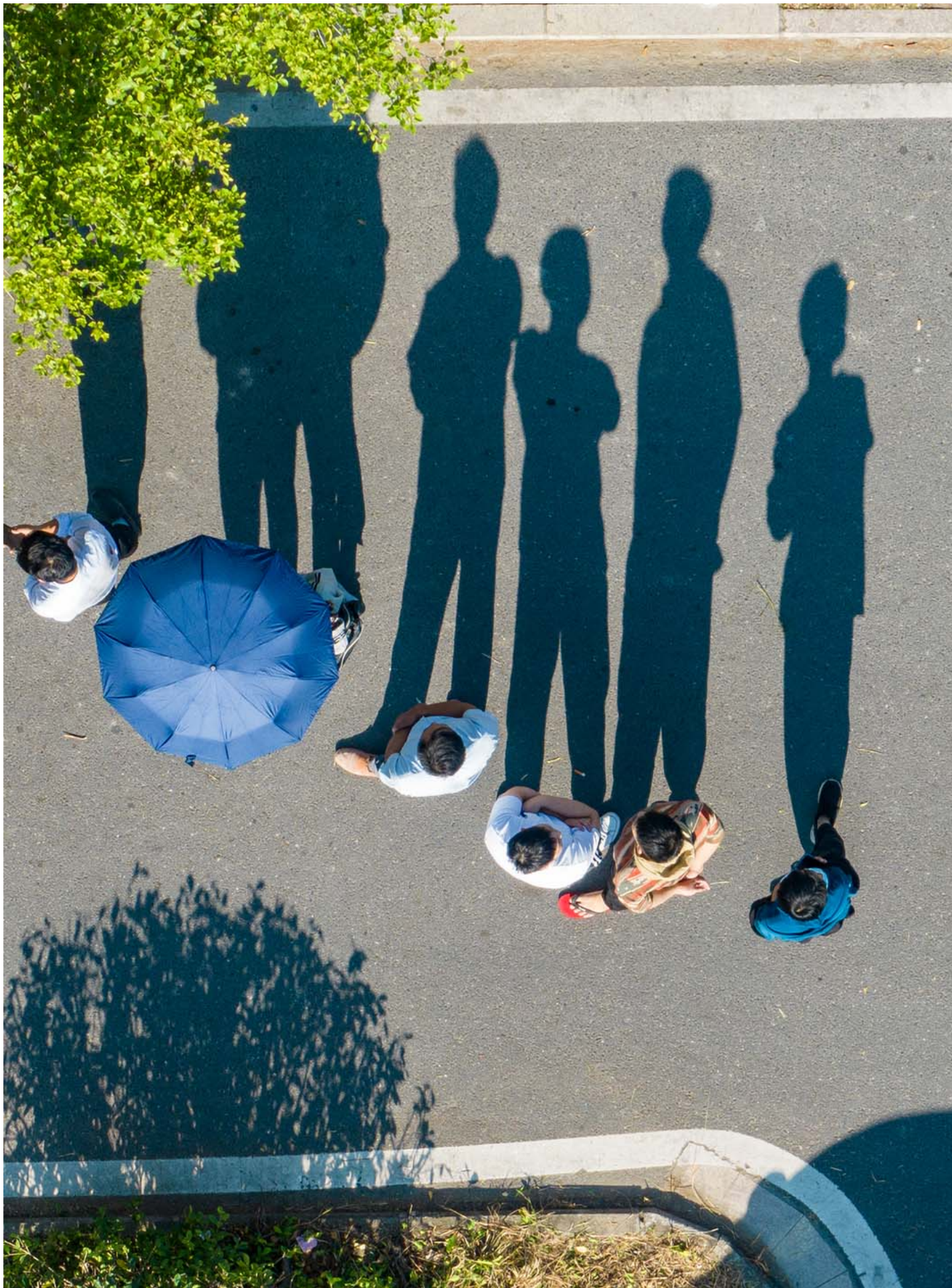
2022年10月2日，中国汕头，市民排队进行核酸检测。

东尼：我有个疑问想问你，疫情的时候我们的视频电话沟通也没有怎么断，但是我明显地感觉到大家的心理距离增加了，误解增加了。之后我会有一个特别小的疑问在心里开始慢慢发酵：How much did you actually tell me? If you think everything is fine, is it really fine? 当你说一切都没事儿，是为了告诉我你很好，还是你真的很好？我觉得我们家特别不会表达vulnerability，如果在正常的时代，大家就慢慢通过去用爱来这个来弥补这语言的缺失。但是你现在没有了这些日常相处之后，你说的东西究竟有多少是真的？