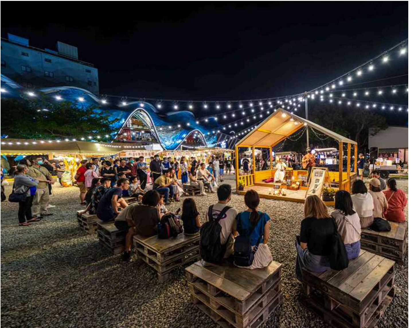
台东铁花村。

至2023年中，铁花村演唱会中高达七成来自原创、原住民歌手，铁花村也成为东部音乐人唱歌最重要的舞台。