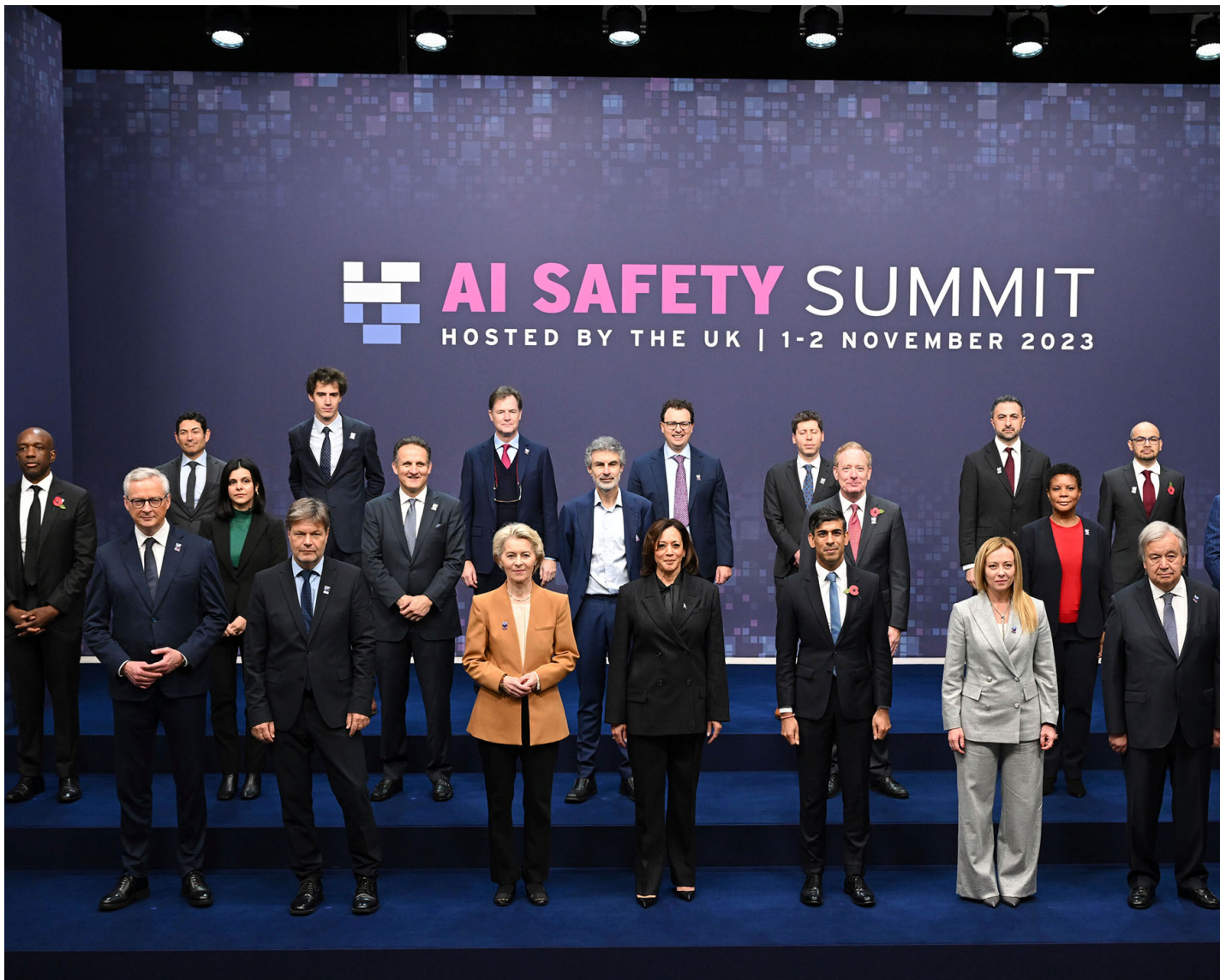
2023年11月2日，由英国政府召开的“人工智能安全高峰期”。