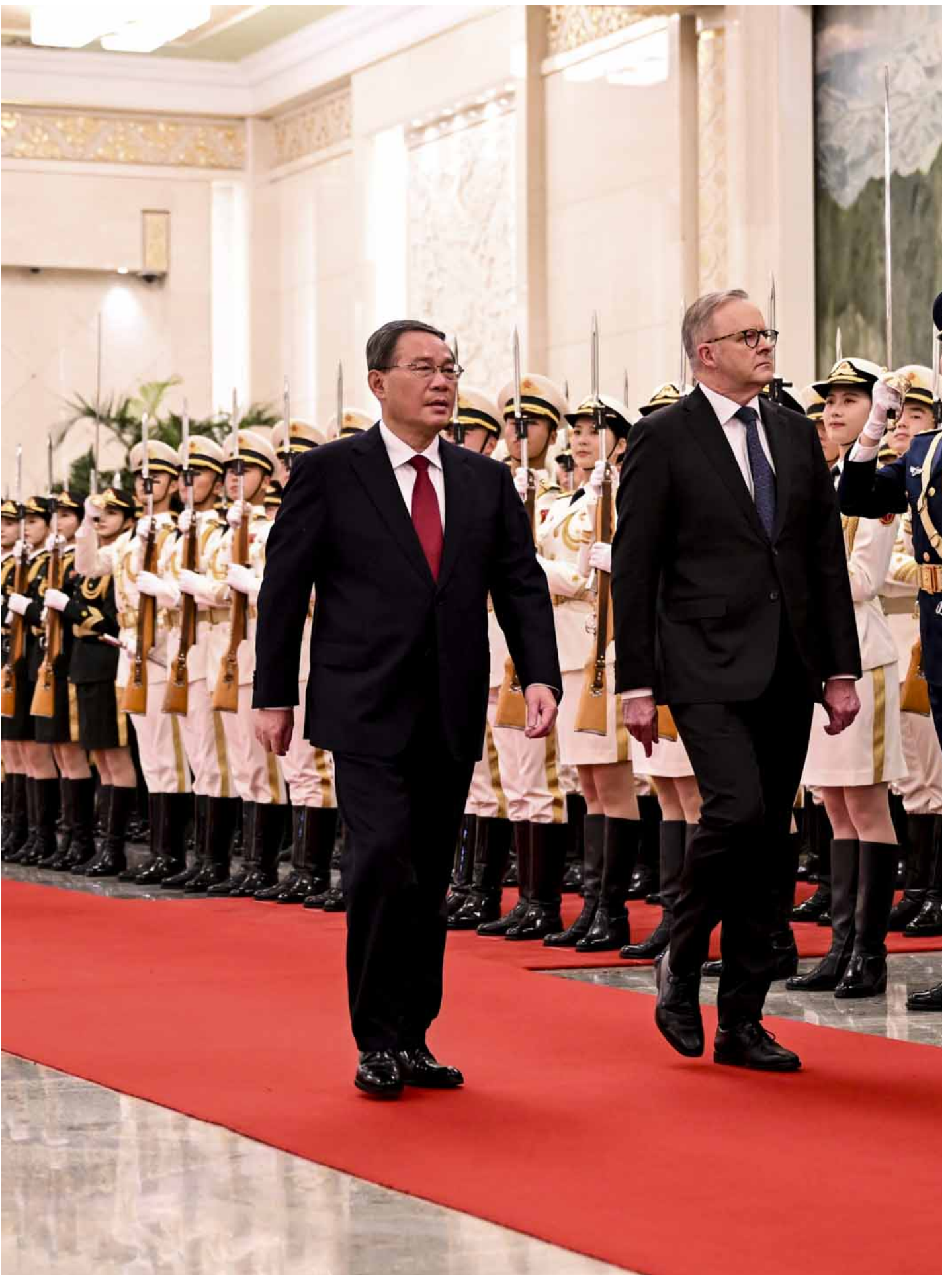
2023年11月7日，北京，中国总理李强（左）为澳大利亚总理安东尼·艾班尼斯（右），举行欢迎仪式。

此次阿尔巴尼斯的访问行程首站为上海，他参加了在上海举办的中国国际进口博览会，在现场和澳大利亚出口商交流。其后他飞往北京，先后和中国全国人大常委会委员长赵乐际、国家主席习近平和国务院总理李强会晤。