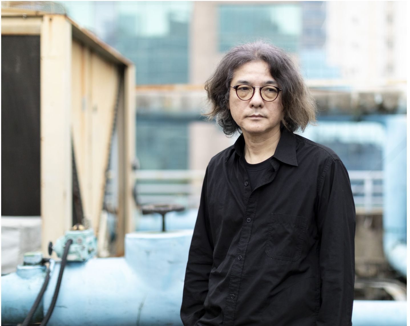
日本导演岩井俊二。