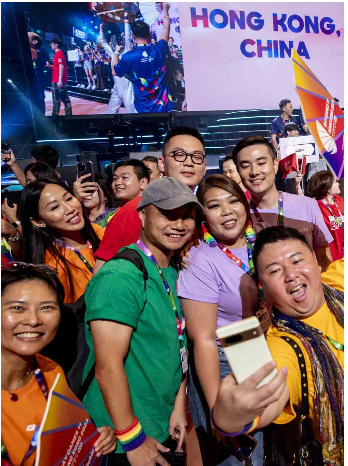
2023年11月4日，同樂運動會舉行開幕禮，香港代表隊在台前自拍。