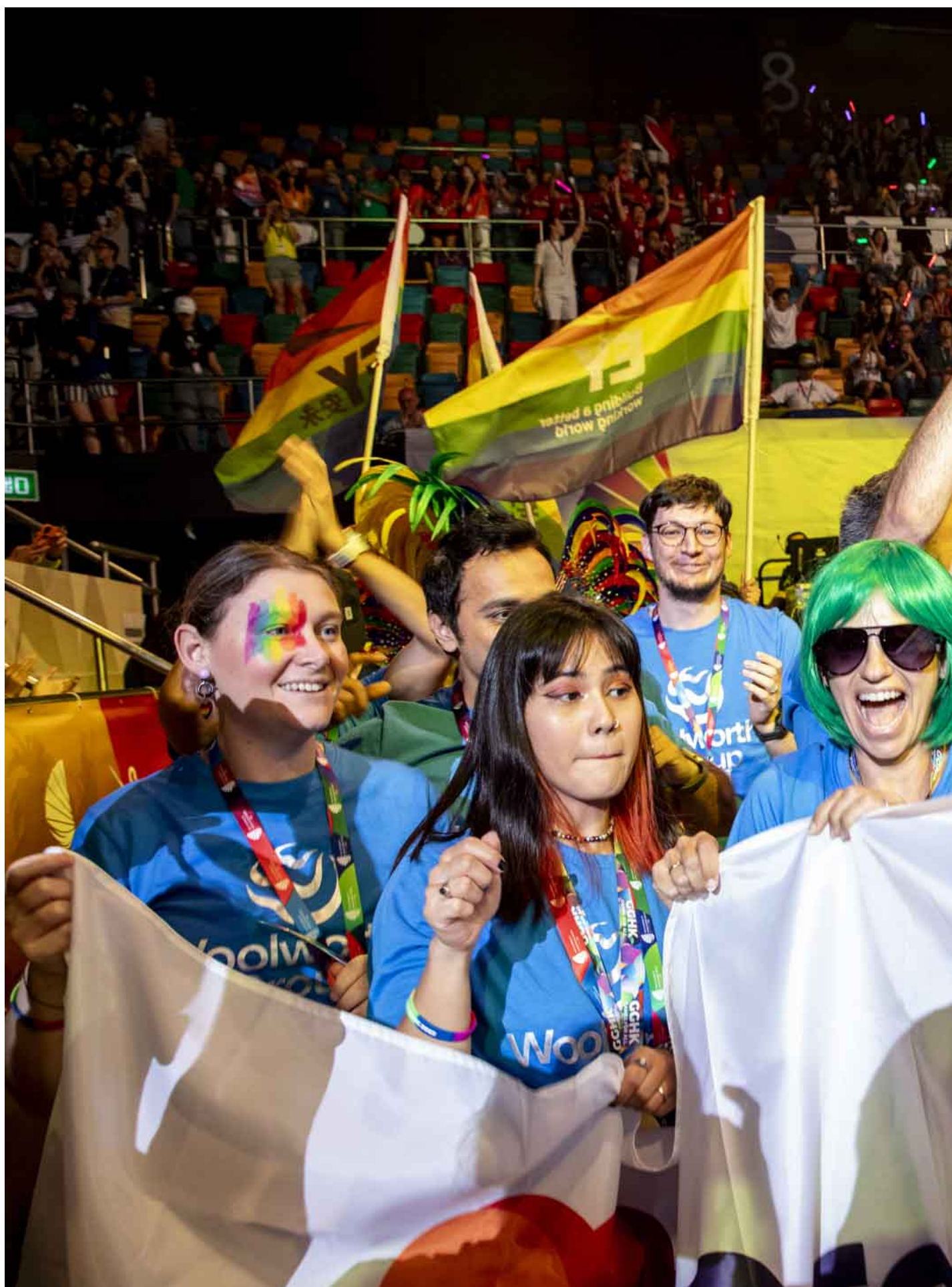
2023年11月4日，同樂運動會舉行開幕禮，參加隊伍手持彩虹旗進場。