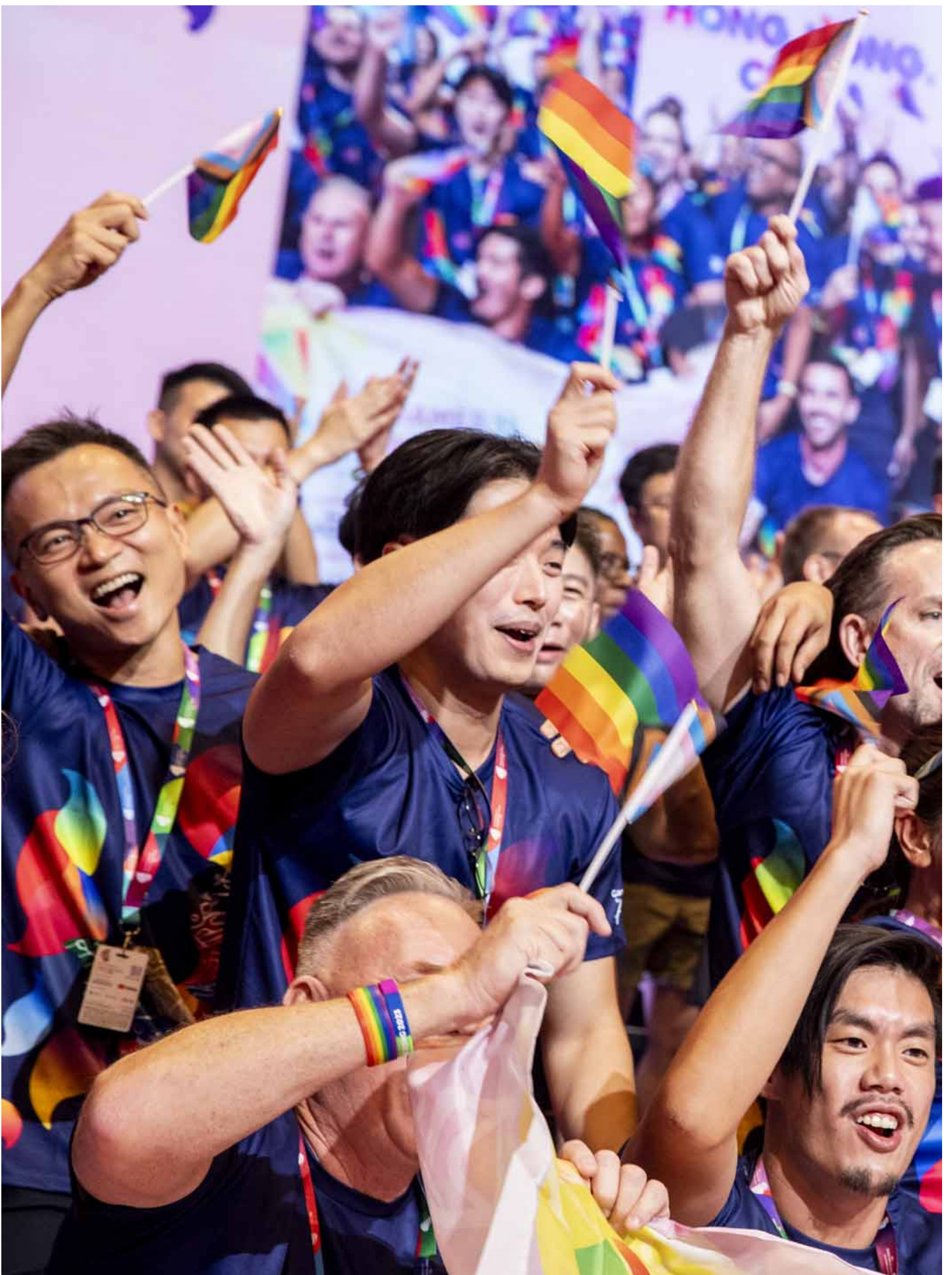
2023年11月4日，同樂運動會舉行開幕禮，香港代表隊進場。