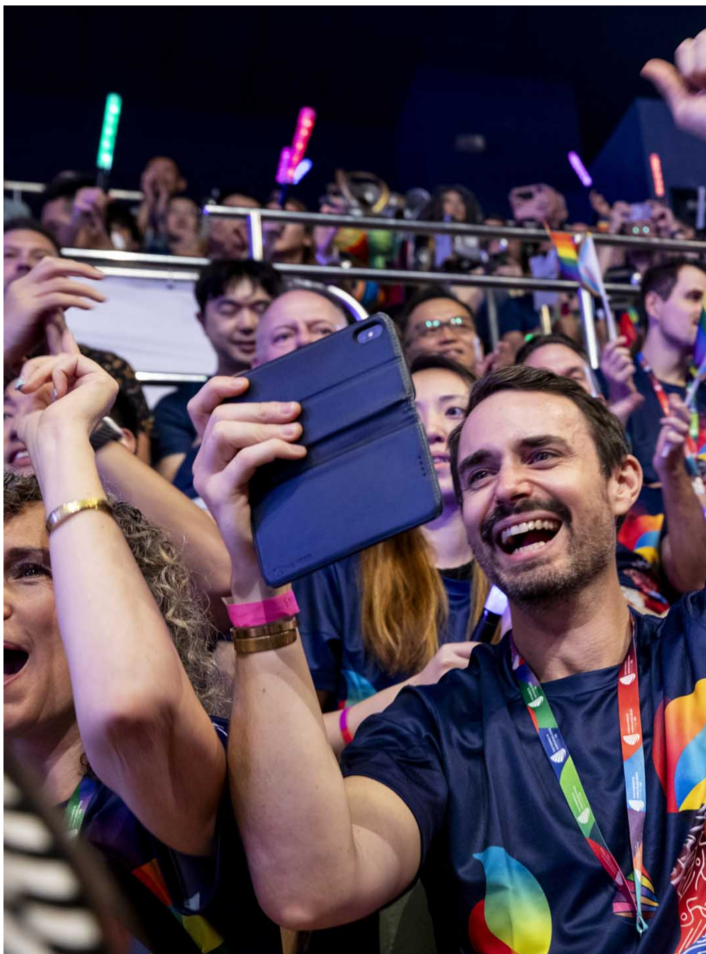
2023年11月4日，同樂運動會舉行開幕禮。