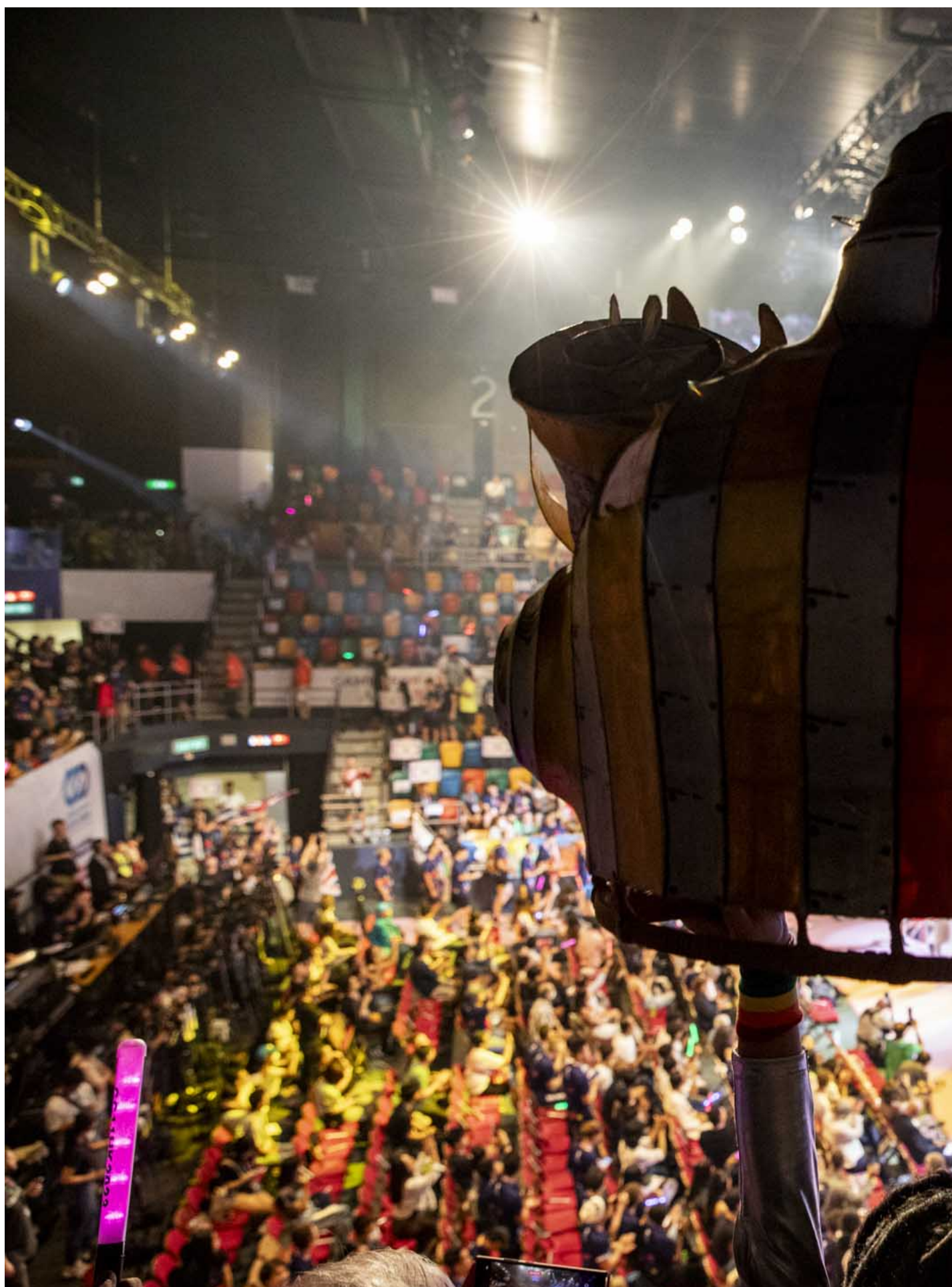
2023年11月4日，同樂運動會舉行開幕禮，參加者帶上舞獅頭助慶。