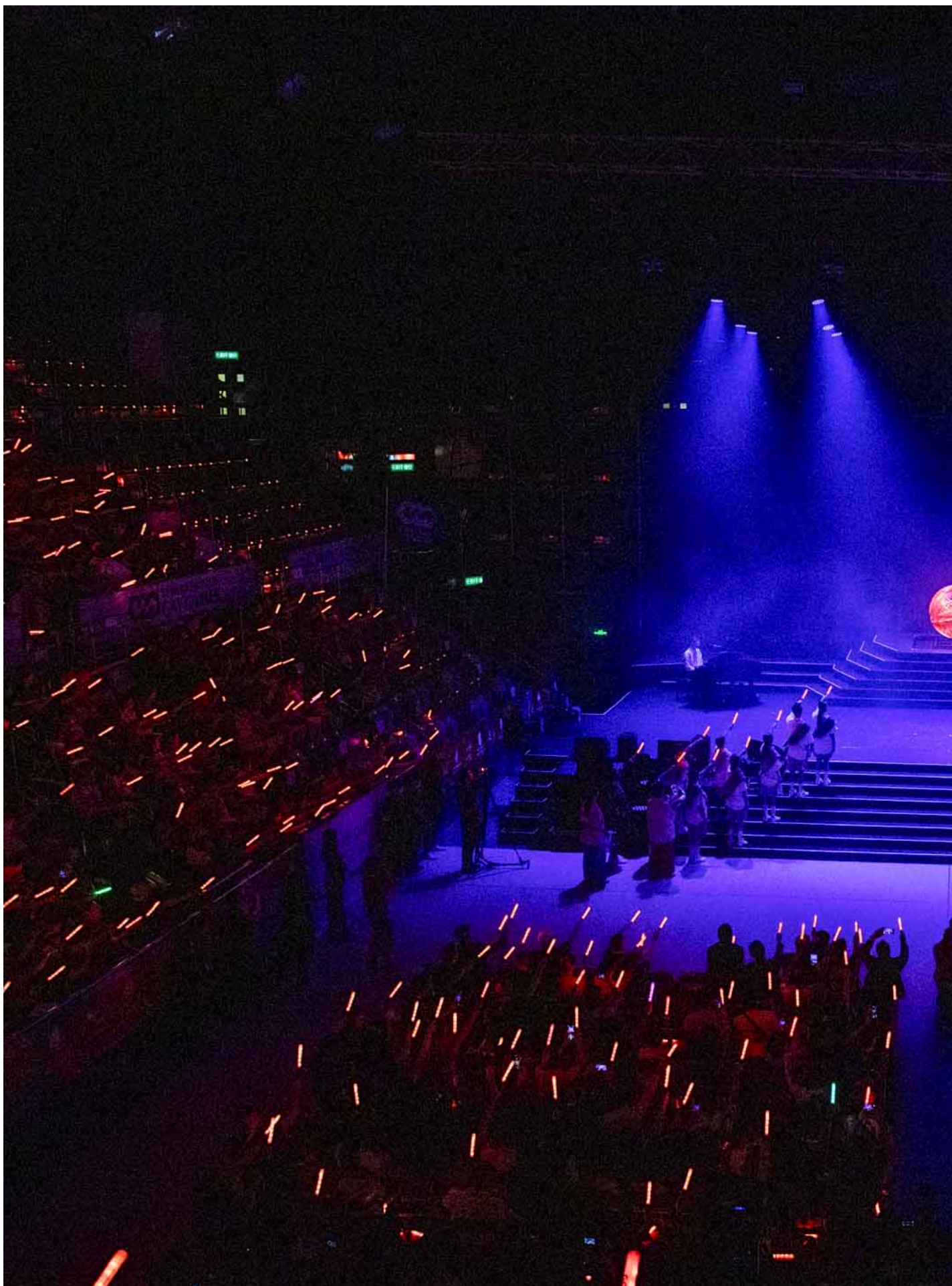
2023年11月4日，同樂運動會舉行開幕禮。