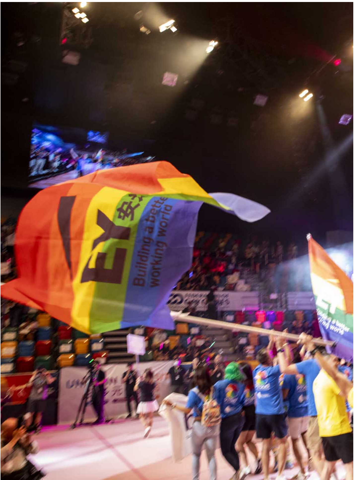
2023年11月4日，同樂運動會舉行開幕禮，參加隊伍手持彩虹旗進場。