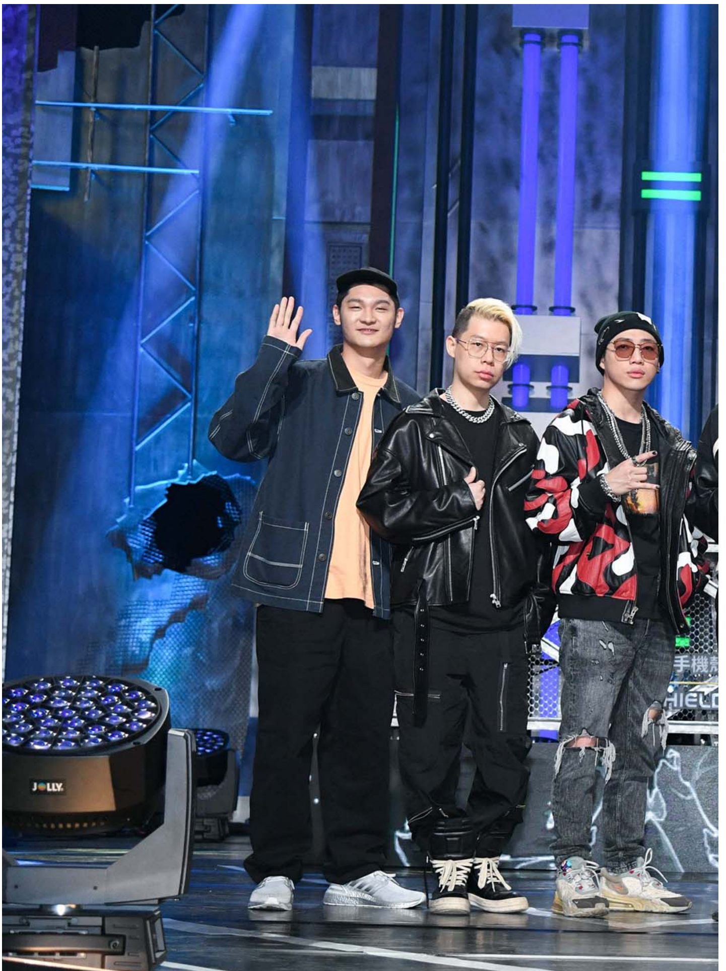
台灣嘻哈選秀節目《大嘻哈時代》導師。