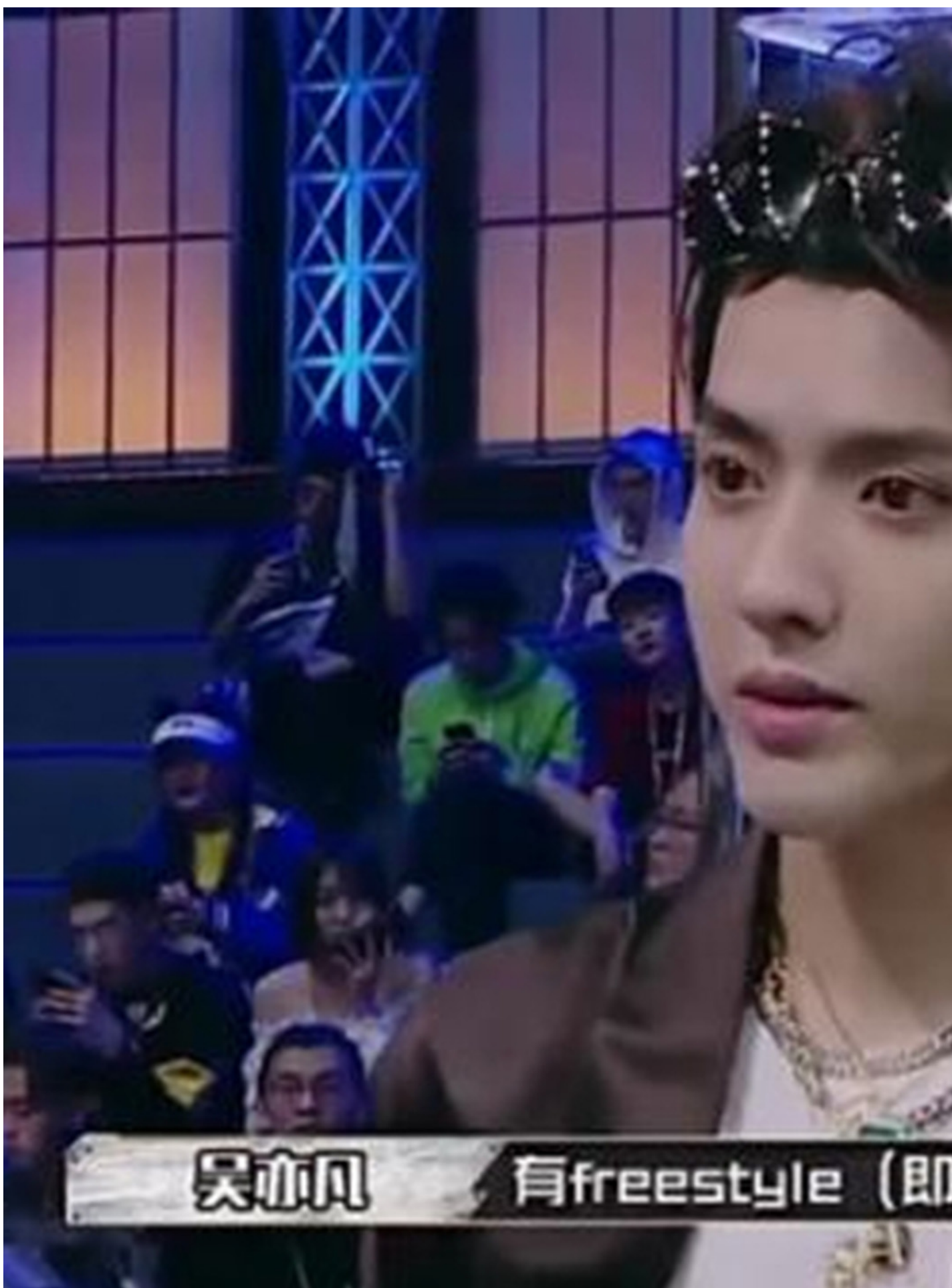
中國嘻哈選秀節目《中國有嘻哈》導師吳亦凡。

但另一方面，樂夏對具體的搖滾樂團影響應該是頗大的。上過節目和沒上過節目的樂隊知名度、粉絲量、演出報酬相差巨大，乃至可能出現斷層。這種現象在另外兩個節目播出後也盛京出現過，甚至曾出現演出門票溢價到不太合理的狀態。但哪怕沒有登上節目的樂隊，收入和知名度也會受到這一輪整個行業被看見的輻射。與此同時可以想像的是在短時間內會刺激大量的愛好者、年輕人對這門藝術有所嚮往，可能未來會催生大量的年輕樂隊，為獨立音樂產業輸送新血，但同時也可以想像的是。這些新樂隊中有不少會高度同質化，可能很容易找到節目中受歡迎高人氣樂隊的影子。