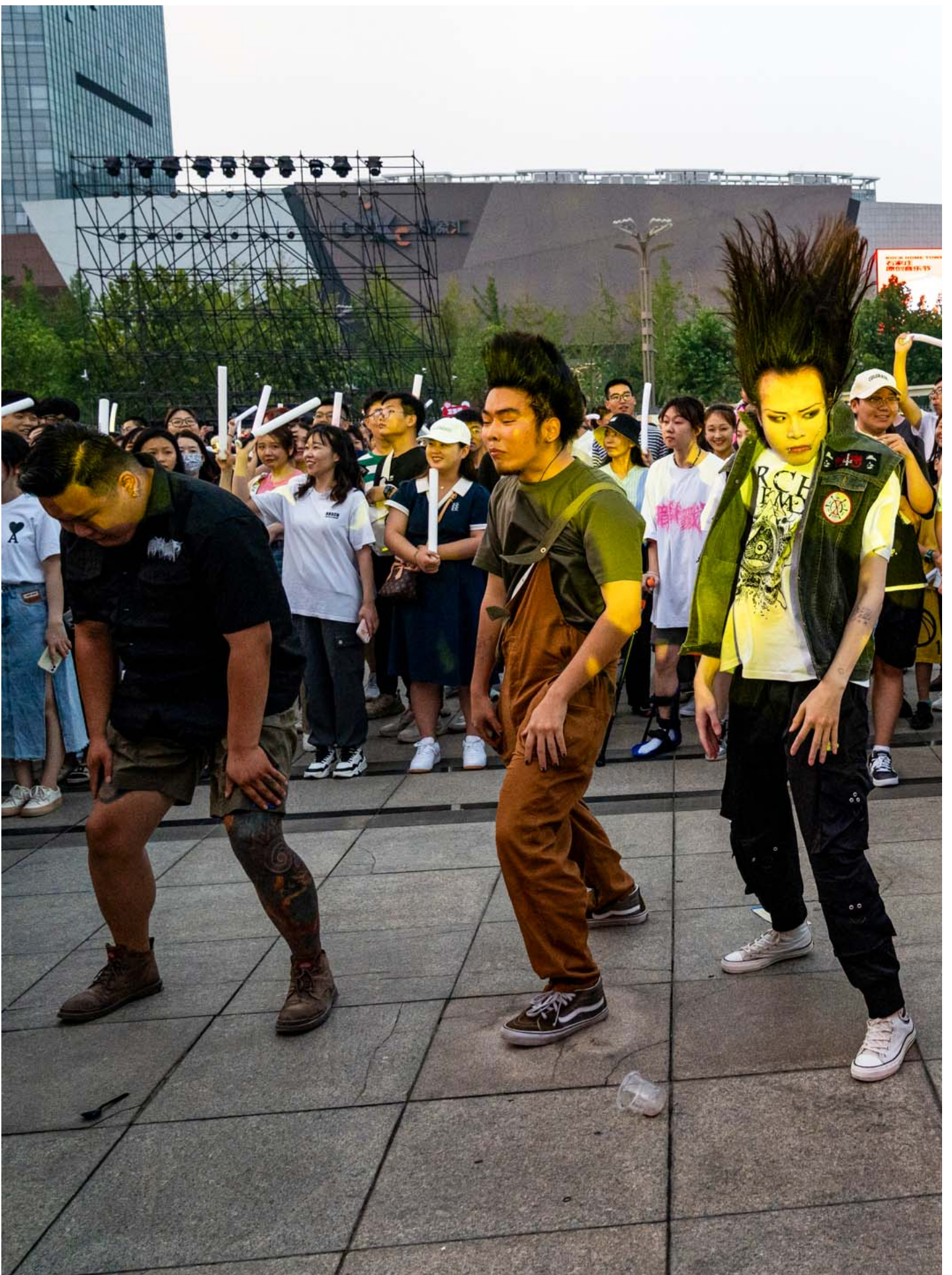
中國石家莊2023年的搖滾音樂節。

但是我想指出的是，哪怕我們默認搖滾樂、搖滾樂手必然共存於這種自由的、自然的底色，但也需要瞭解到在這個共識之上可能存在非常廣闊的光譜，以及每一個個體都有自己側重的議題和對自由這件事情如何實踐的理解。比如說商業是不是建制的一部分？走上電視螢幕的舞台和其他的舞台，對於不同理念的樂隊來說，區別有多大？野孩子參加到一半退賽，五條人一邊肆意改歌一邊接受復活，超級市場拒絕復活，蛙池甚至基於不同意贊助商的一些新聞而拒絕上節目，也有的樂隊樂於打破舒適圈增加新體驗，也很喜歡自己在樂夏的經歷，如何評判哪一個「最搖滾」，哪一個「真搖滾」？具體的上綜藝節目又是是否等於商業化？所謂變節和投誠那條線在哪裏，上競技類網綜和上主旋律晚會又有沒有區別？我覺得可以思考商業市場對搖滾樂的影響，但反過來這種對於搖滾樂文化、搖滾樂隊的潔癖期待，是不會有盡頭的。