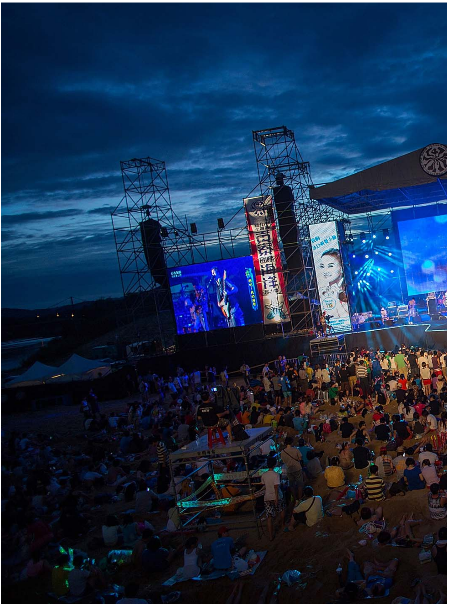
台灣樂團蘇打綠2013年的搖滾音樂節上在沙灘演出。

台灣對於搖滾樂的討論進程，相對不同。在九〇年代，仍有「地下樂團」的說法，千禧年後，「獨立樂團」之「正名」取而代之，不再說人家地下。樂團非常快速的走入流行音樂與文藝青年之間，塑造出明星，以及樂團與粉絲之間各種特殊情感，又比方說，音樂節文化的開展、live house 蓬勃、樂團分眾市場的定位，整個時序、討論過程跟中國搖滾樂是有蠻大不同的。這是基礎上，「樂夏」的討論型態，在台灣不容易成立的原因：一檔節目成立的前世今生，背景脈絡極為重要。