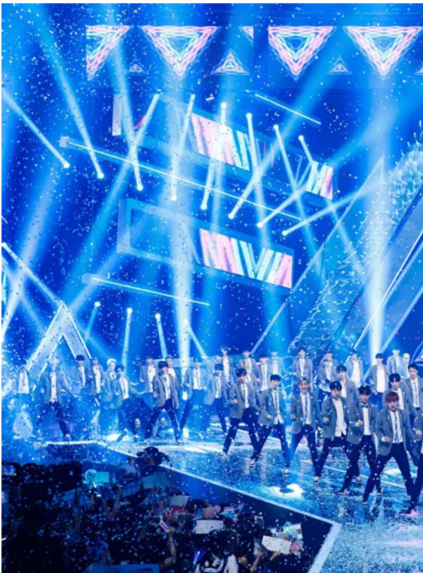
韓國大型選秀節目《PRODUCE 101》。