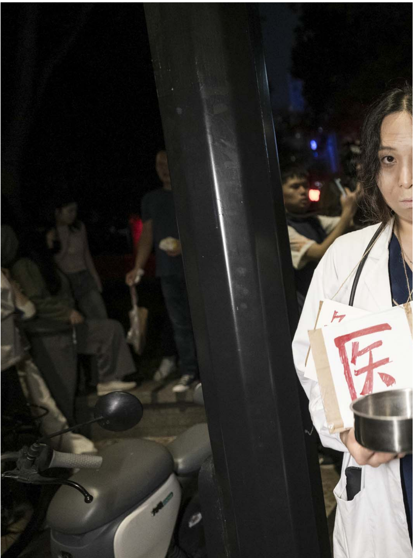
2023年10月30日，中国上海，有市民扮成“医学牲”庆祝万圣节。

更多人则 cosplay 各种各样的人物、影视和生活场景。惟中国政治人物较敏感，未见有相关装扮出现。但网上也流传好几位“鲁迅”打扮的人物，身旁放着写有“学医救不了中国人”的纸板。