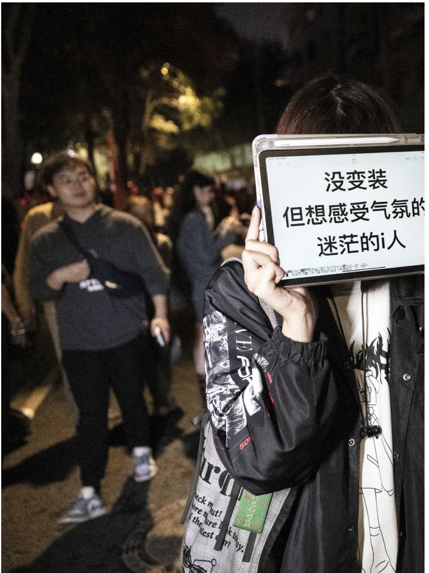
2023年10月30日，中国上海，有不打扮的市民来庆祝万圣节。

万圣节活动引起了中国大陆互联网上的大量讨论。其中一部分人士认为，这是年轻人“崇洋媚外”和“过洋节”的体现。