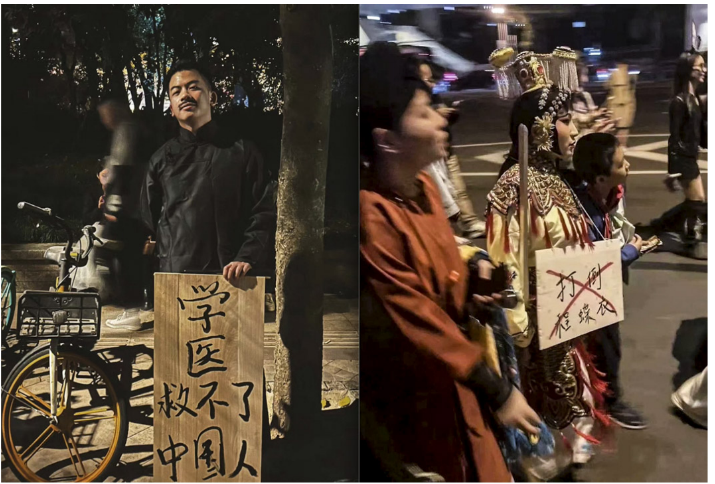
上海万圣节于网上走红的造型包括举著“学医救不了中国人”的鲁迅和《霸王别姬》中被批斗的“程蝶衣”。

亦有一人装扮成张国荣的著名电影《霸王别姬》中的“程蝶衣”戏剧造型，身上挂着象征文革批斗的木牌，牌上名字打了一个叉号。 (延伸阅读：《“谜一般的动荡”：关于文革的最新研究，如何挑战了主流叙事的理解？》)