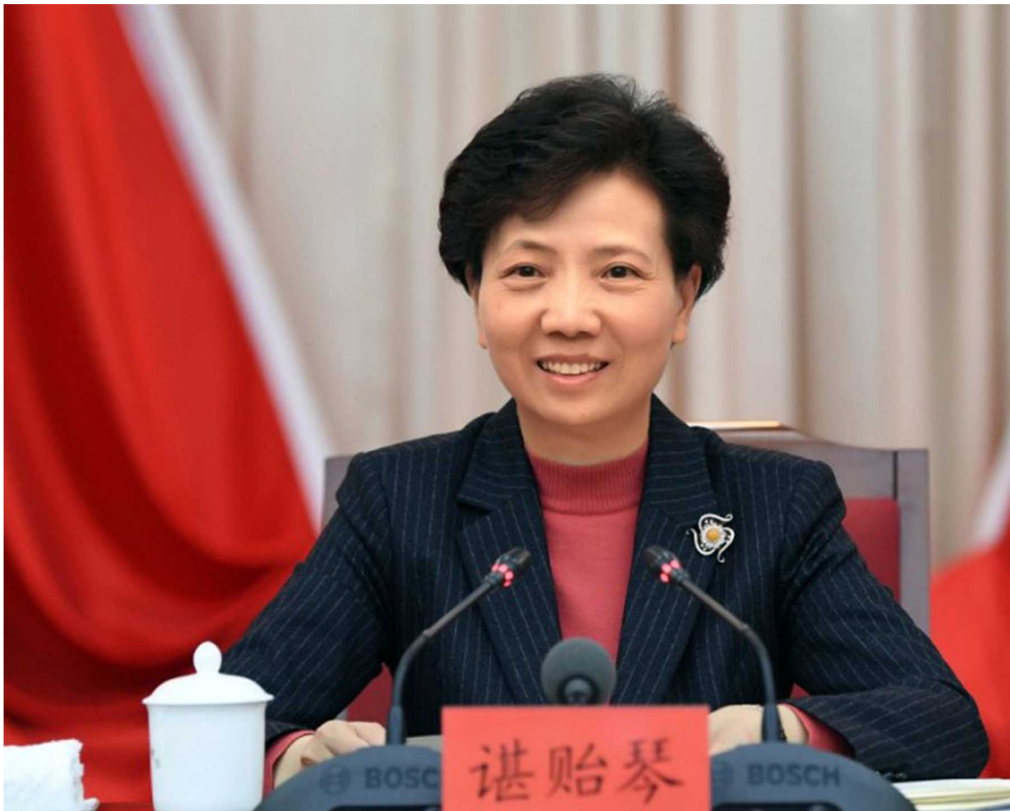
谌贻琴出任中华全国妇女联合会。

尽管妇联主席罕有地由国务委员兼任，但如今中国最高级女性官员的实权远不如2000年代初期。