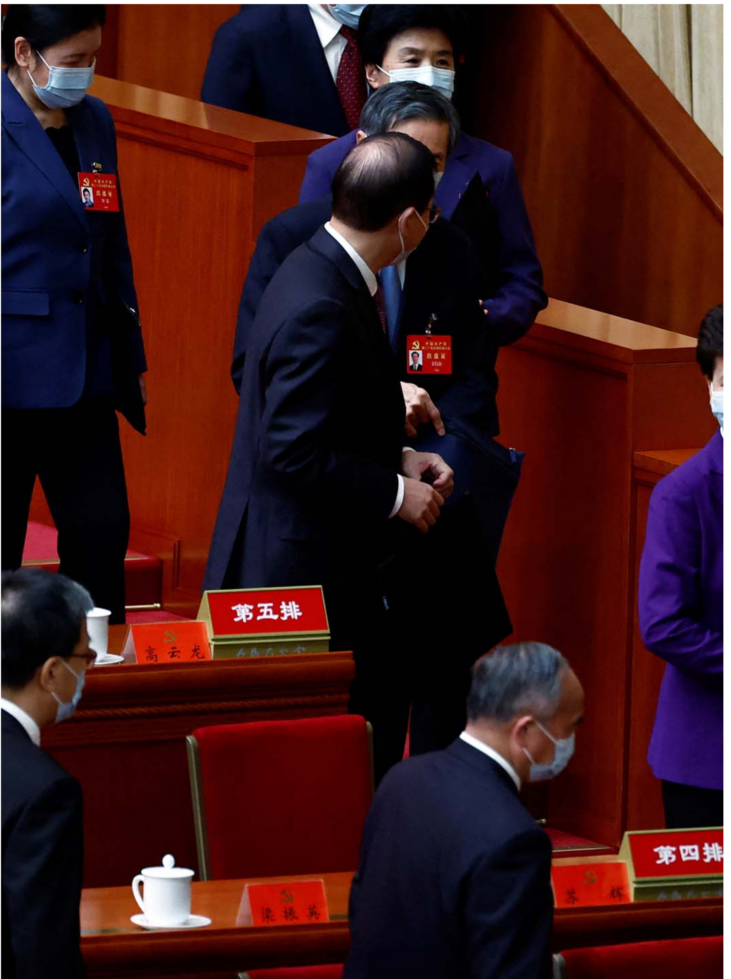
2022年10月22日，北京人民大会堂，中国共产党第二十次全国代表大会闭幕式上官员离场。

10月23日，在中国妇女十三大上，全国妇联副书记、党组书记、书记处第一书记黄晓薇作工作报告称，称习近平“高度重视妇女儿童事业发展，亲自谋划、亲自部署、亲自推动”，其中也包括亲自审定《 全国妇联改革方案 》。他所给出的全国妇联组织政治定位是“党和政府联系妇女群众的桥梁和纽带”、“党开展妇女工作的最可靠最有力助手”。