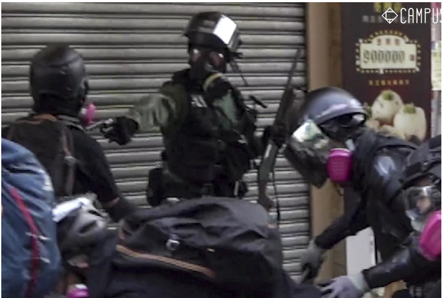
2019年10月1日，警员在荃湾海坝街近川龙街发射实弹，一名示威者中实弹受伤。

就十一暴动案，暂委法官严舜仪判刑指，案发为国庆日，位于商住大厦林立的地区，示威者扔汽油弹、砖头及纵火，对警员、路人、记者及商户等，造成直接人身伤害和财物损失实际风险，增加公共开支负担，损失难以估计。