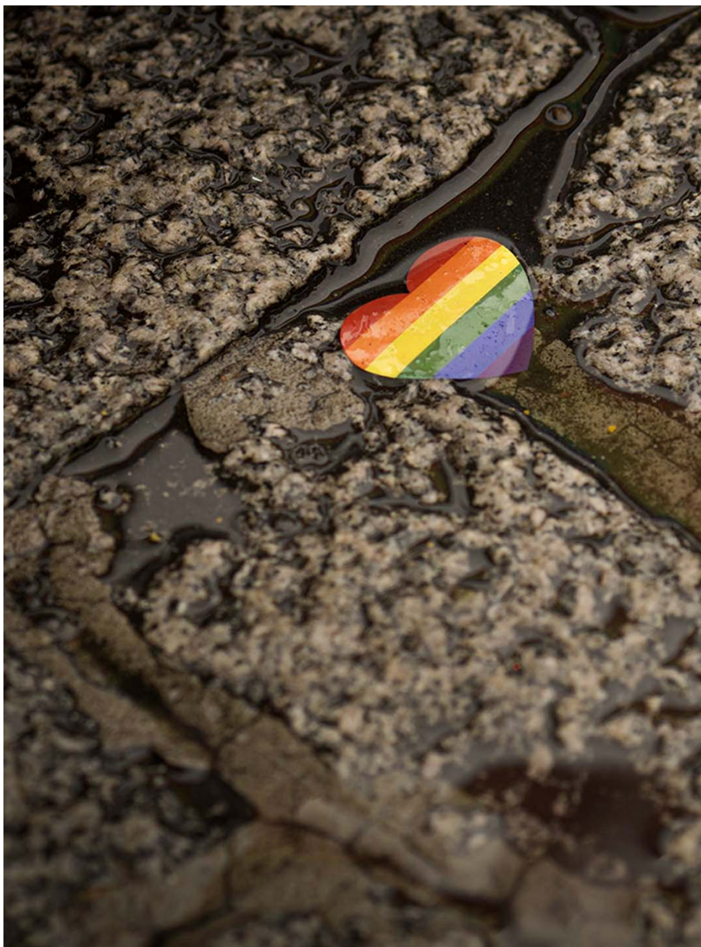
2023年10月28日，台湾同志游行。