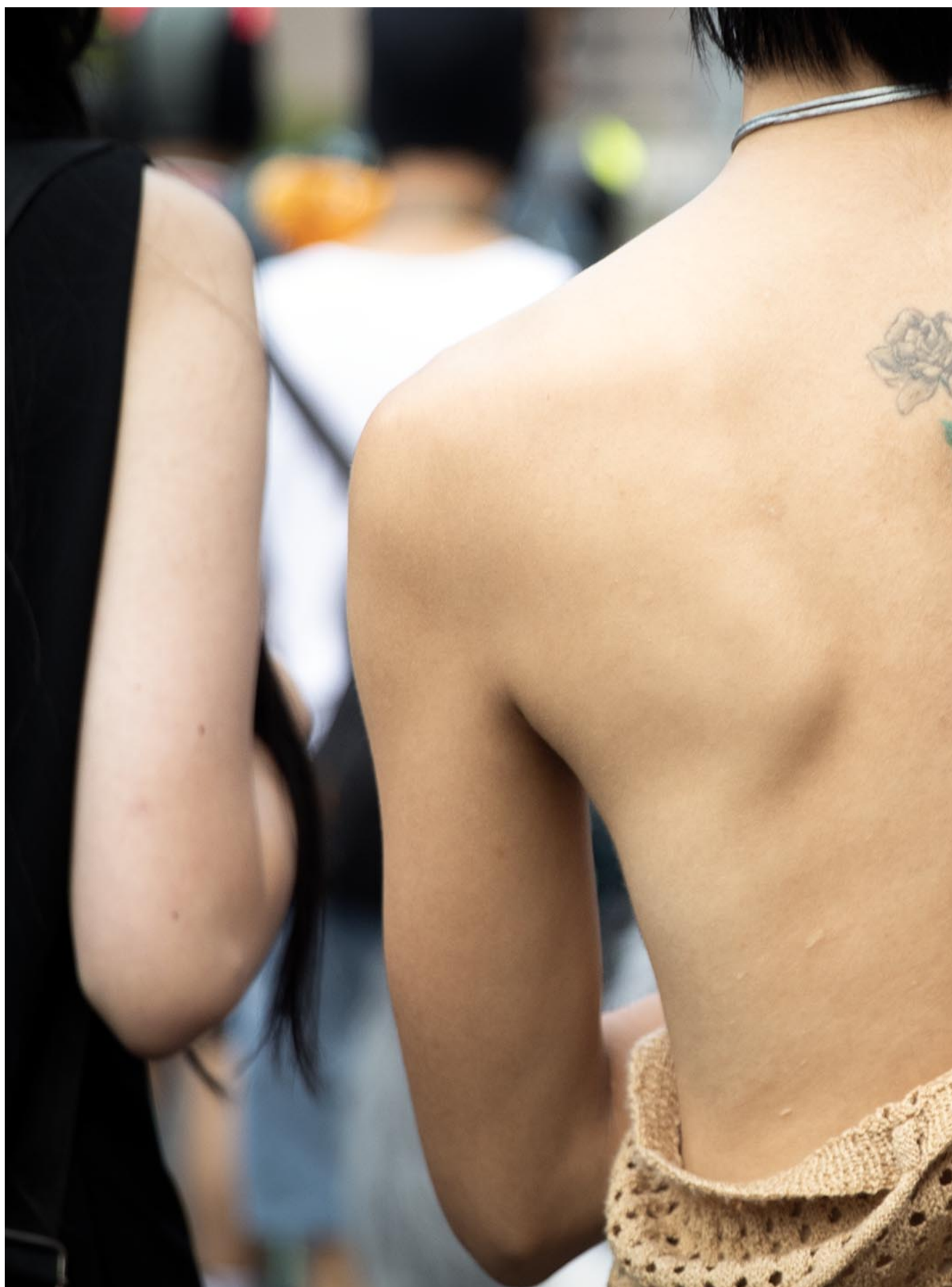
2023年10月28日，台湾同志游行。

随着同志权益的进步，更多酷儿议题浮上台面，像是公共空间缺乏多元性别的设施、多元性别者的身份证等议题。然而，跨性别议题相较属于酷儿议题中的少数，过去必须跟着主流的同志议题设定走；就连许多顺性别同志也不理解跨性别者的处境。 (延伸阅读：《银幕内外寻找拉子身影：台湾90年代前后影史中的女同性恋再现》)