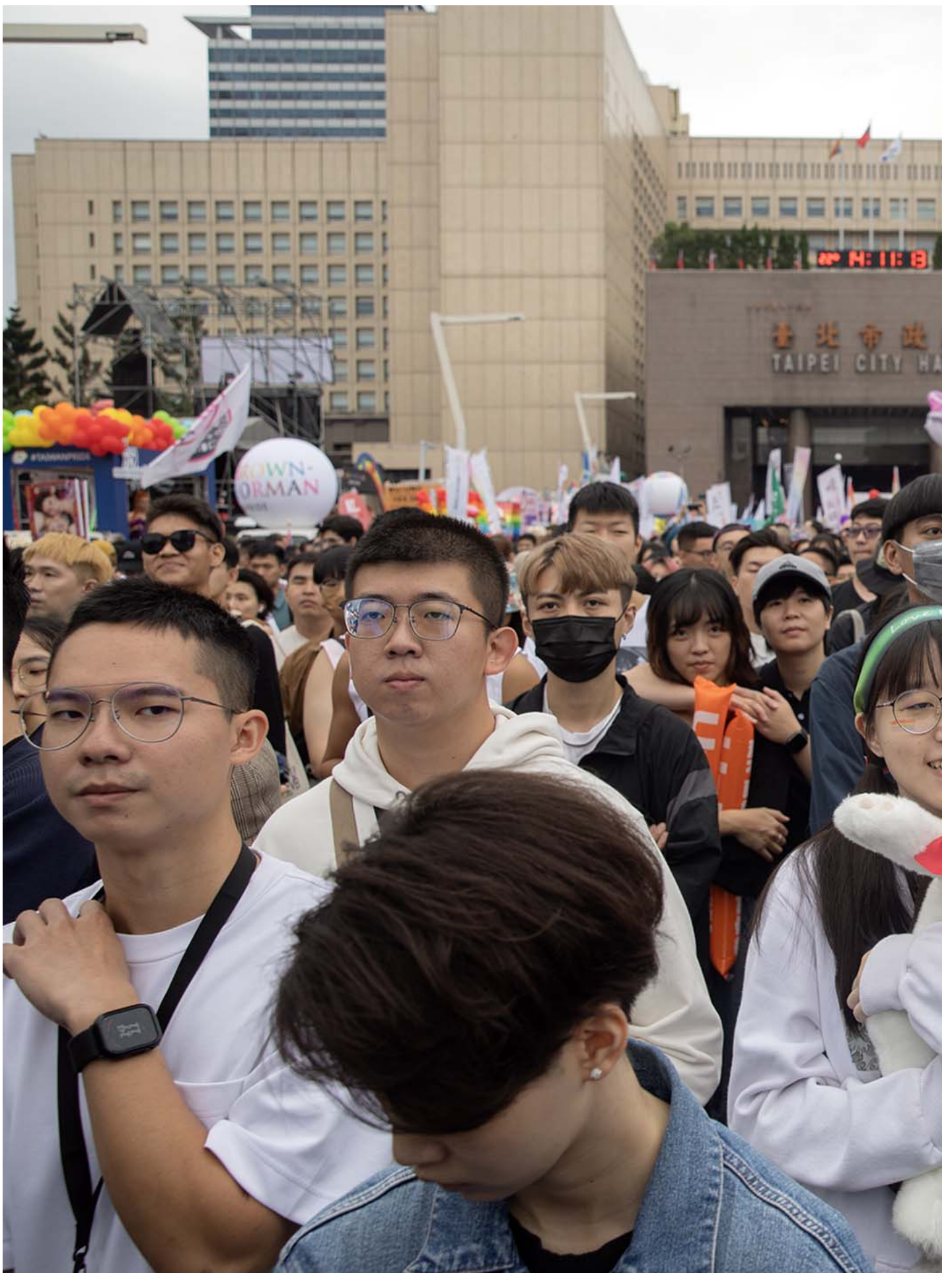
2023年10月28日，台湾同志游行。