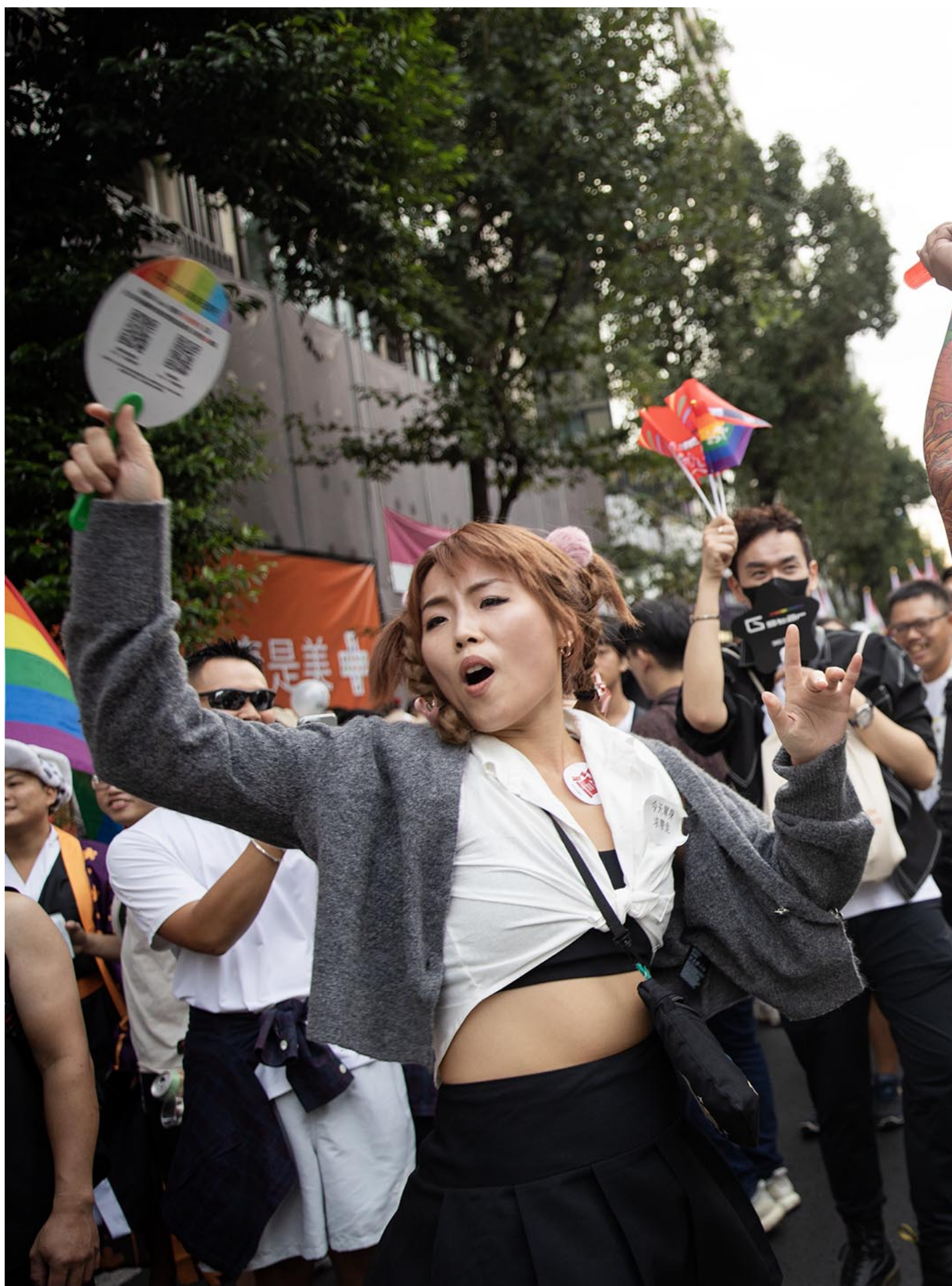
2023年10月28日，台湾同志游行。

来自马来西亚的明越与思伶来台已有十多年，他们长年参与性别运动，明越在现场一看到思伶，便拿出马来西亚国旗一同游行。他们说，同志与跨性别者在马来西亚的处境很危险，尤其是穆斯林，因为马来西亚刑法规定同性性行为违法，伊斯兰刑事法也明文规范禁止跨性别的装扮。作为同志的他们在台湾感到很自由与自在，但也希望更多人关注到马来西亚人的性别平权议题。