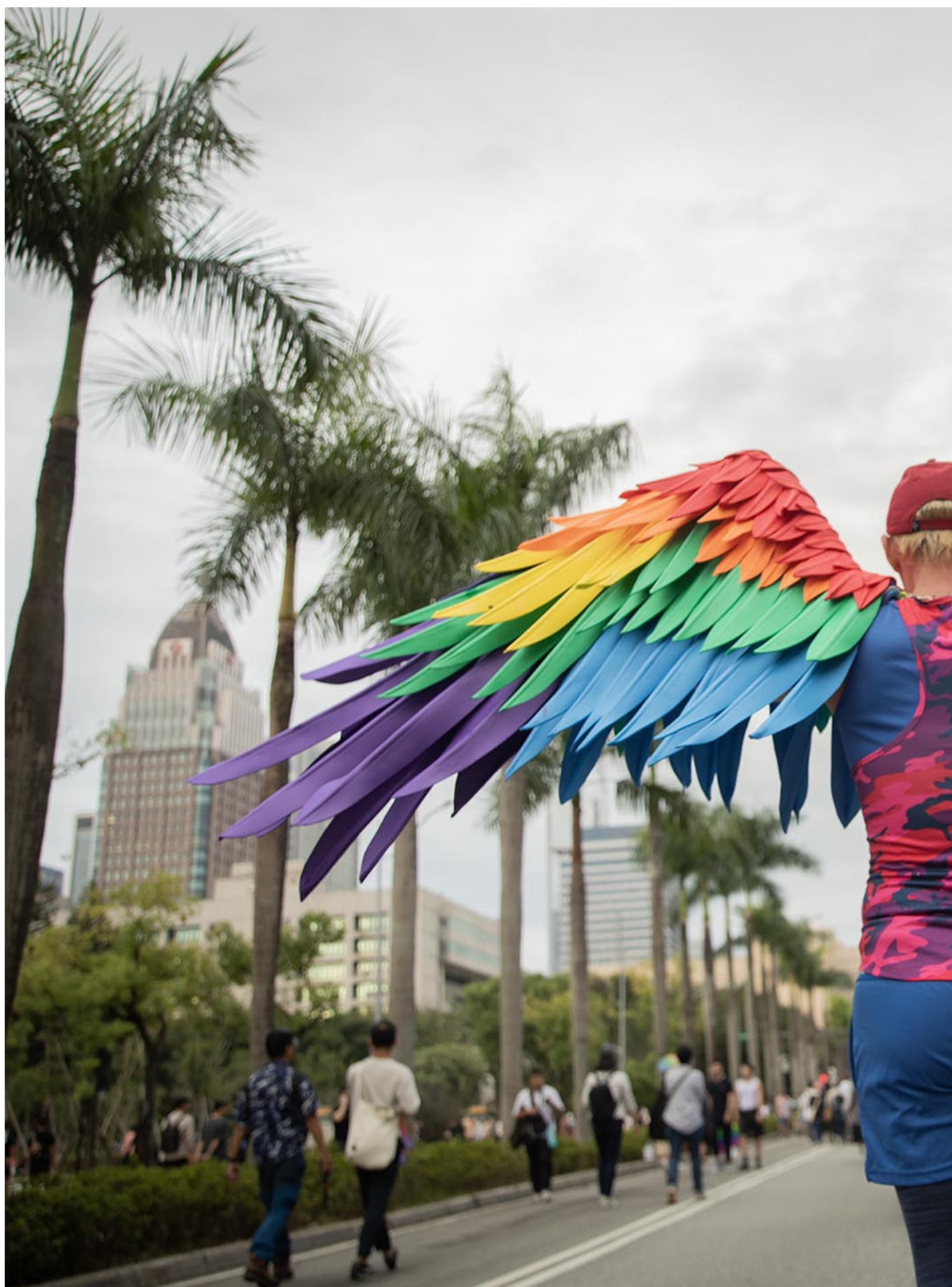
2023年10月28日，台湾同志游行。

由于跨性别者长期缺乏支持，Solange 曾几度想了结自己，她在右手刺上“相信自己”，她告诉自己：“我要尽一切可能成为自己的样子。”因此，她不断参与政治活动、组织倡议，因为她希望每个人都可以听到那个年少时需要支持的声音。