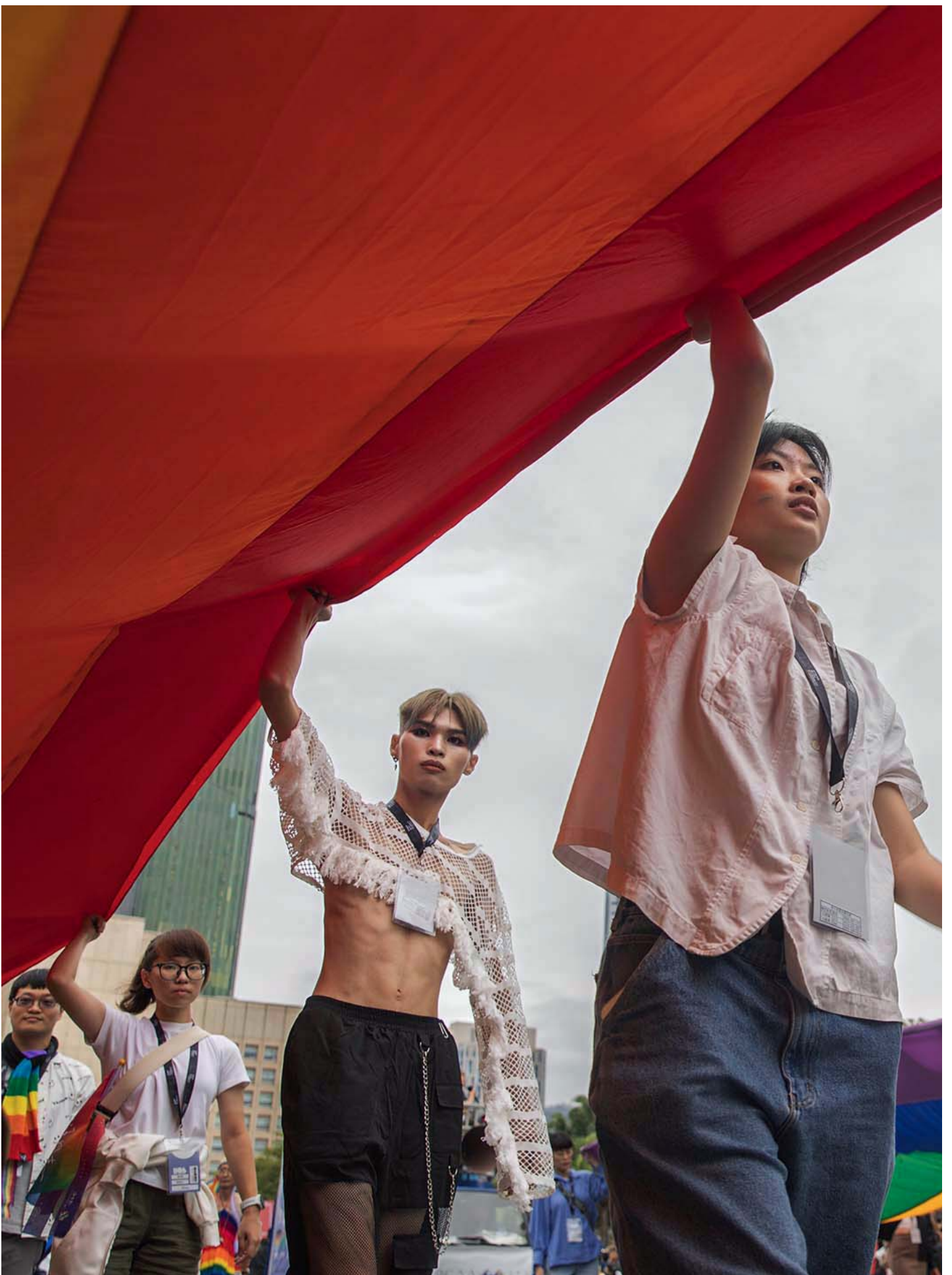
2023年10月28日，台湾同志游行。

这两场近年来台湾重要的同志游行，随着2019年同性婚姻合法化后，同志游行的气氛转为欢快。相较于过往诉求“婚姻平权”的政治性改革，更像是一场盛大的嘉年华。