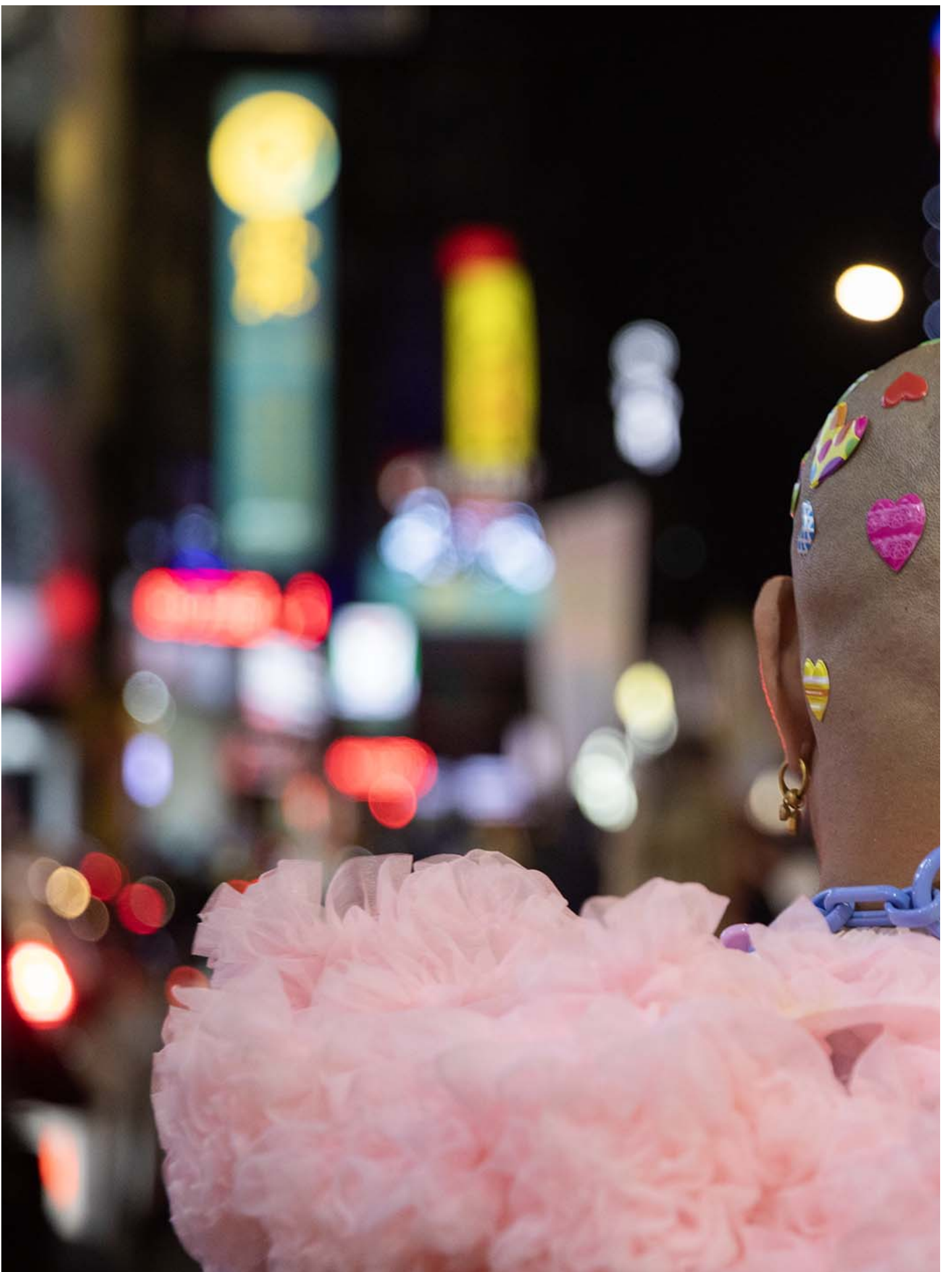
2023年10月27日，台湾跨性别游行。