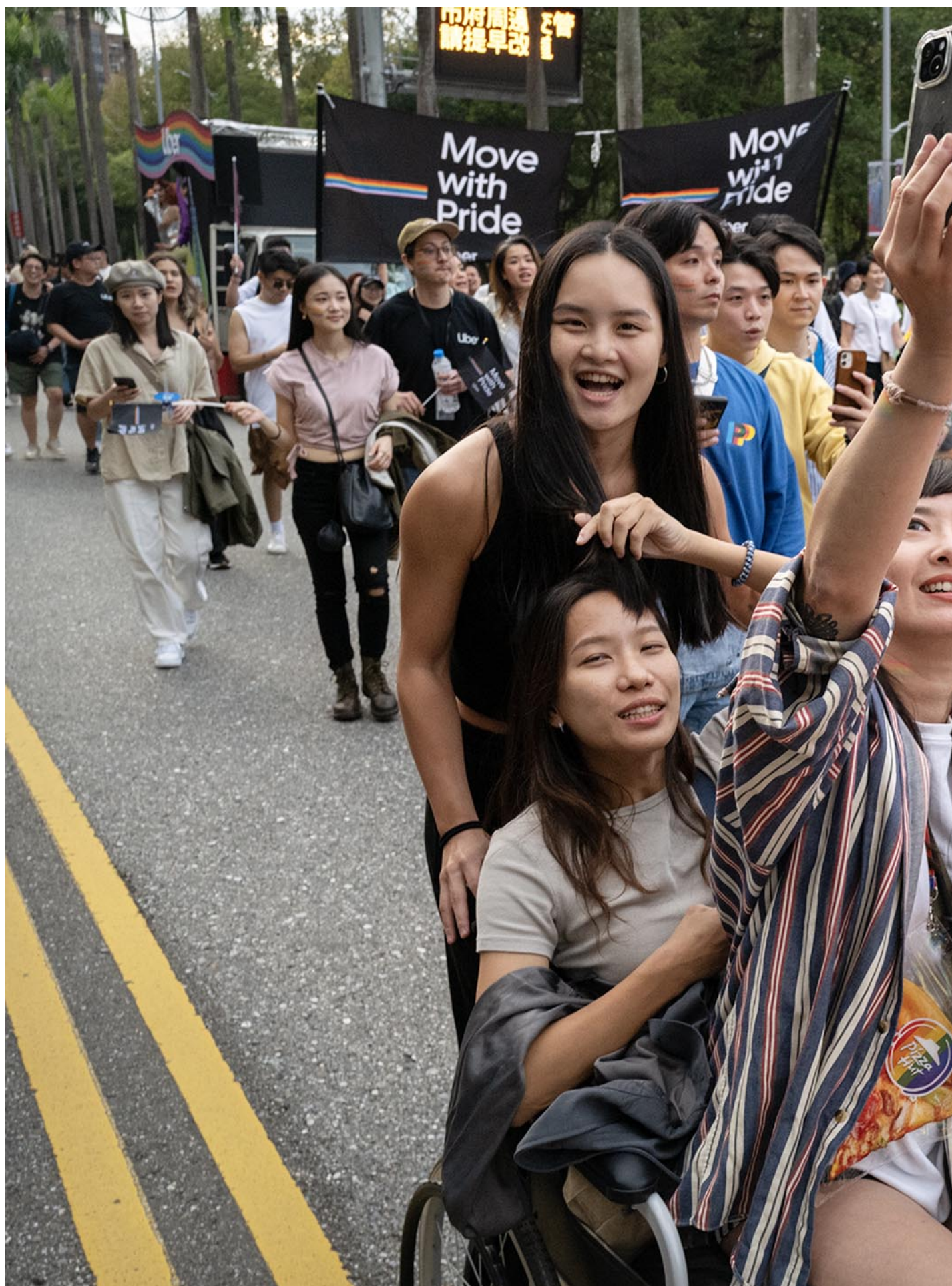
2023年10月28日，台湾同志游行。