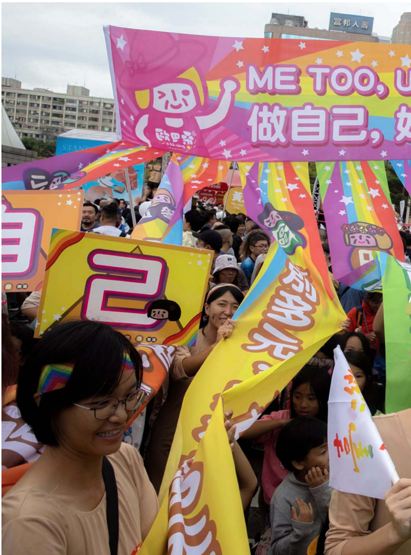
2023年10月28日，台湾同志游行。