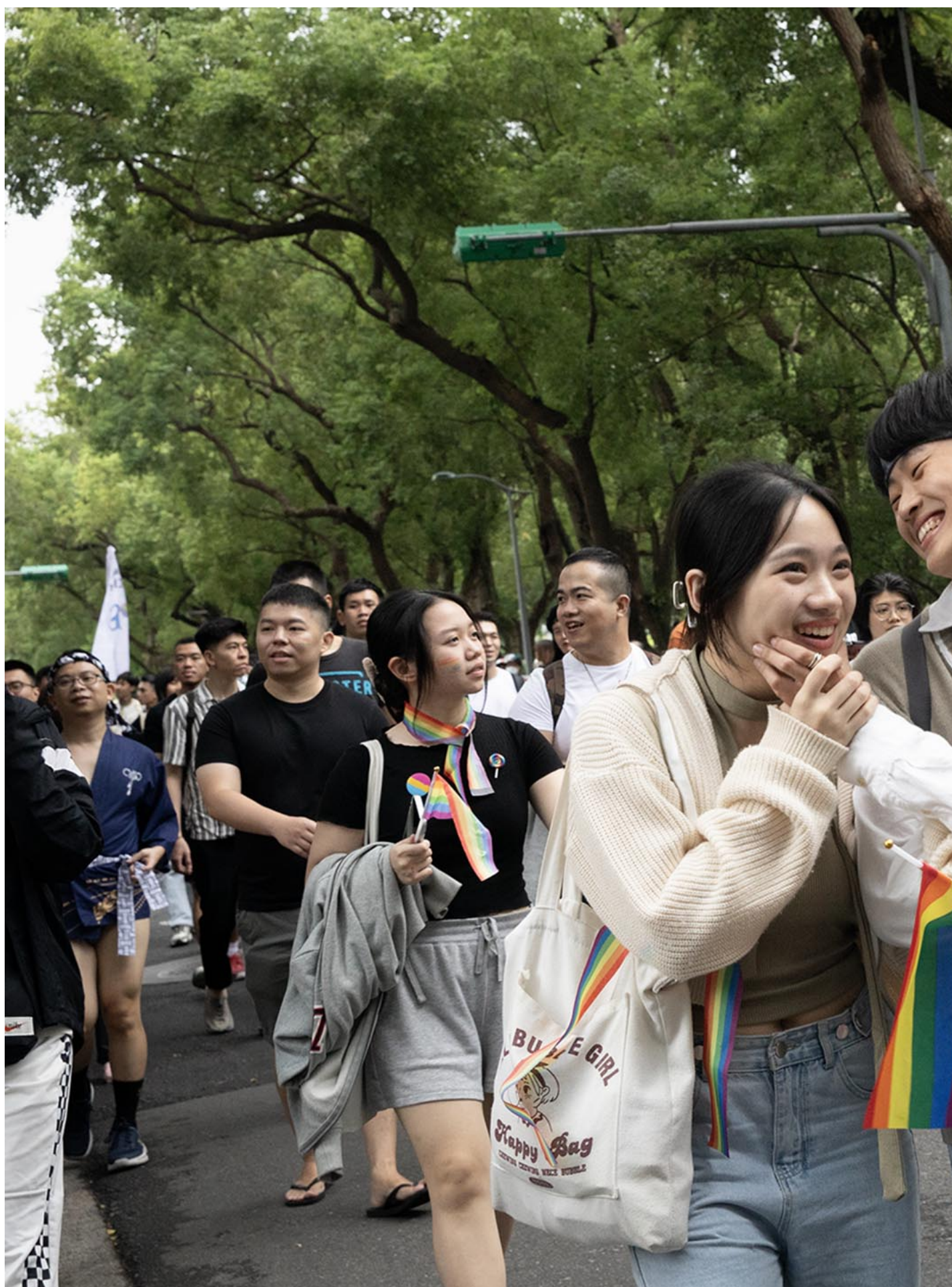
2023年10月28日，台湾同志游行。

Stella 是 NGO 同志咨询热线的志工，直到两年前，他始终认为自己只是一名阴柔的男同志，上大学后，他学到了非二元性别概念，才知道那是他想成为的样子。不过，在台湾，他也遭遇许多困难，因为缺乏性别友善厕所，他得在上课途中偷偷去上厕所，避免引起困扰。