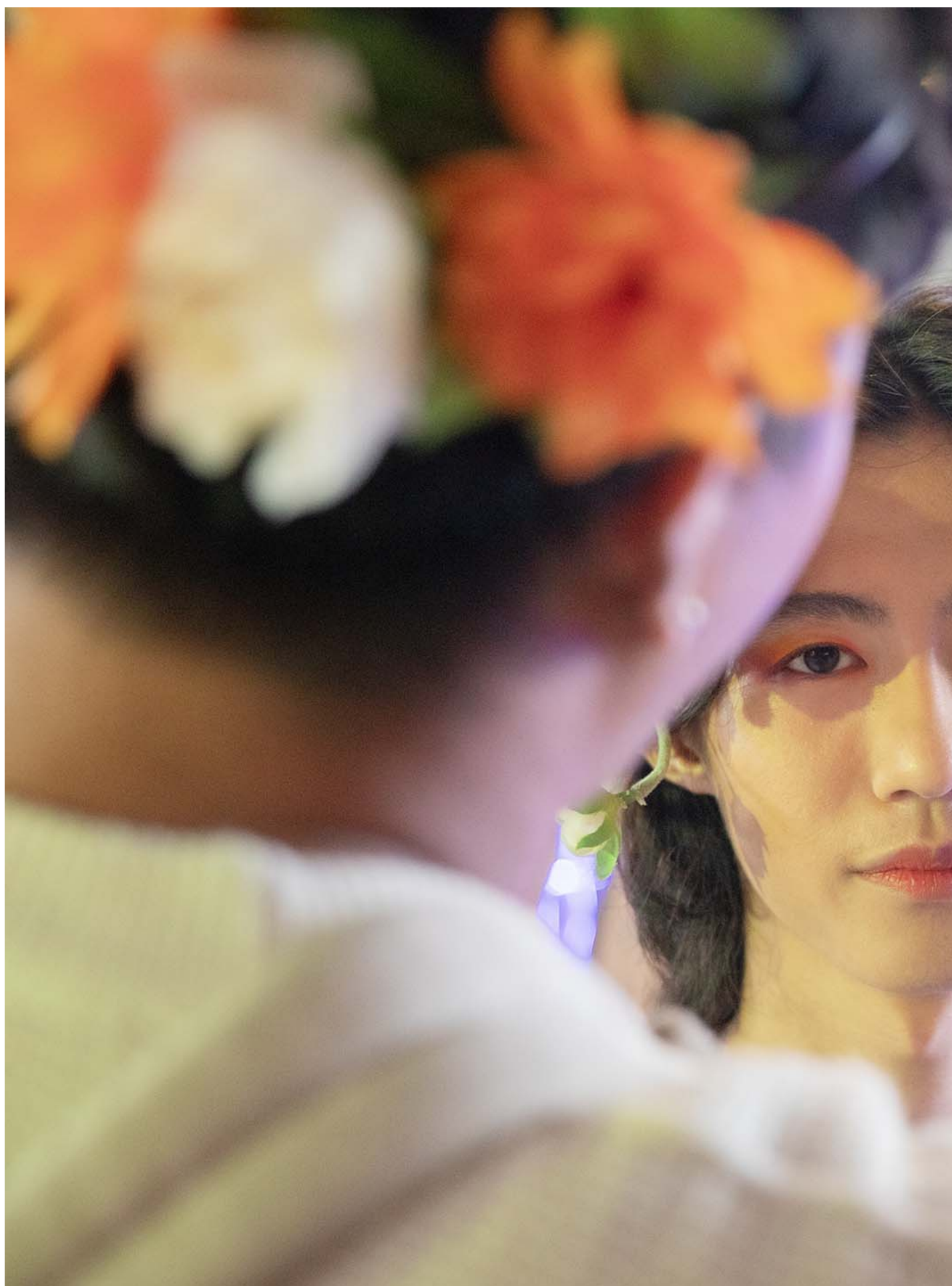
2023年10月27日，台湾跨性别游行。