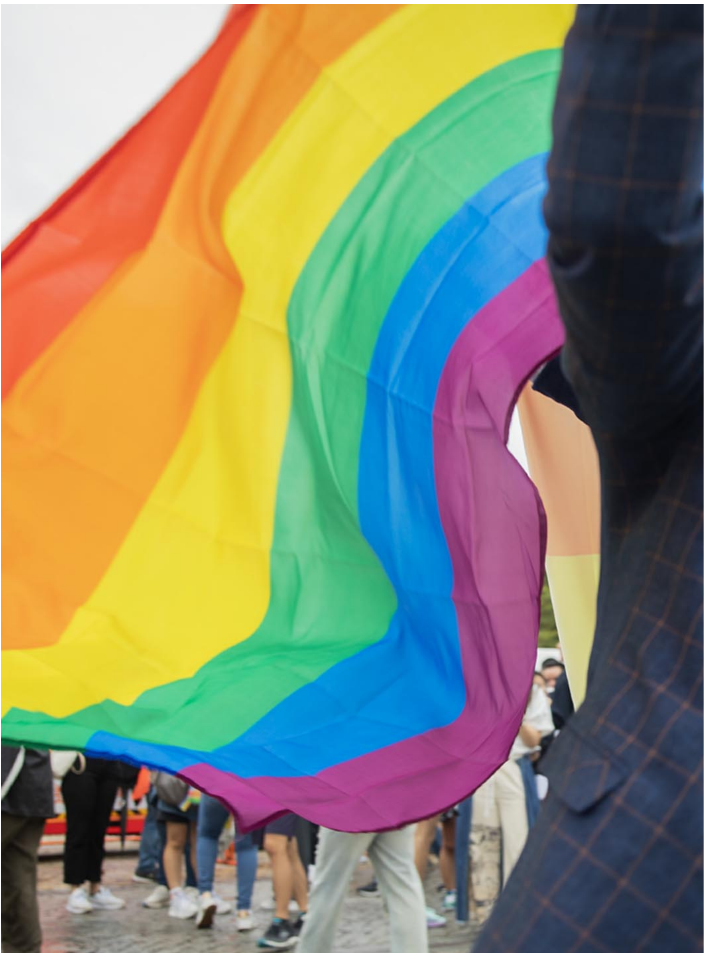
2023年10月28日，台湾同志游行。

反对意见认为，来台的中国伴侣可能会是间谍，陆委会也以国安及相关法律配套问题而暂不开放中台同婚。Jim 表示，国安疑虑不只存在同性伴侣中，他们无法接受因国安理由而无法结婚。 (延伸阅读：《台湾同婚将上路，跨国伴侣“一国三制”未解》)