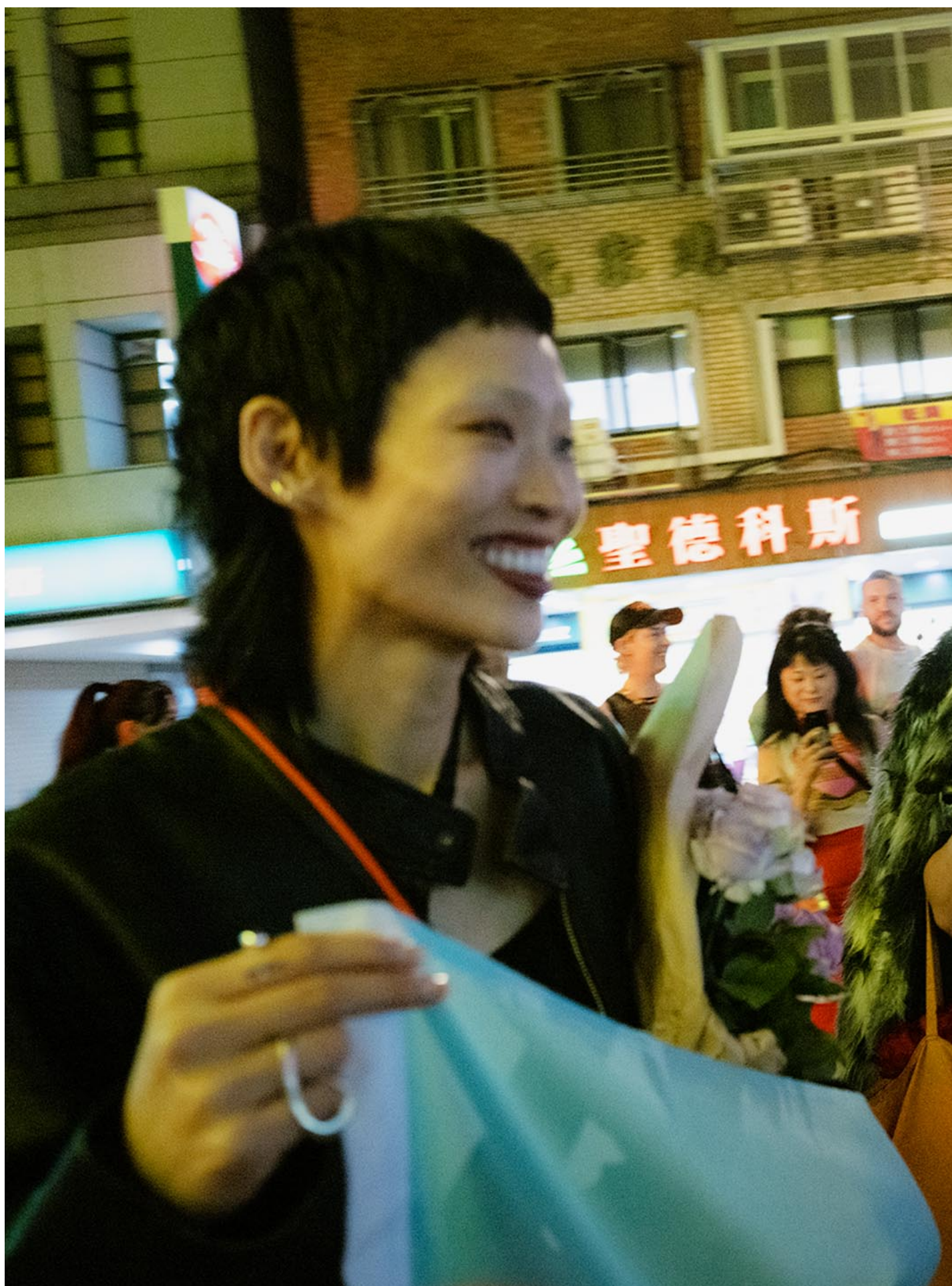
2023年10月27日，台湾跨性别游行。