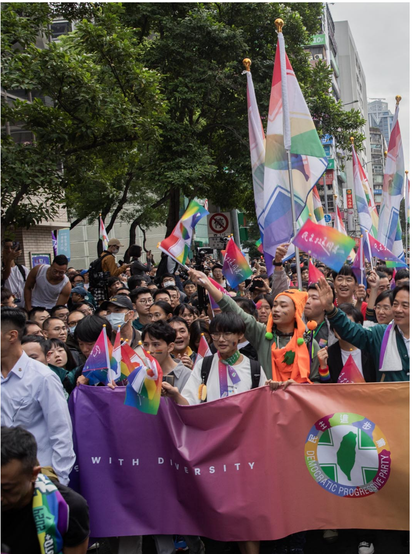
2023年10月28日，台湾同志游行。

然而，即使各政党皆宣称性别平权作为国家进步施政的重要方向，但四组具竞争力的总统参选人中，仅有民进党的赖清德走入游行队伍。赖清德对参与者说：“我会坚定地挺你做自己，让台湾更美丽，我们一起努力。”他并称：“婚姻平权不是终点，是台湾平权文化的起点，未来他会和大家站在一起，在多元同行的路上一起迈进。”游行途中接连有参与者向赖清德欢呼，更高喊“冻蒜”（台语：当选）。