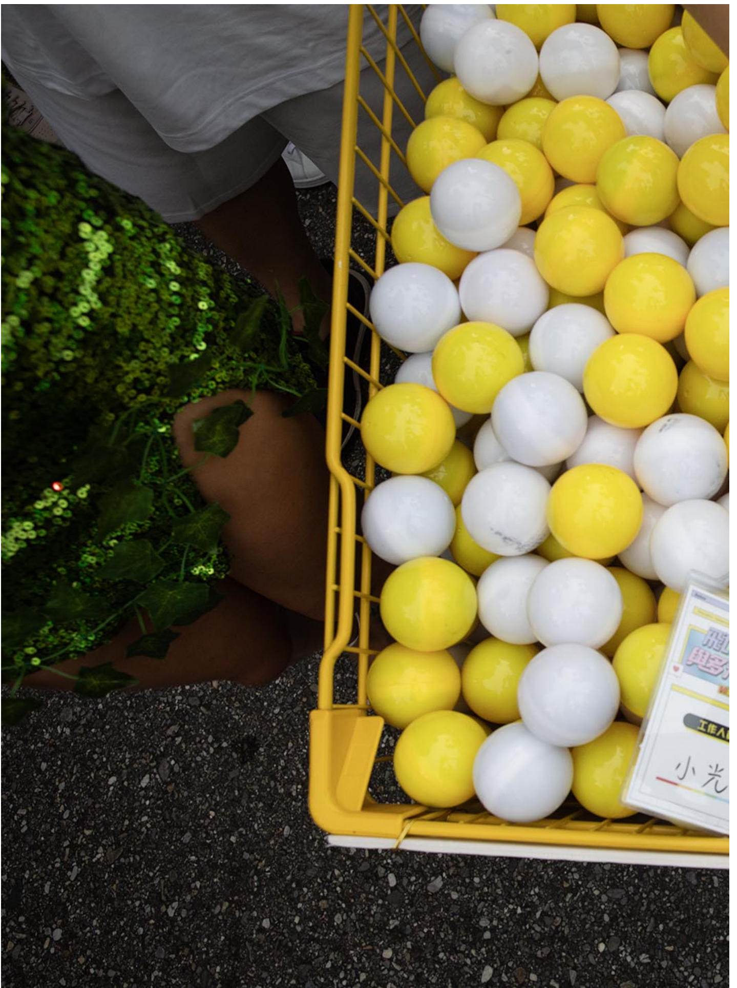
2023年10月28日，台湾同志游行。