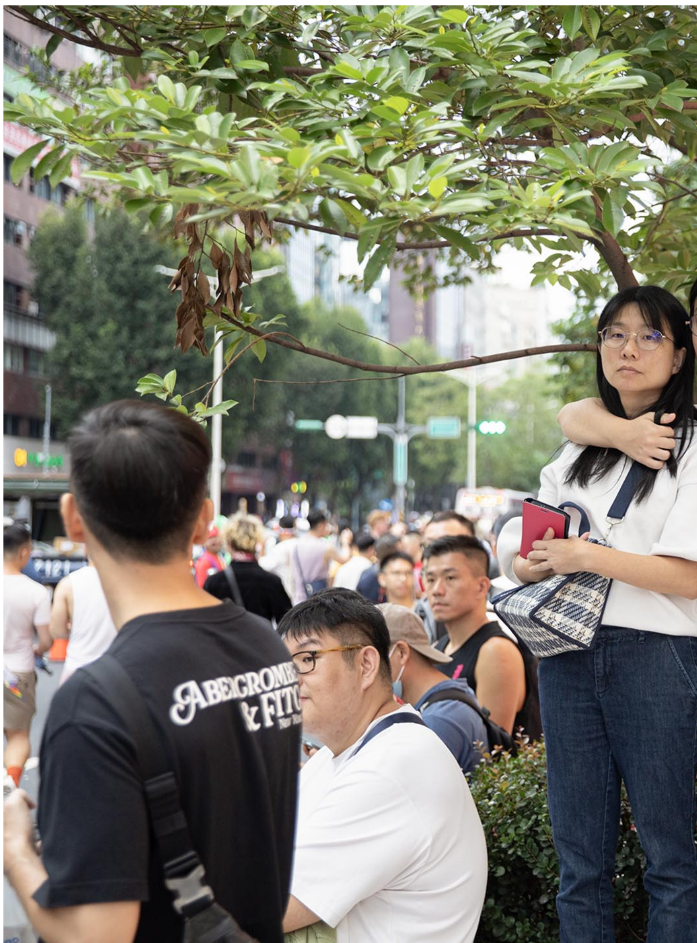
2023年10月28日，台湾同志游行。

荷兰是全世界第一个通过同性婚姻的国家。来自荷兰的跨性别选美皇后 Solange Dekker 穿着蓝色洋装，打扮得十分精致。她在 25 日同志咨询热线所举办的跨性别讲座中分享，在荷兰这个自由多元的国家，纵使跨性别者被接纳，歧视仍然存在。