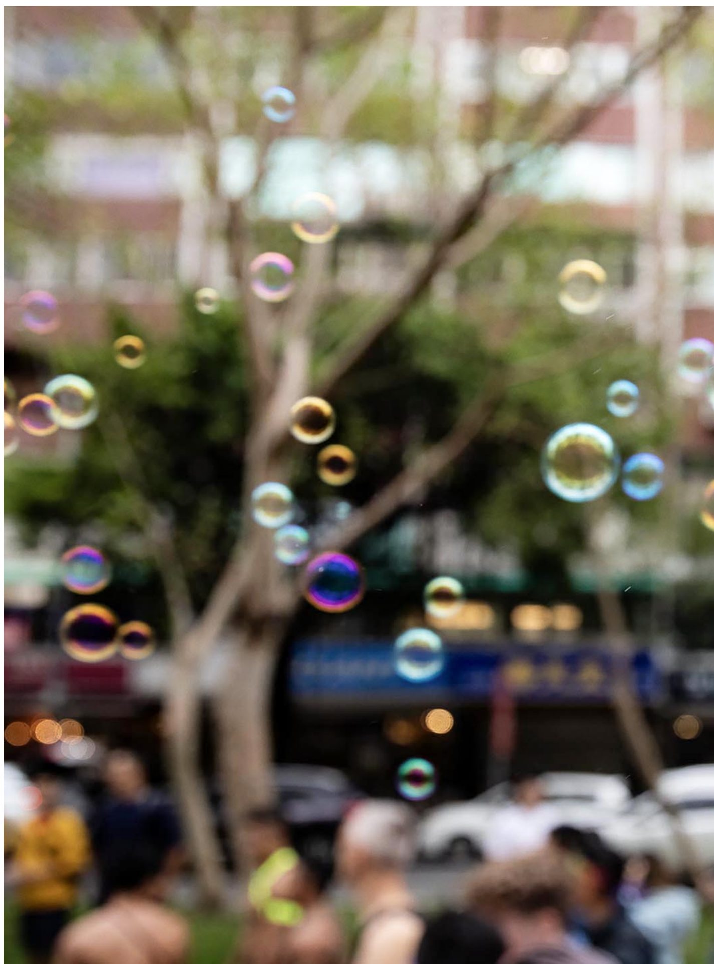
2023年10月28日，台湾同志游行。