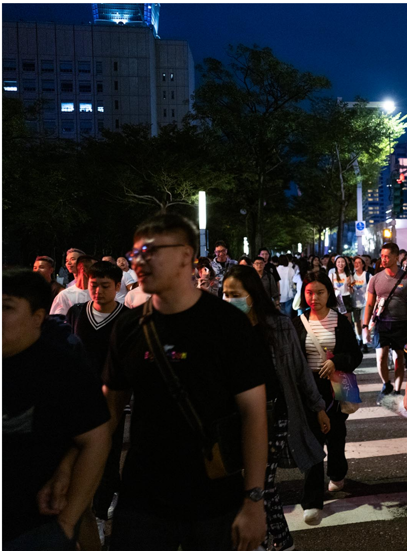
2023年10月28日，台湾同志游行。