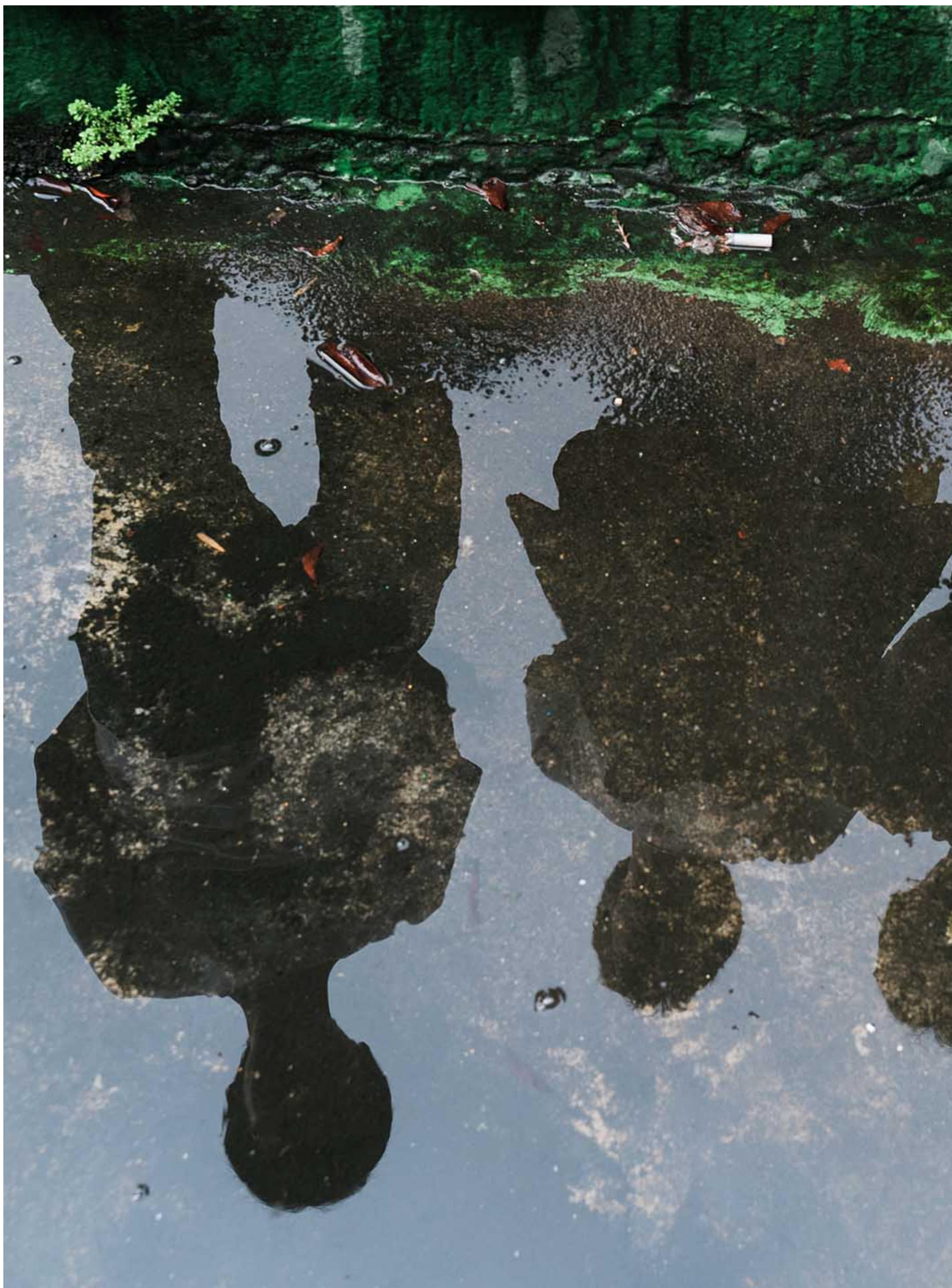
乐团 Little Shy on Allen Street 。

Little Shy on Allen Street不断表示，这个团一路上有许多热心的朋友协助，一齐帮忙赞声，对此他们无比感激。时刻感谢他人、反省自身，专注在自己双手能及的范围，从独立音乐拓荒时期到现在，经历了时间跨度的不同想像，见自己见天地见众生，如今或许看来奇异，但正是四人继续这趟冒险旅程的方法。