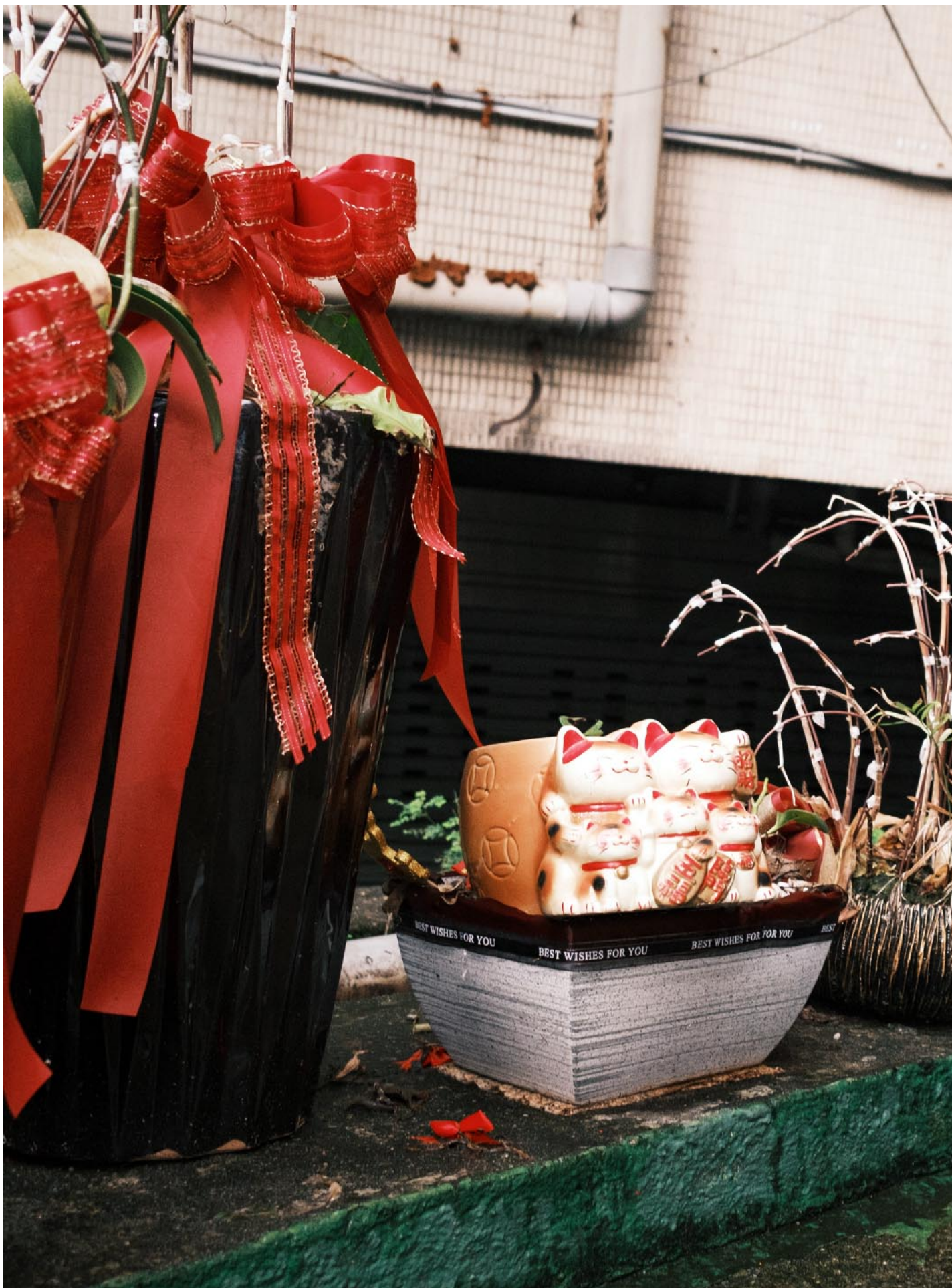
乐团 Little Shy on Allen Street 成员李维翔。

大伟自承并不是一个高产量的创作者，虽然不时有制作和编曲的案子，但除了熊宝贝的〈17〉是跟团员饼干一起填词，所有词曲创作都留在Little Shy on Allen Street了。慢慢累积，靠著网路群组来回讨论修改，尽量维持闲散但正向的气氛推进，宥于时间做出取舍，最后顺利在2022年10月发行。