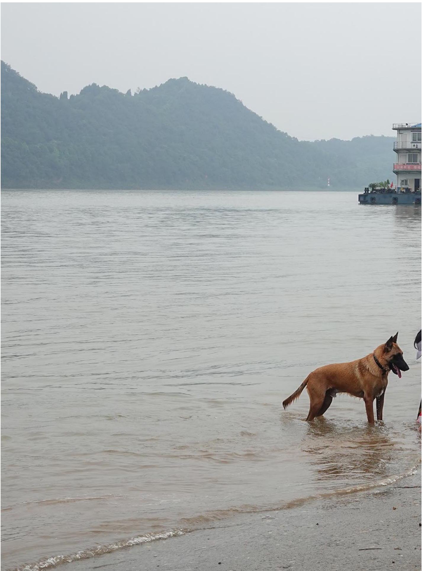
2023年7月26日，湖北省宜昌，一名男子带着他的狗在长江边乘凉。