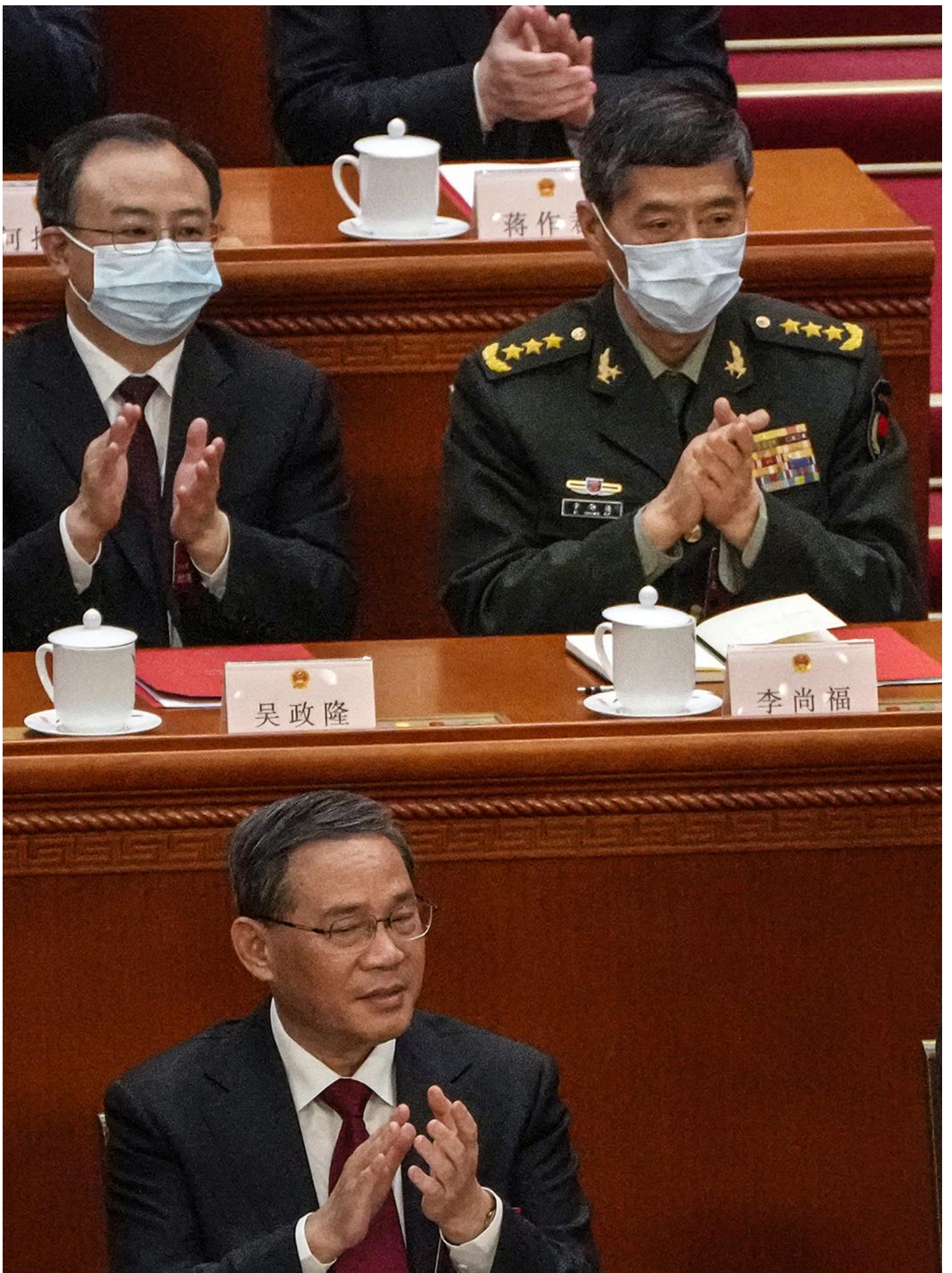
2023年3月13日，北京，中国国家主席习近平（右）在人民大会堂闭幕式上发表讲话时，中国国防部长李尚福与代表们一起鼓掌。

据此前 《南华早报》 报导，中央军委联合参谋部参谋长刘振立可能将接替李尚福担任中国国防部长一职。路透社还指刘振立的任命将在中国举办“香山防务论坛”前下发，有望提振中美双方的军事接触。当时还有消息指，中国已邀请美国防长参加。