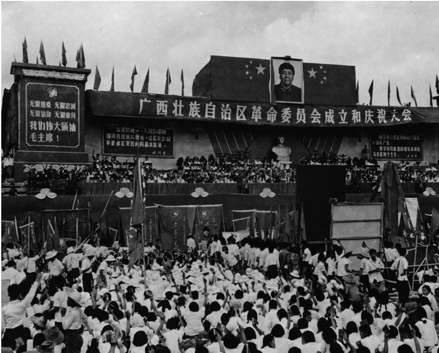
1968年9月17日，南宁，广西革命委员会成立和庆祝大会。

文革进程的复杂性，超出我们对于政治事件与社会运动的一般理解范式，在某种意义上对人的认知能力形成挑战。