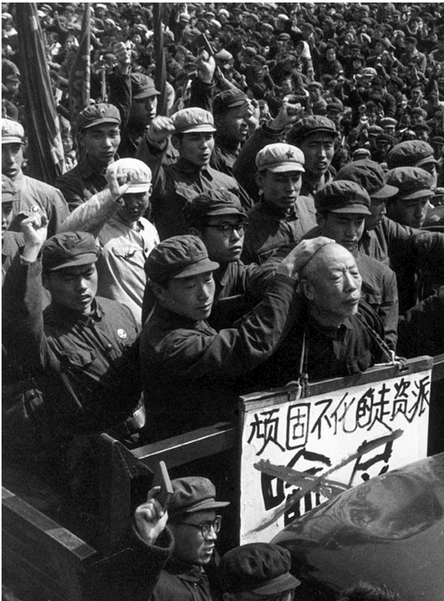
1968年2月1日，文化大革命期间，各地发生批斗事件。

在江苏丰县，“炮联”和“联司”两派以县人民武装部为焦点的冲突在1967年愈演愈烈。虽然“联司”受到人民武装部的支持，但“炮联”获得了被派驻到徐州的68军6174团的同情。因此，“炮联”和“联司”两派的冲突虽呈此消彼长之势，但始终难解难分。到了1968年5月，徐州地区的政治僵局终于让中央忍无可忍。军方代表和各群众派别的头领被召至北京，中央以“学习班”的名义试图调停各派、解决争议、重建秩序。然而正如《十年动荡》一书所指出的那样，造反派别内部组织松散，领导人对基层成员几乎没有实质约束力。就算造反派头领在北京达成“停火协议”，也很难规训丰县造反派成员的地行为，最终的结果是冲突依旧，北京的谈判也几次破裂。中央针对徐州地区的“学习班”持续了长达一年多，在1969年7月才告结束，但丰县的派别冲突此时依然没有缓解的迹象。