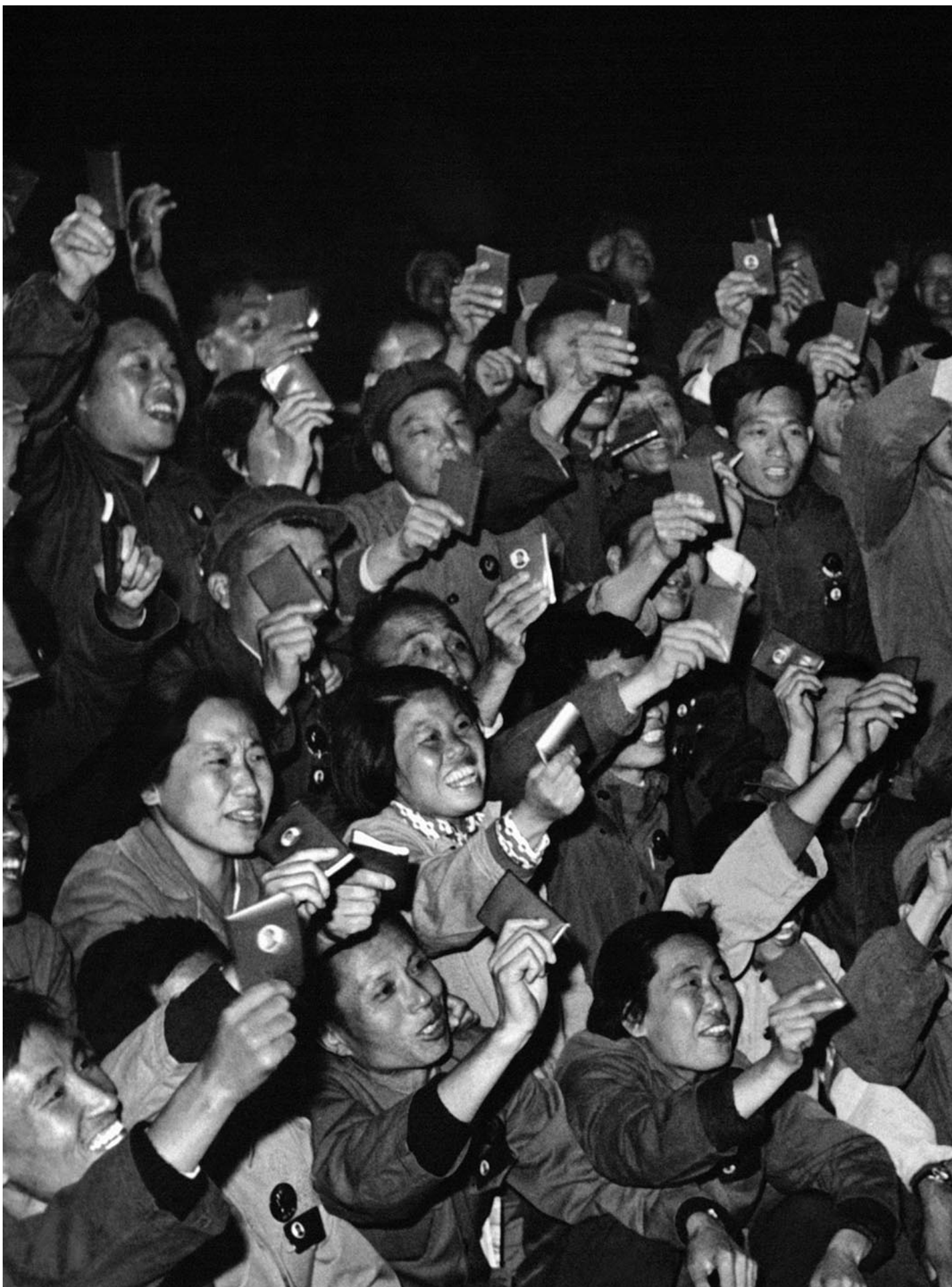
1968年10月1日，中华人民共和国最高领导人毛泽东。