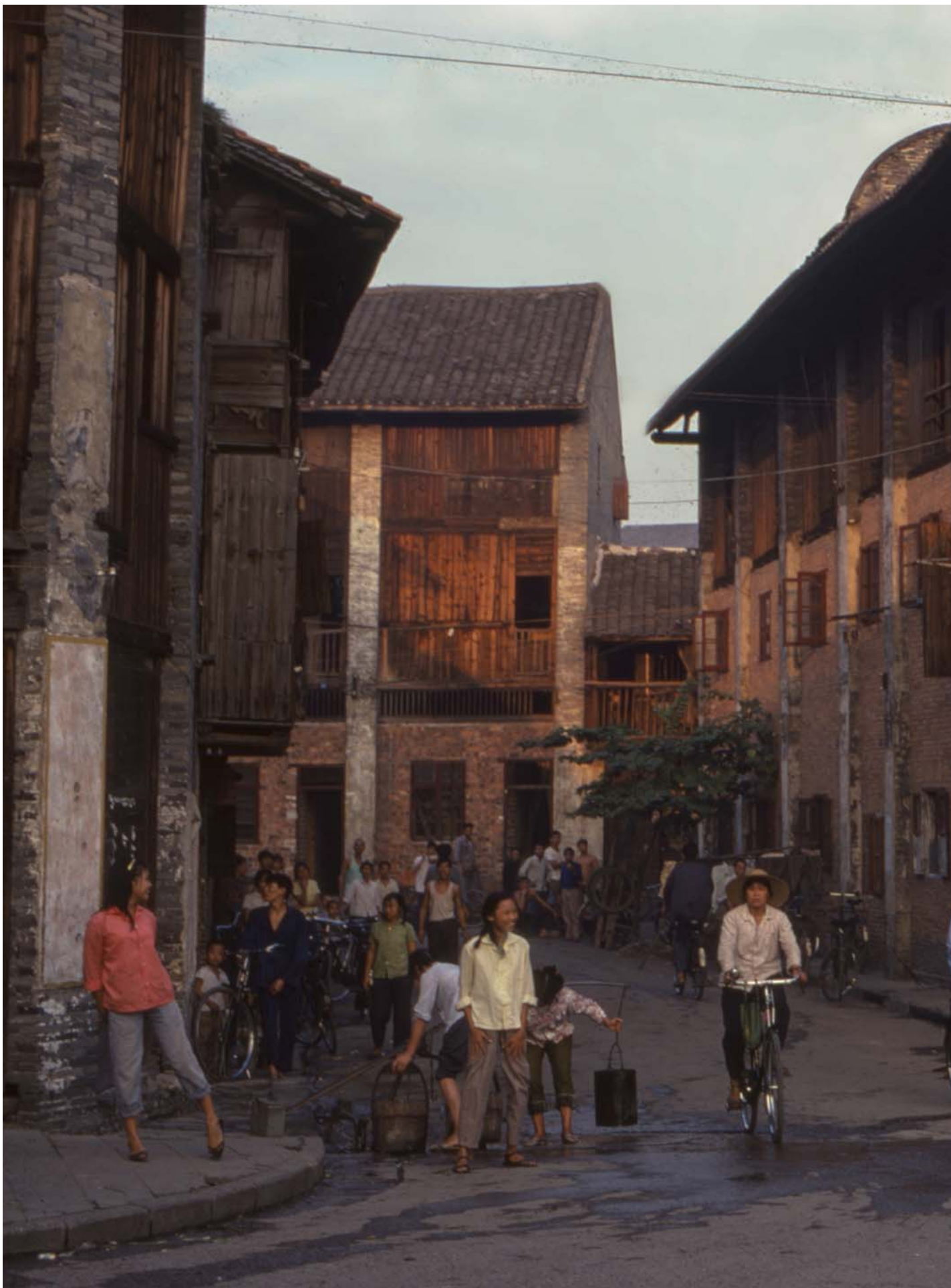
1970年，广西南宁的古街。

但是，即使我们承认派别最初形成的过程带有较强偶然性，也无法否认这样一个事实：处在政治版图有利与不利、中心与边缘不同位置的各个派别，在行动过程中面临不同的情势，在情势的推动下也会为自身的行动赋予不同的意义和政治认同，这些意义与认同确是有激进与保守之分的。尽管也许最初只是因为机缘巧合或琐碎的纷争，但当一个派别发现，自身所处的位置迫使自己不得不去对抗愈发强调恢复秩序的中央意志、去对抗军方不断收紧的权力格局时，这种逆境的情势会使它更能看到党国体制根本上对人民的压迫、更能看到当权者自上而下对基层运动的控制和骑劫，从而发展出更具批判性、或者说更激进的政治观点。类似的现象，也普遍存在于其他大规模社会运动中。