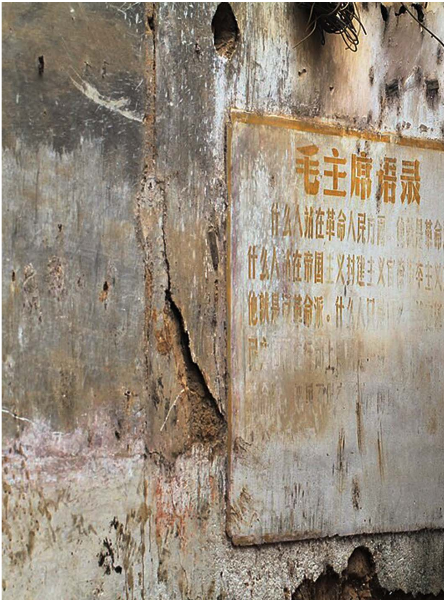
广西武宣县街道墙上的毛泽东语录。

在江苏丰县，虽然县级的革委会在1969年9月艰难成立，但“炮联”与“联司”的冲突仍在继续。最终，随着1970年“清理阶级队伍”运动的展开，派别冲突终于暂时被镇压下去。这一运动虽然一开始将“炮联”与“联司”的头领都列为审查与教育的对象，但最终镇压的铁拳主要挥向“炮联”成员及其支持者。考虑到负责“清理阶级队伍”的正是在县革委会实际掌权的人民武装部（其在之前的派别冲突中支持“联司”），这一结果并不令人意外。数以千计的人在隔离审查和严酷逼问之下被迫供认了自己的“罪行”。《十年动荡》引用的一份材料表明，截止到1970年底，丰县的“清理阶级队伍”运动共查出“阶级敌人”2494人。另一份材料表明，该运动共认定和惩处1256人，其中129人自杀。运动的残酷可见一斑。幸存下来的“炮联”成员，后来走上了历时数年的上访与伸冤之路。