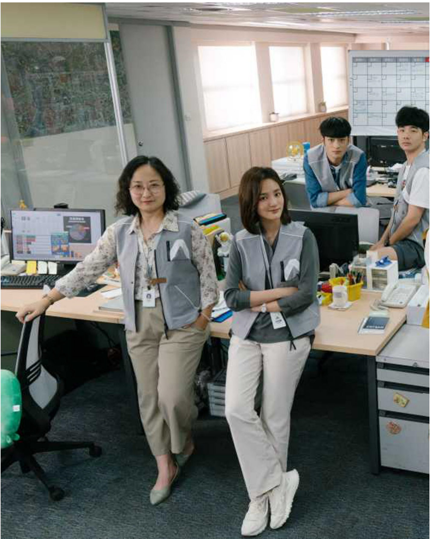
《人選之人—造浪者》剧照。

“女性+”就是以女性视角出发，去和任何一种类型做结合，碰撞出更有爆发力和超越感的作品。其实这种台剧里独具特色的创作思维，从2019年《与恶的距离》和《俗女养成记》在两岸三地造成空前影响力时，就已经初步奠定。前者是“女性+社会写实题材”，后者是“女性+别致乡土剧”，两部剧当年都被誉为神作，不但让整个中文世界“看见台剧”，而且刷新了华语剧集的标准。