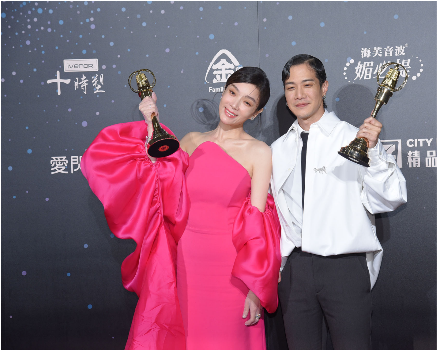
第58届金钟奖获奖戏剧节目男主角：薛仕凌／台湾犯罪故事-出轨（右），以及女主角：蔡淑臻／村里来了个暴走女外科（左）。