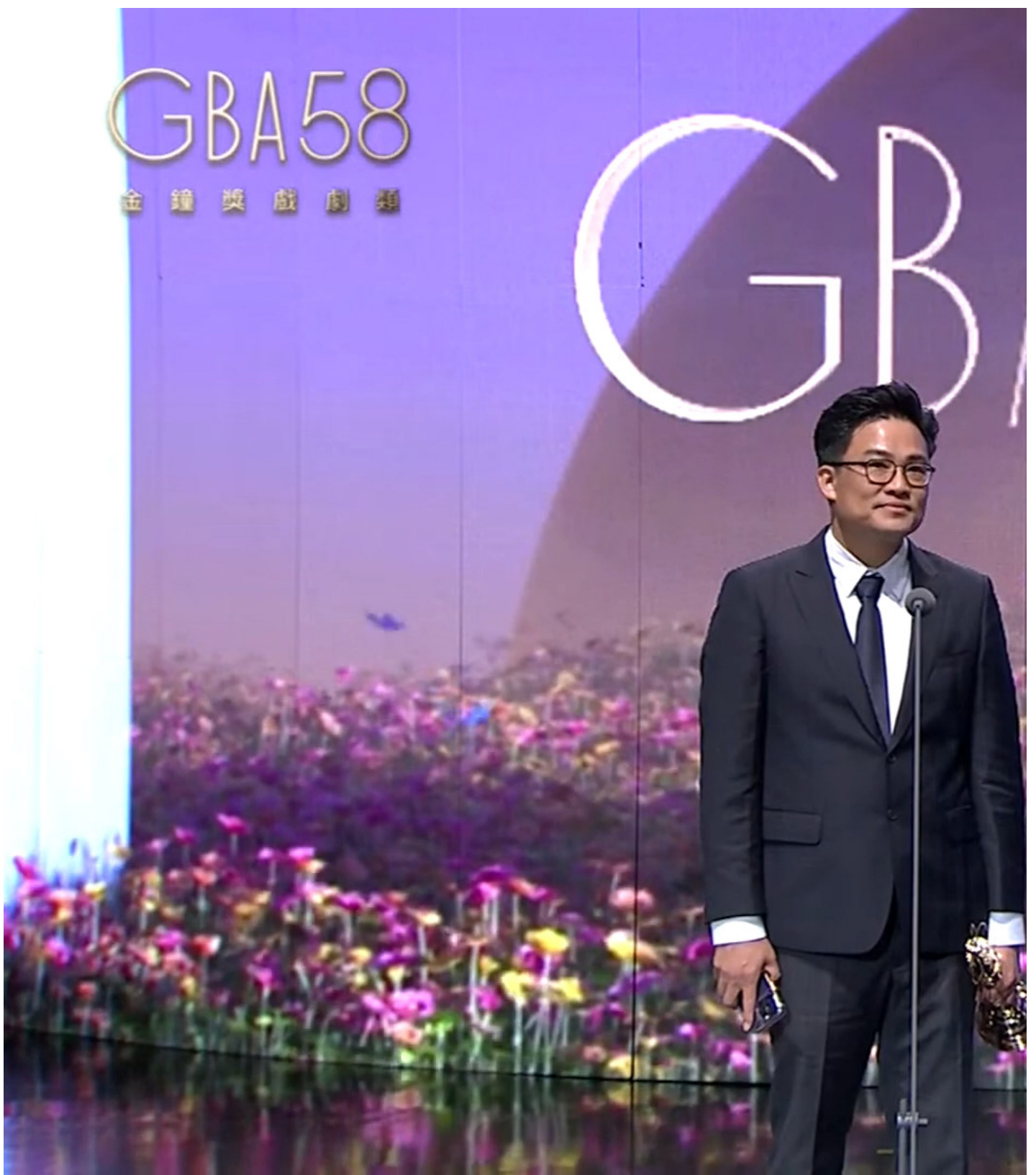
第58届金钟奖戏剧类节目创新奖得主《模仿犯》。

某种意义上，“每个人都可能成为模仿犯”延续了《与恶》对“社会的病征”的深度讨论。随机杀人的凶手很危险，但媒体和舆论环境的失控，以及衍生而出的巨大暴力，危险程度其实更高，造成的伤害也更持久——《与恶》就有类似表达，《模仿犯》延续了这样的观念，抓到了原著里最契合台湾本土又有当代感的部分。