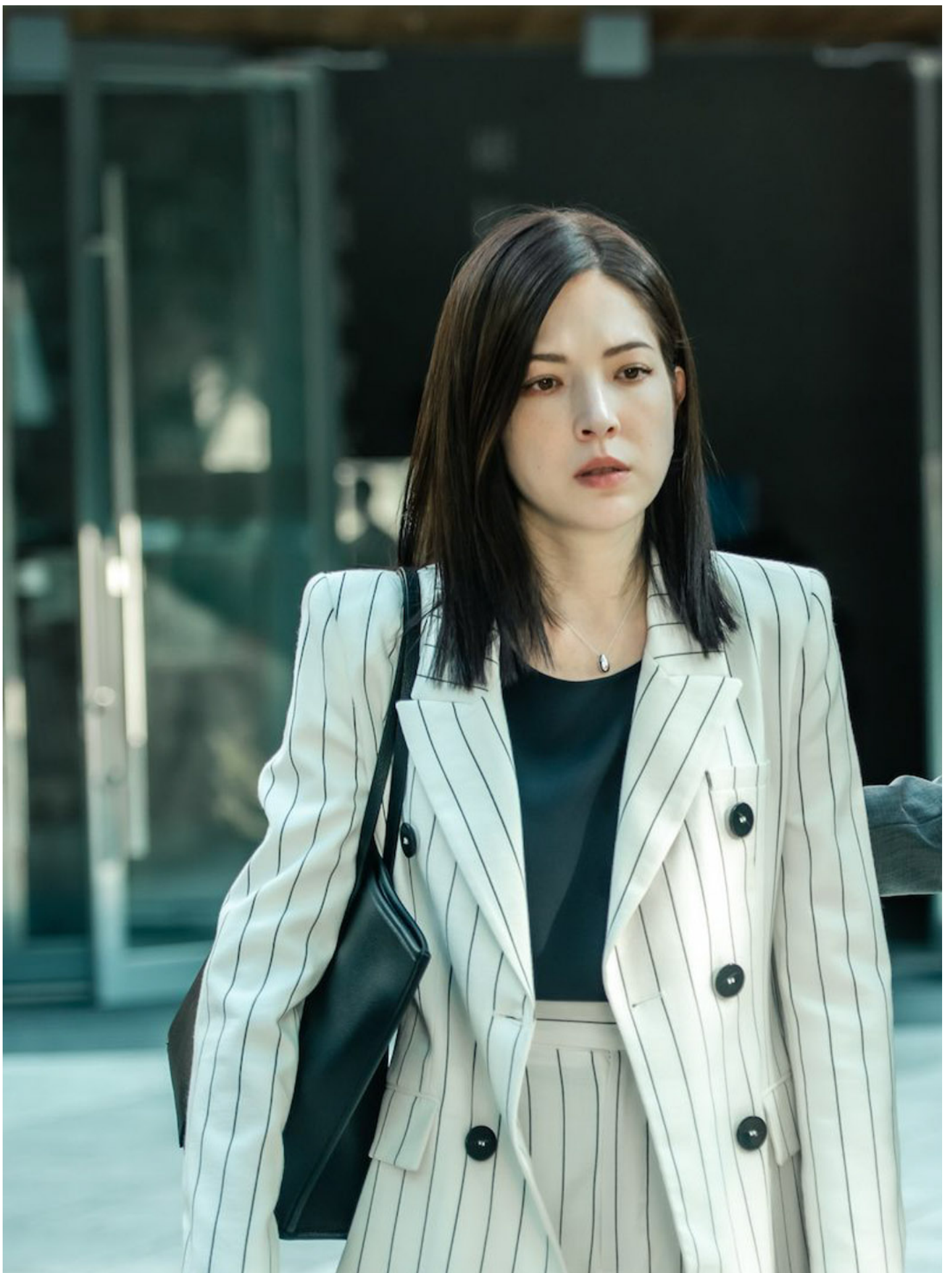
《她和她的她》剧照。图：网上图片

从职场性骚扰、性别歧视、家暴、荡妇羞辱到各式各样对女性的敌视，也在剧中被一一展现，犹如一部“女子困境图鉴”。