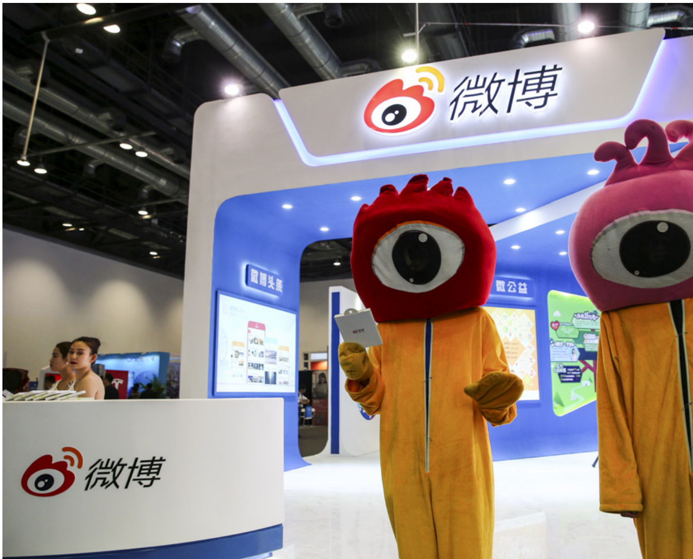
2016年4月28日，中国北京国家会议中心举行的2016年全球移动互联网大会（GMIC）上，两名身穿卡通服装的艺人站在新浪微博展位前。