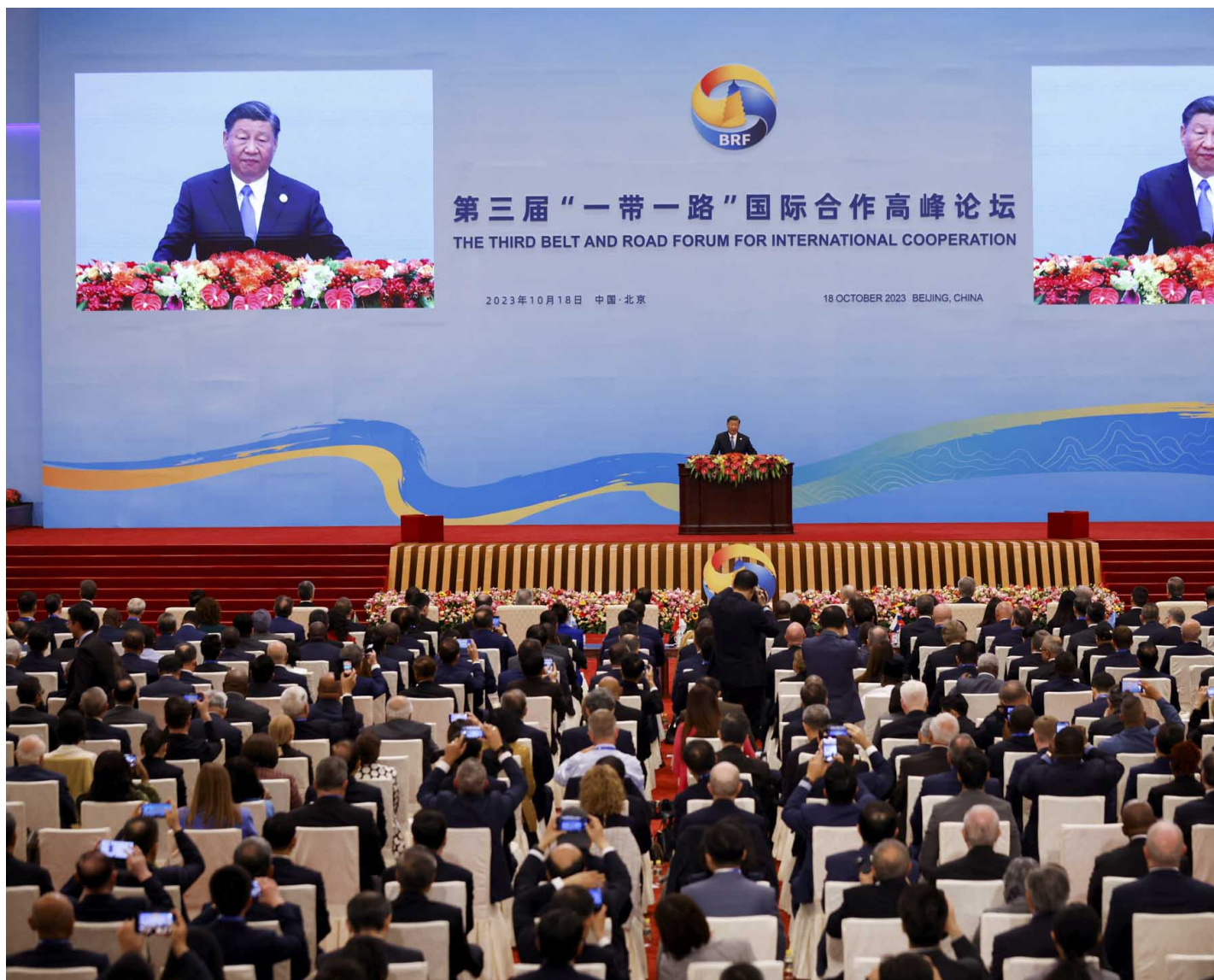
2023年10月18日，中国北京，国家主席习近平在北京人民大会堂举行的“一带一路”高峰论坛开幕式上发表讲话。

新“八项行动”反映出，中国在试图改变“一带一路”早期作为对外投资和资本输出项目和“战略”的定义。