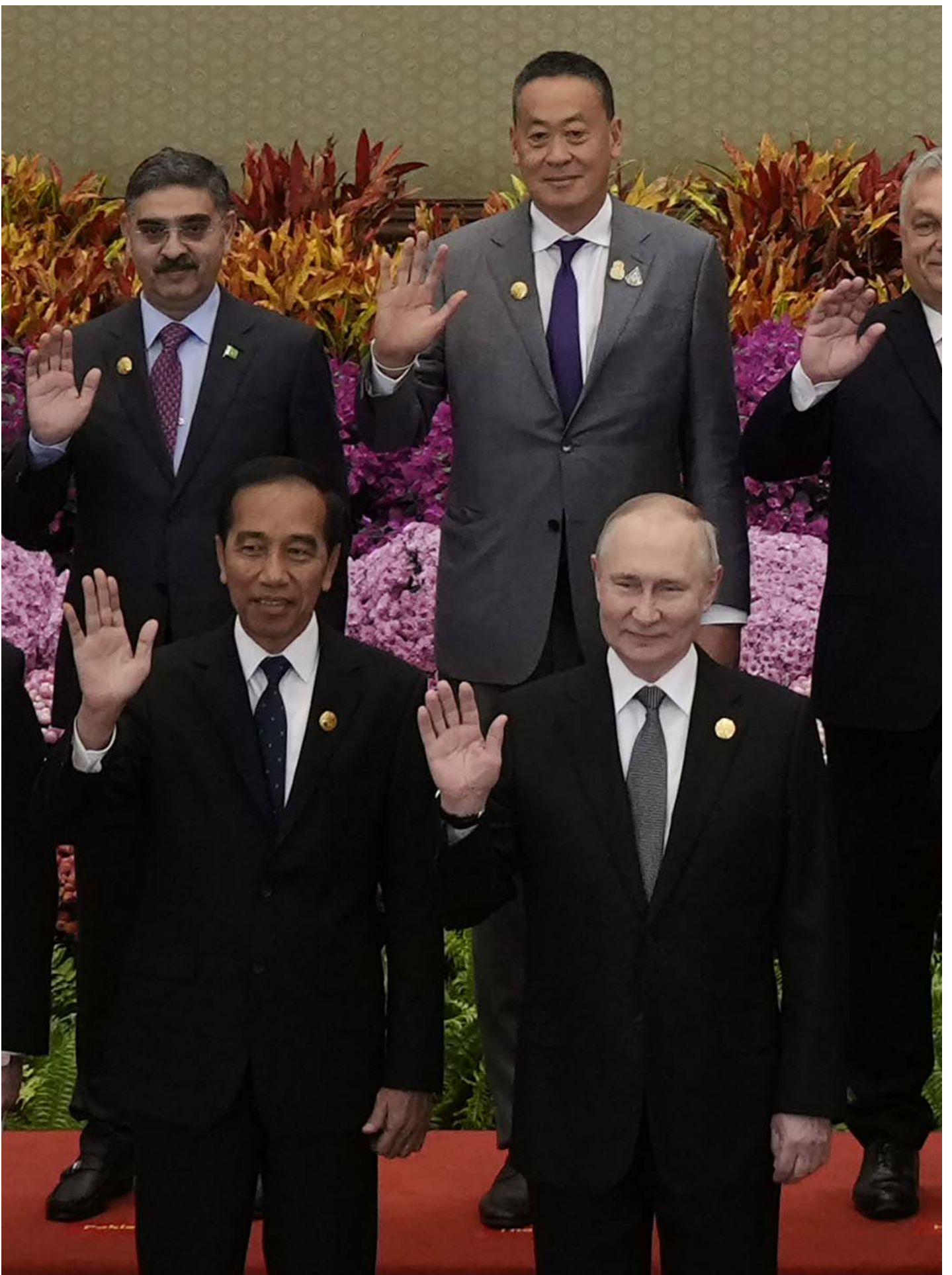
2023年10月18日，中国北京，各国领袖在“一带一路”高峰论坛上合影留念。

相比先前两次会议，此次高峰论坛中，欧洲和中东国家的参与度均降至较低水平。2019年举办的第二届高峰论坛中，欧洲国家中有捷克、奥地利、瑞士、葡萄牙、白俄罗斯、匈牙利、塞尔维亚、意大利、希腊和阿塞拜疆派出了国家元首或政府首脑出席。而今年的第三届高峰论坛，欧洲国家领导人中只有匈牙利总理欧尔班和塞尔维亚总统武契奇（Aleksandar Vučić）前往北京。其中欧盟国家领导人只有欧尔班一人。