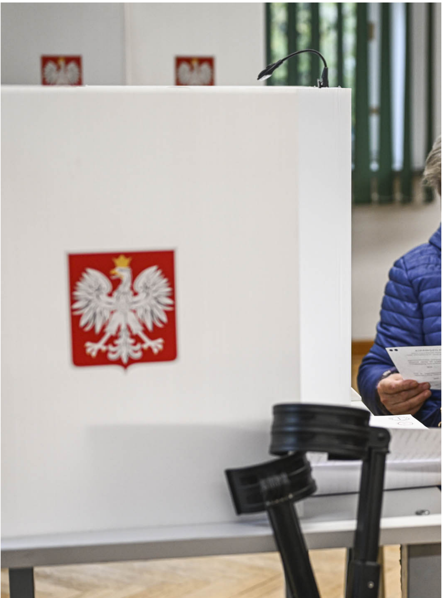
2023年10月15日，波兰，波兰议会选举期间，一名妇女用放大镜看选票。

但这次选举中表现最亮眼的并不是公民联合，而是成立不久就赢得了议会65席的“第三条道路”。第三条道路是成立与2020年的波兰2050党和历史悠久的农业政党波兰人民党加上其他小党组成的政治联盟。波兰2050党在其中占多数。