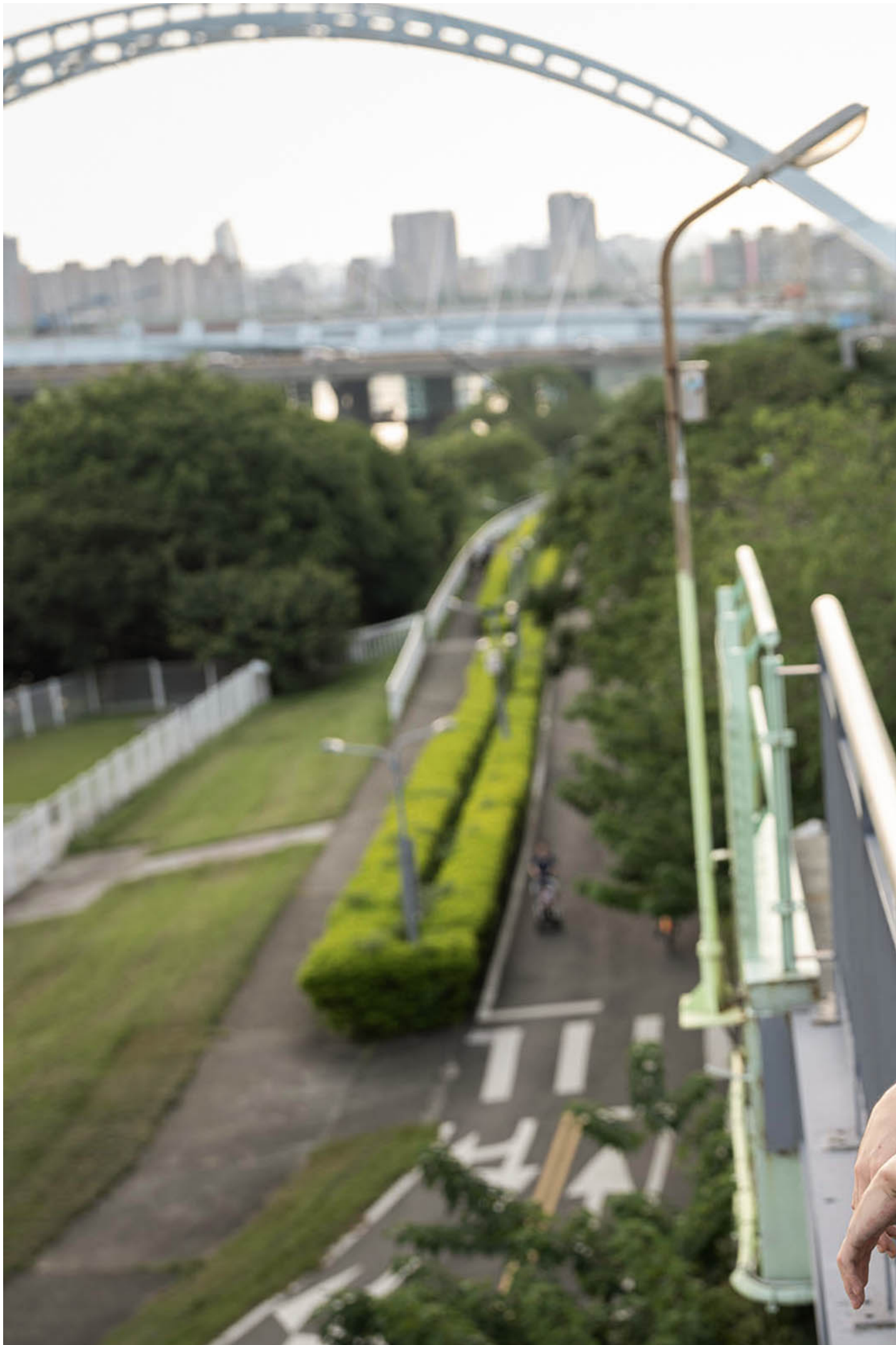
客家音乐人 Vuize 王钟惟。

就像我们有时候会有“客家兴亡为己任”的念头。假如这一段时间我去跟很多人讲，“嘻哈要是没有的话，他就会灭亡”，你就会觉得是无稽之谈，因为嘻哈现在是主流。所以我就要回到来问钟惟，或许你唱华语的嘻哈，你的受众群也不错，你使用客语来做嘻哈音乐，文字难度就很高。饶舌就是需要听文字，很多时候听文字内容的东西对不对？因为它就是一个flow，里面的歌词内容会让大家很有感觉。可是用客语饶舌，群众跟你之间的关系，你觉得怎么样？或者至少这几年，有没有领悟到一些成功的方法？