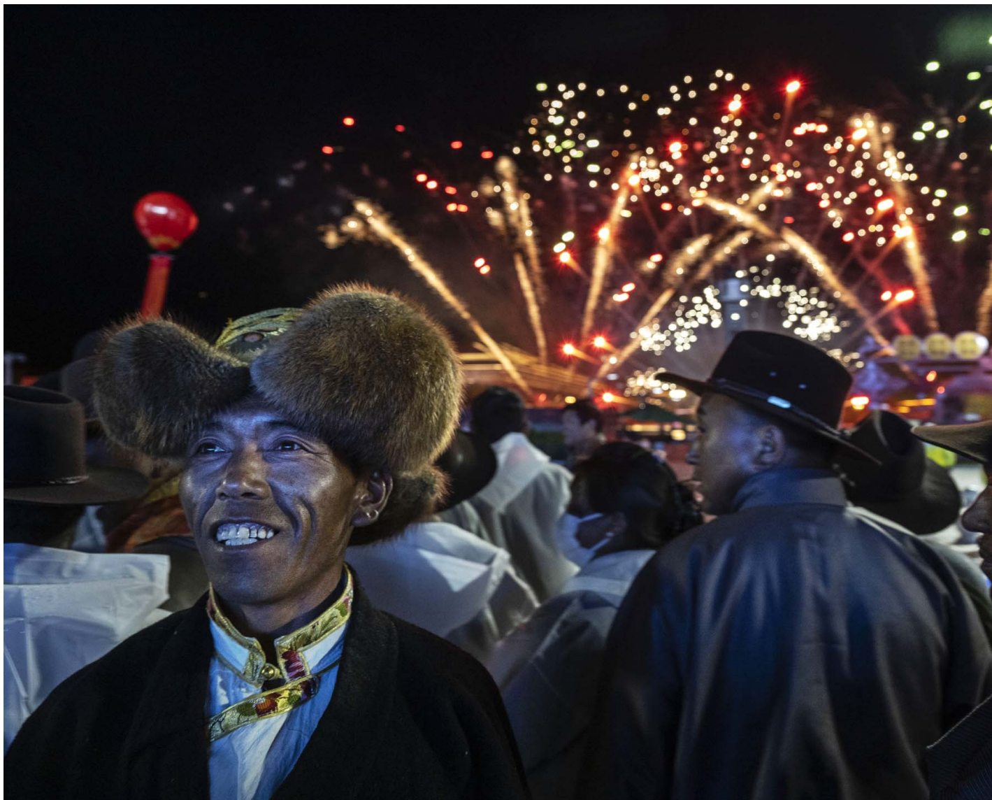
2023年6月16日，西藏拉萨，政府组织的第五届中国西藏旅游文化博览会开幕式结束时，一名藏族男子穿著传统服装望向舞台，其他人则观看烟火。

使用“Xizang”而非“Tibet”主要是从2022年开始的，见诸于中国外交部和《环球时报》的文章和外交辞令中。