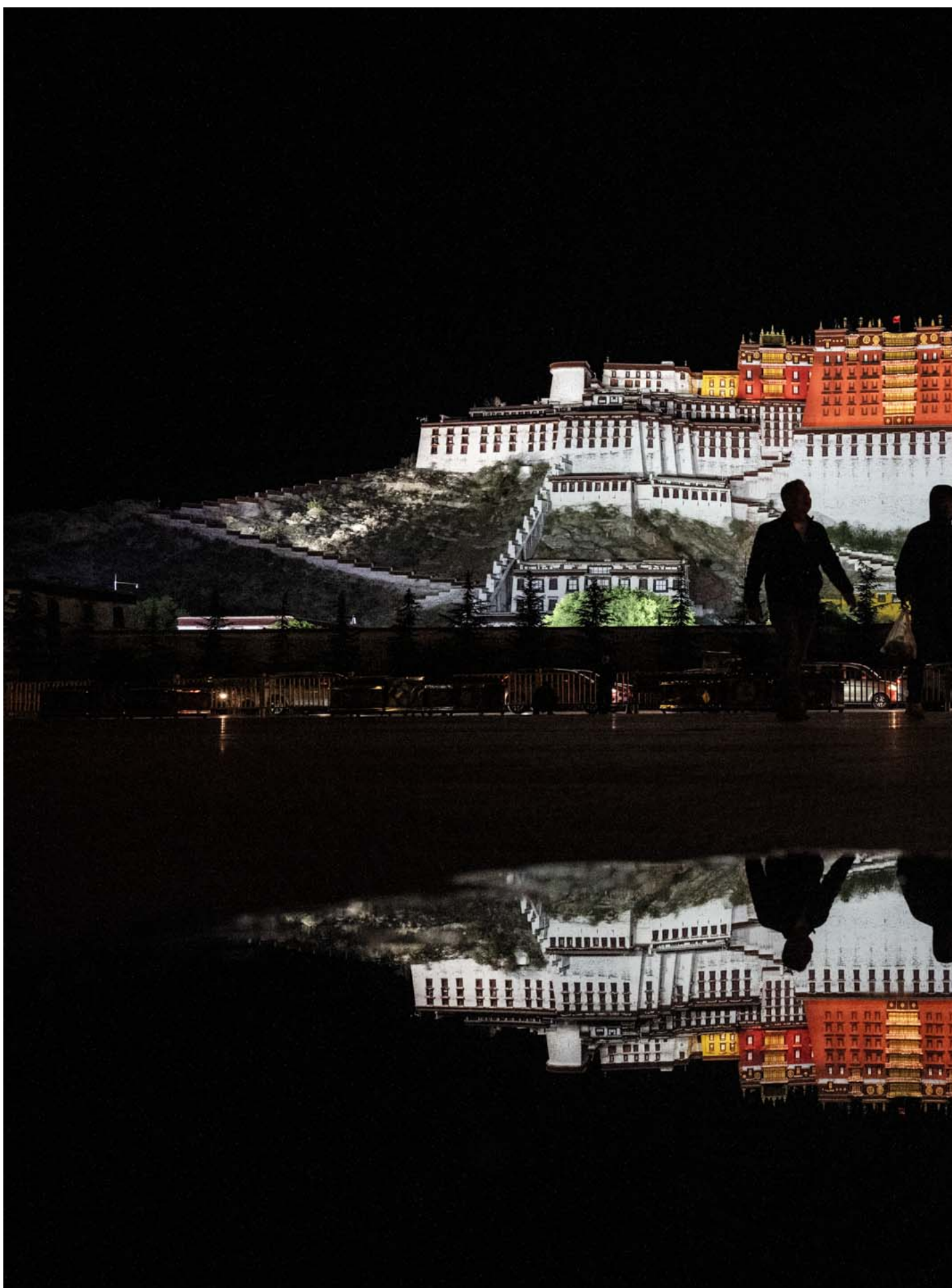
2023年6月16日，西藏拉萨得布达拉宫夜间灯火通明。

行政区划地名如何翻译，在中国法规中并未清楚予以规定。2022年5月1日起施行的《地名管理条例》中未有提及翻译问题。“统战新语”则引用一份1978年华国锋仍担任国务院总理时国务院批转的《关于改用汉语拼音作为我国人名地名罗马字母拼法的统一规范的报告》作为法规证明。但其中其实提到，“历史地名，原有惯用拼法的，可以不改，必要时也可以改用新拼法，后面括注惯用拼法”，“蒙、维、藏等少数民族语人名地名的汉语拼音字母拼写法，由中国地名委员会、国家测绘总局、民族事务委员会、民族研究所负责收集、编印有关资料，提供各单位参考。”