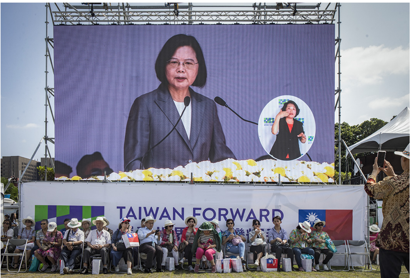
2019年10月10日，台北，双十国庆大会中总统蔡英文在台上讲话。

然而，2018年国民党在超级“母鸡”韩国瑜的带领下，民进党依然难以力挽狂澜、以惨败收场，包括民进党的铁票仓高雄亦遭政党轮替。但这场对国民党睽违已久的大胜并未持续太久。2019年开年第二天，中国国家主席习近平发表“习五点”谈话，首度将“九二共识”定调为“一国两制”，并提出台湾方案；随后香港爆发反送中运动，持续半年以上的街头激烈对抗，接连引发台湾社会的“亡国感”氛围，这也从2019年的 国庆演说 中反映出台湾社会的“中国因素”。