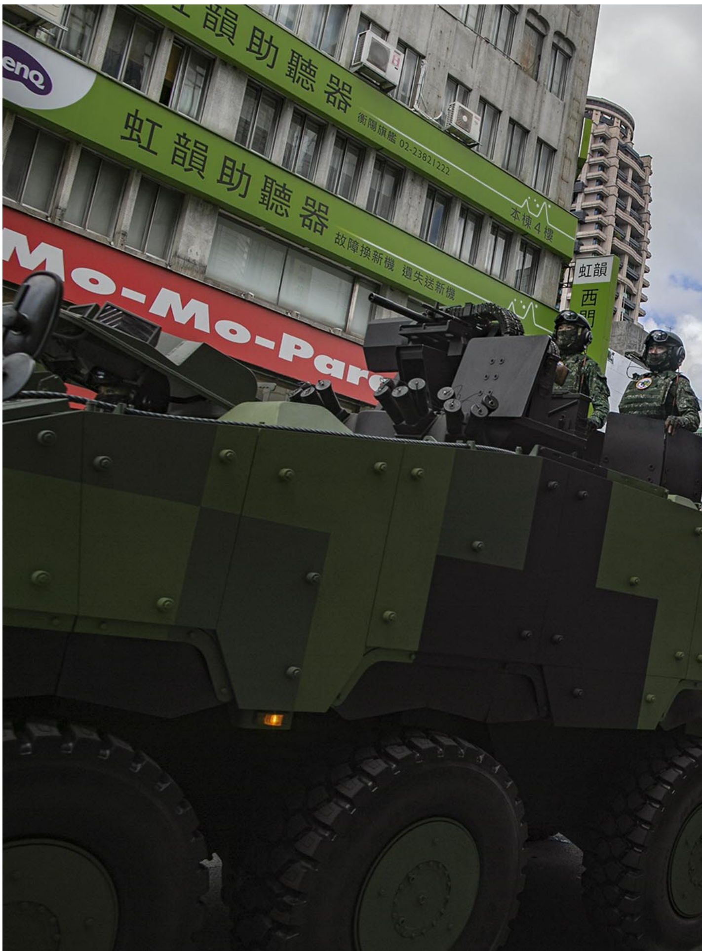
2021年10月10日台北，双十节国庆大会，军车在街道行驶。

而后，随著两岸关系的急转直下，美中对抗成为世界新冷战格局，来自中国的军事威胁加大，国庆演说也一次次于国防篇幅加深加广，除了向国民传达卫国决心，也对国际社会传递自我防卫的努力，同时以国际参与、民主同盟、或是新南向政策表达与周边国家的联系。而这样的演说方向，也在2020年Covid-19疫情爆发后，更加倾向特定的表述方式。