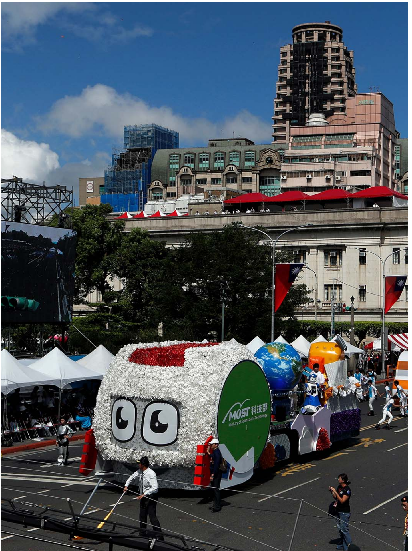
2017年10月10日，台北，双十国庆大会。

2017年，蔡英文首度在任期内以一定篇幅突出国防力量及安全议题。在强化国军战力上，蔡英文提出面对现代化的战争，“不以量多，但以质精为导向的部队，必须有更强韧的战力”，并强调在网络战、三战渗透（指空战、海战、陆战）、以及关键基础设施的保护上要有更多的精进，并要有整合各军种的联合作战能力，通过防卫固守和重层吓阻来保护台湾的安全。蔡英文也强调提振国军士气的重要性，将透过个装更新、营舍改建、兵役制度的精进，以及增加各项加给来提高国军的士气。