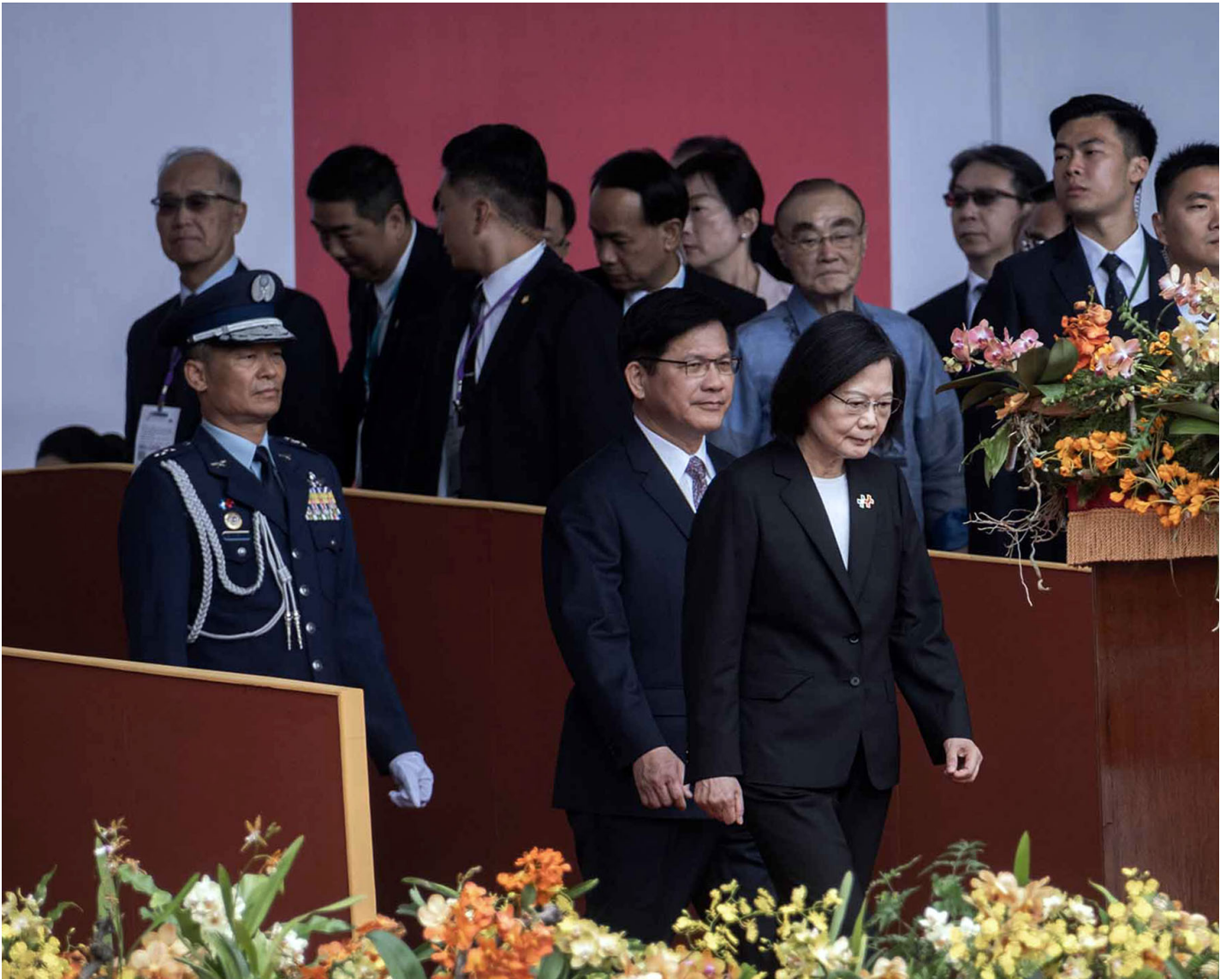
2023年10月10日，台北，总统蔡英文在总统府前广场进行最后一次双十国庆演说。