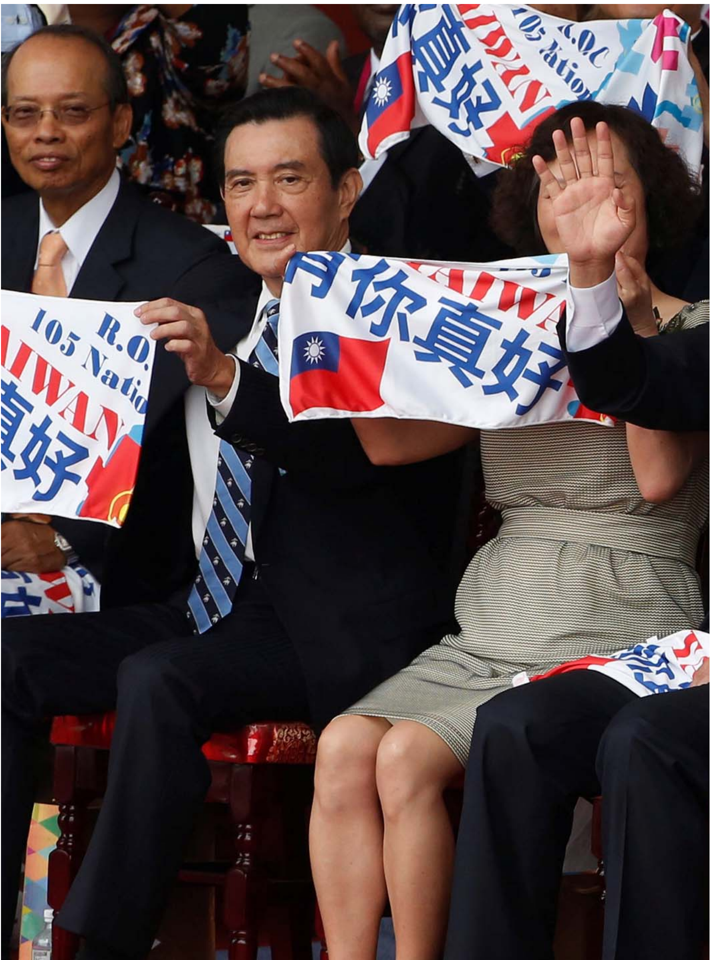
2016年10月10日，台北，总统蔡英文和前总统马英九出席双十国庆大会。