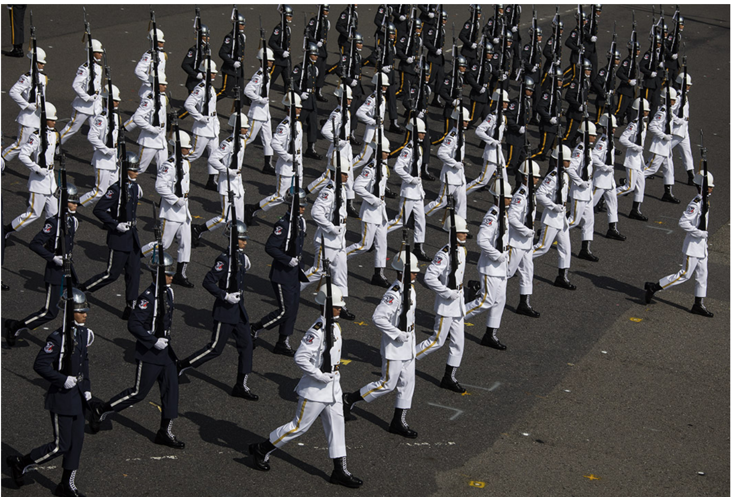
2019年10月10日，台北，双十国庆大会。