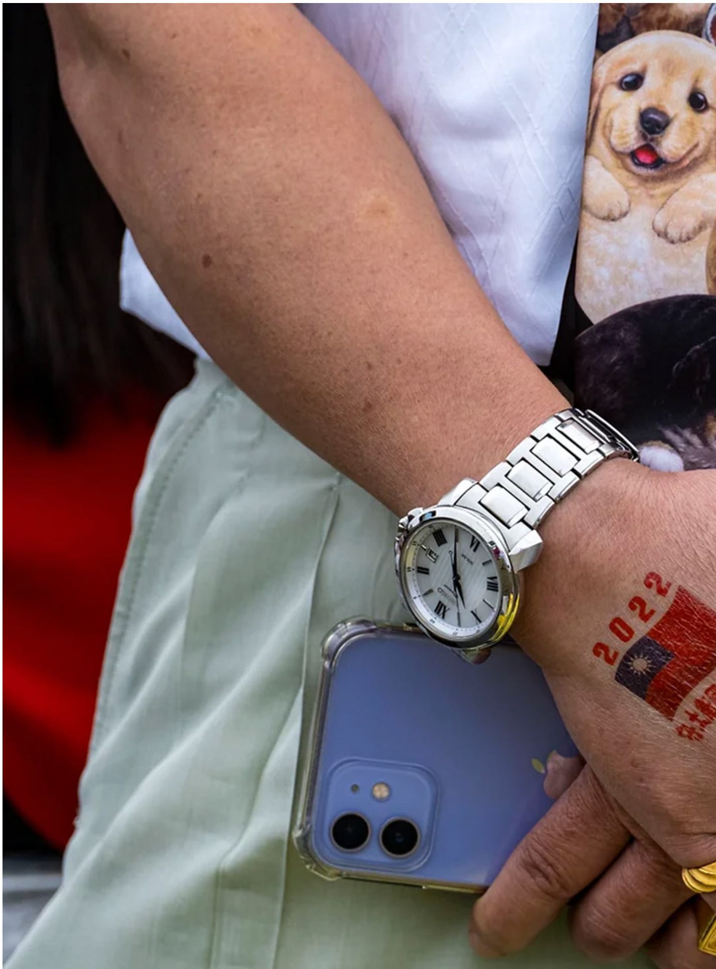
2022年10月10日，双十国庆大会，一名参与者手上印上“护国卫士你我同行”的标语。

即便对和平有所期盼，蔡英文亦持续补充关于国防的谈话，她强调国防力量的重要性，以确保国家安全和主权不受侵犯，并提及了国防预算的增加，以及投资于国防产业和自主防卫的重要性。除此，蔡英文在演说中也着重在民主价值与自由，用以对比出中国的专制政治与独裁体制，随著区域安全环境的变化和外部压力的增加，强化国防力量和保护国家主权成为重要的议题。