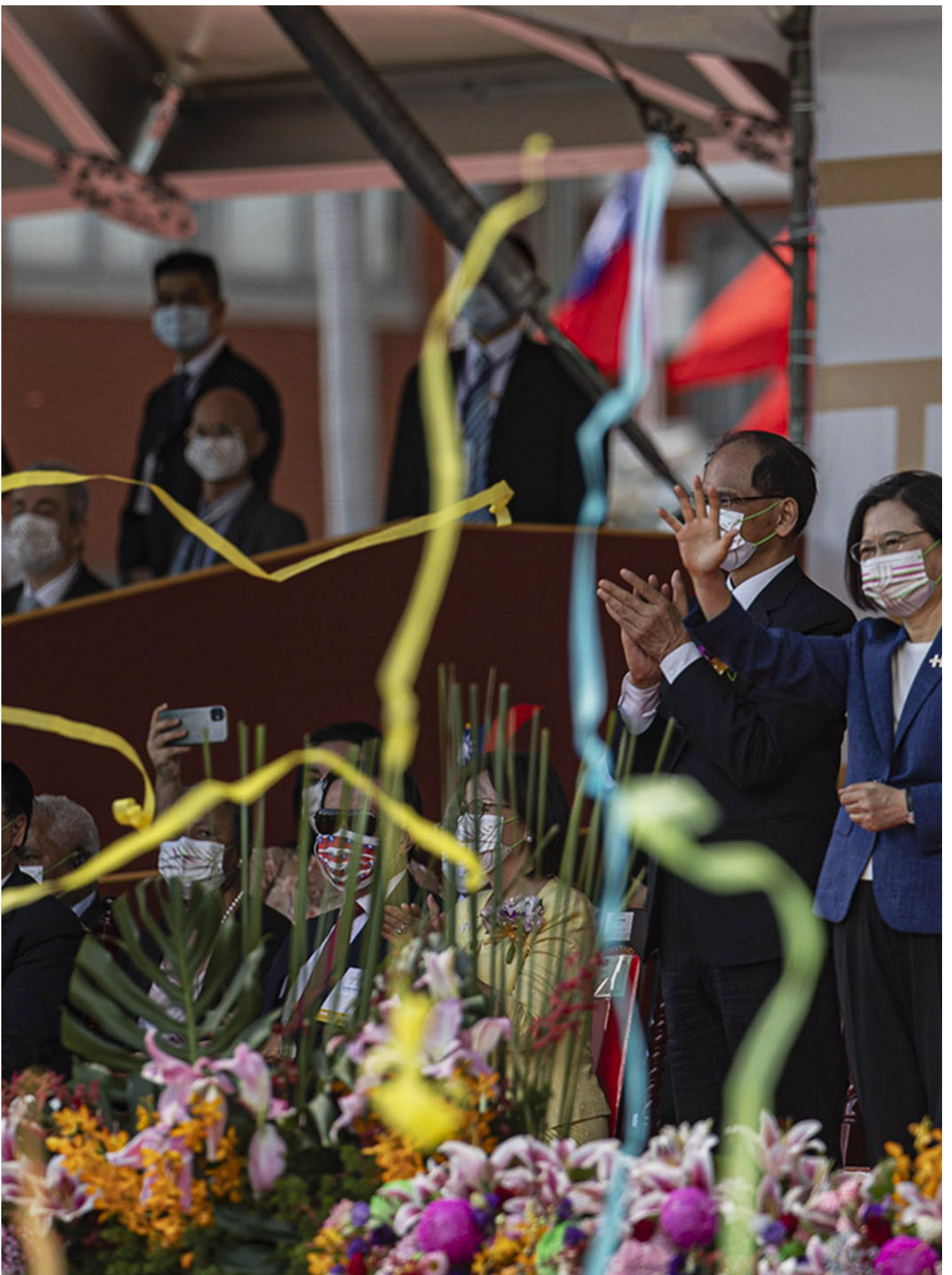
2021年10月10日，台北，总统蔡英文于双十国庆大会发表讲话。