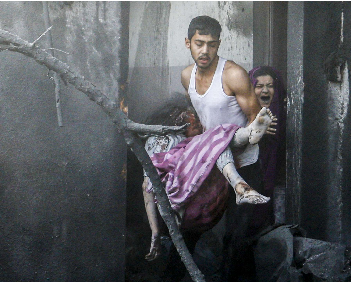
2023年10月11日，加沙地带南部汗尤尼斯，一名巴勒斯坦男子抱著受伤的女孩逃出被以色列袭击的房子。