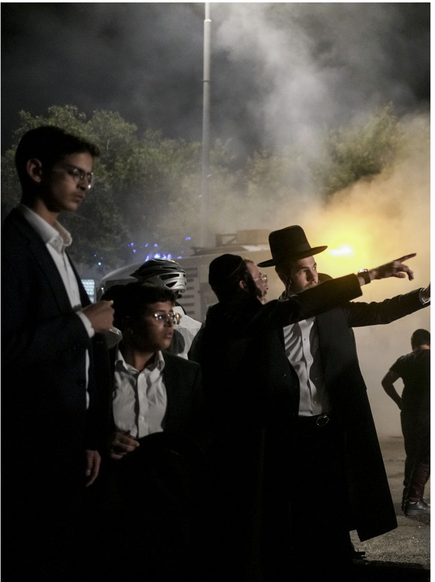
2023年10月9日，从加沙发射的火箭击中以色列后，极端正统犹太男子在贝塔尔伊利特西岸犹太人定居点。