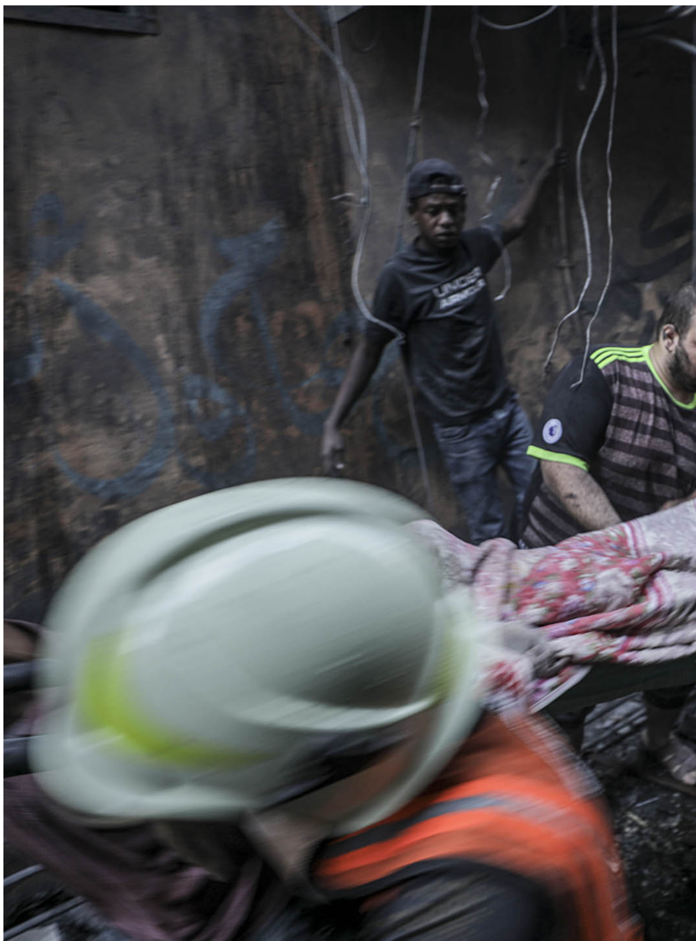
2023年10月12日，加沙走廊西部沙蒂难民营遭以色列火箭袭击，一名伤者从现场被众人抬出。