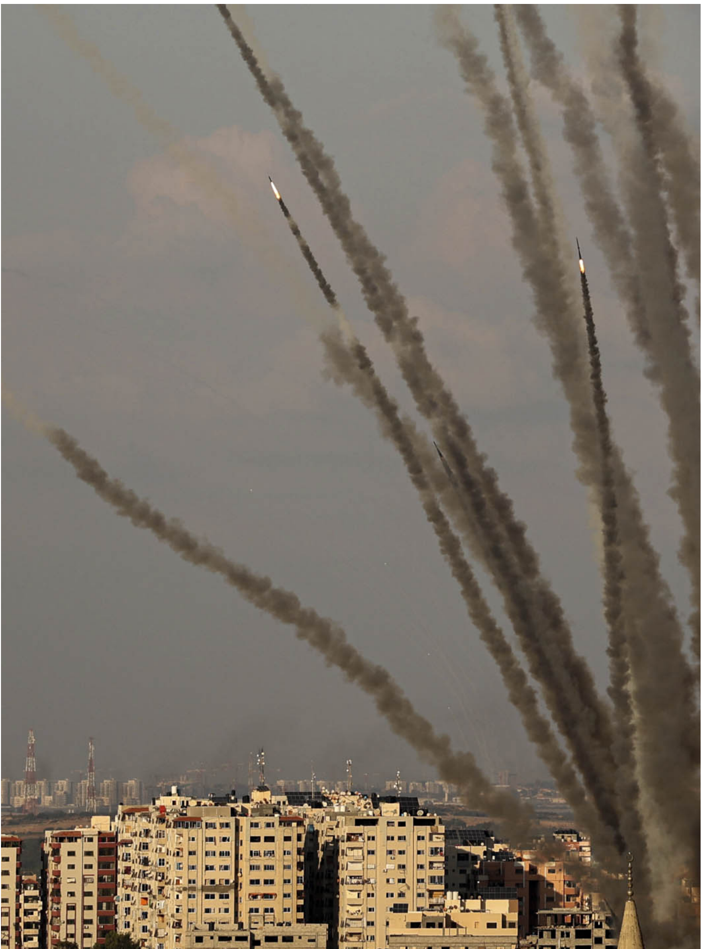
2023年10月7日，巴勒斯坦发射火箭报复以色列对加萨城的空袭。