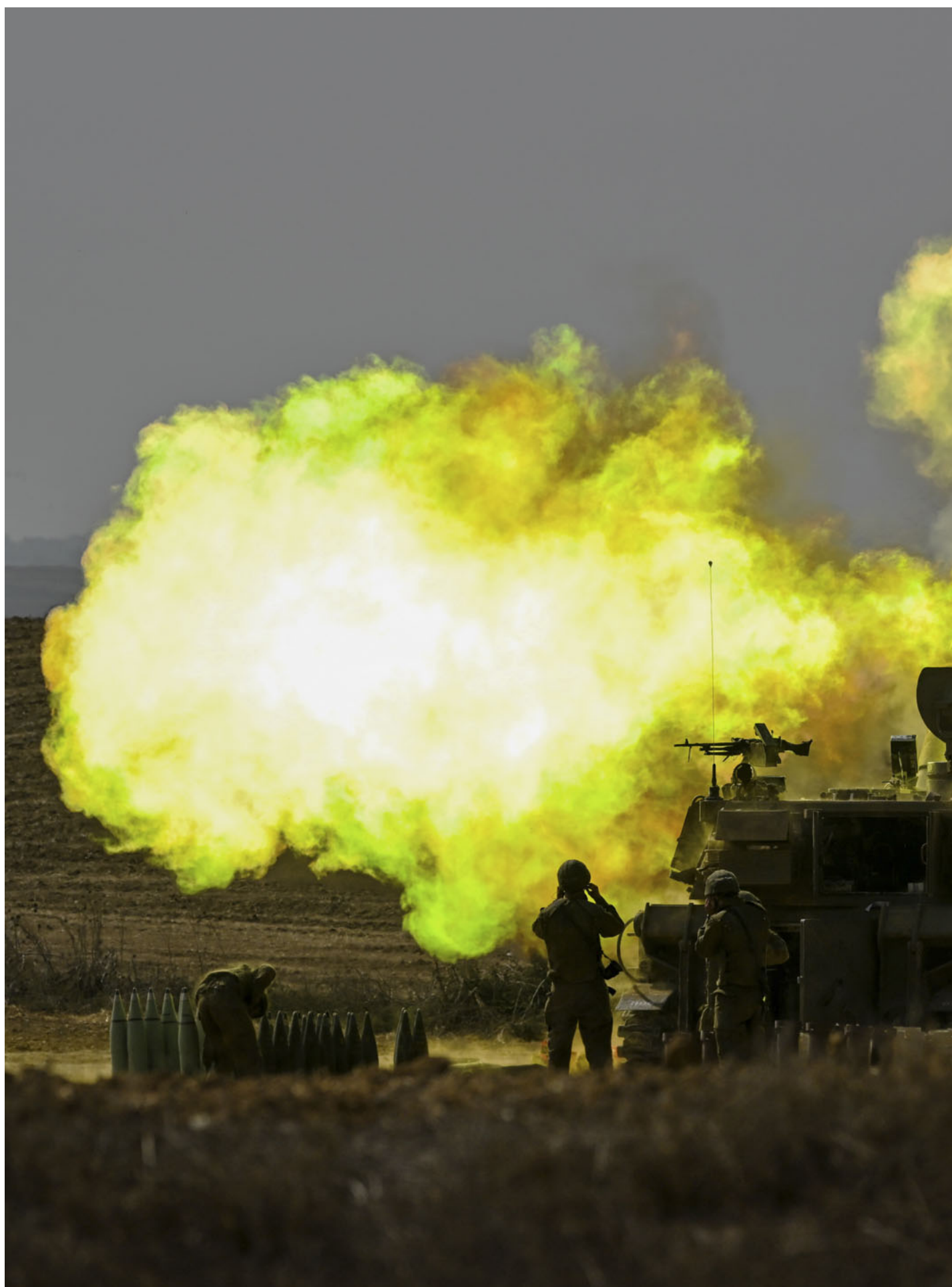
2023年10月11日，以色列内蒂沃特附近，一名以色列国防军炮兵士兵向加沙发射炮弹时捂住耳朵。