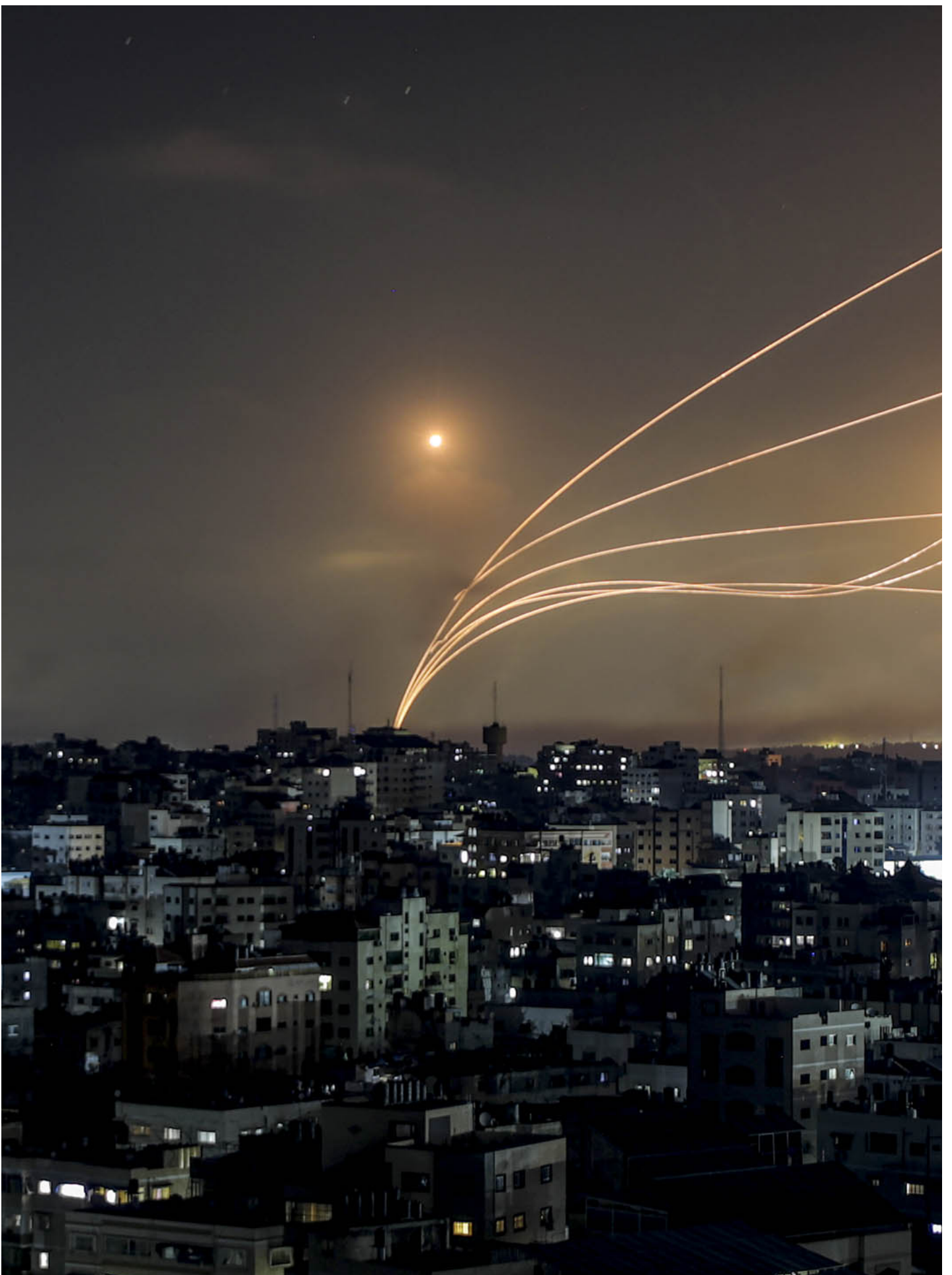
2023年10月11日，以色列铁穹拦截从加沙走廊发射出来的飞弹。