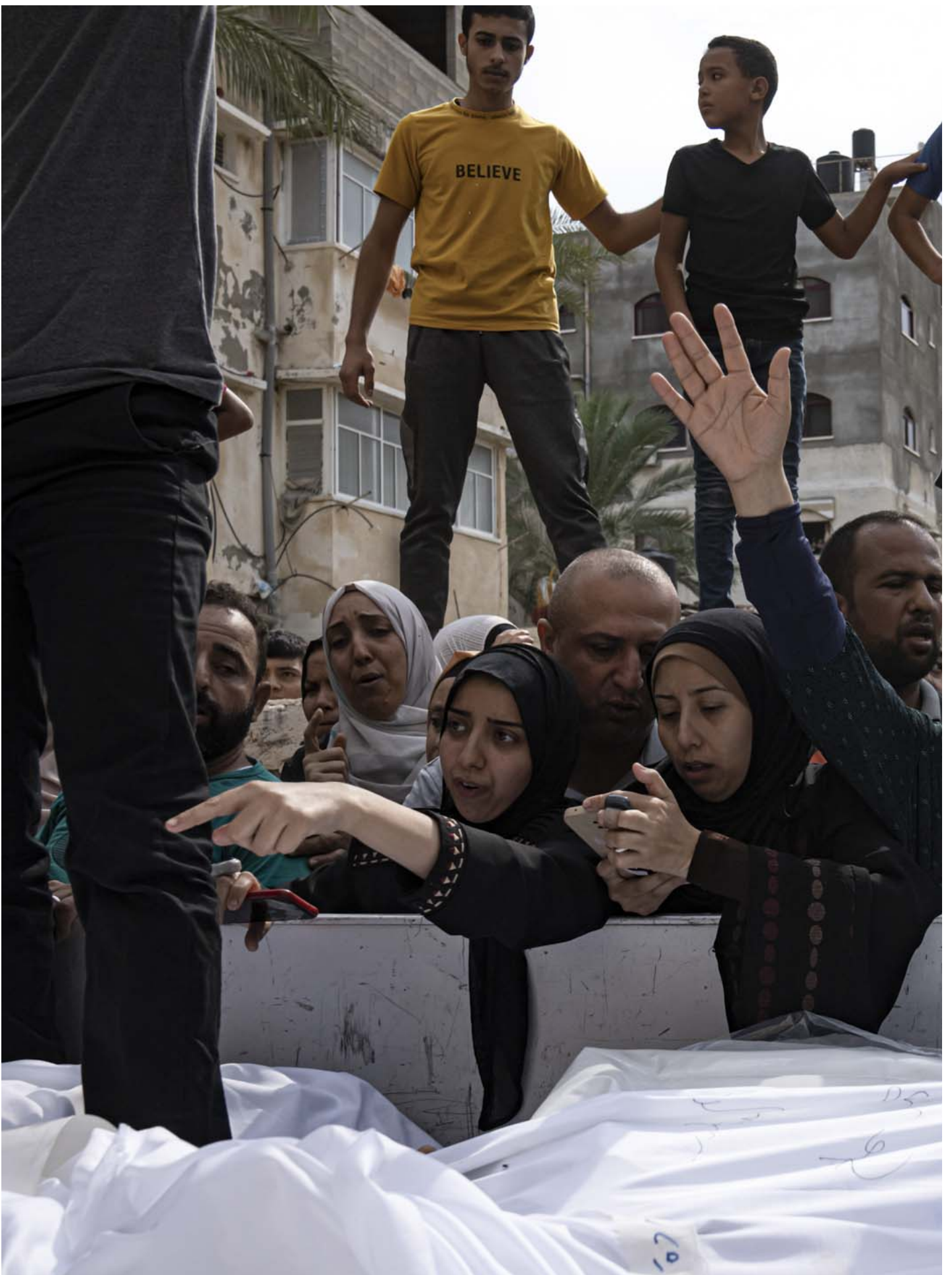
2023年10月9日，以色列对加沙连环空袭后，遇难者的亲属哀悼死者。