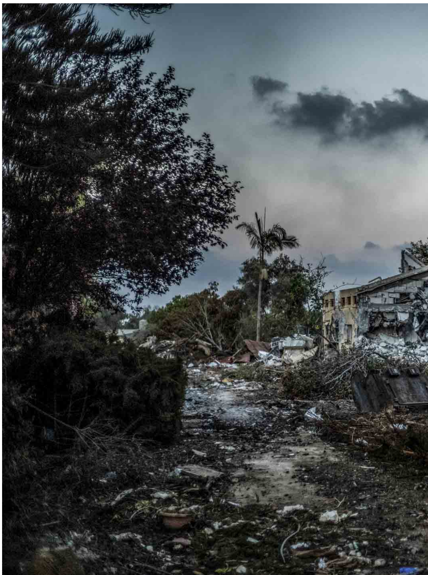
2023年10月11日，以色列贝埃里基布兹遭受加沙袭击后的废墟。