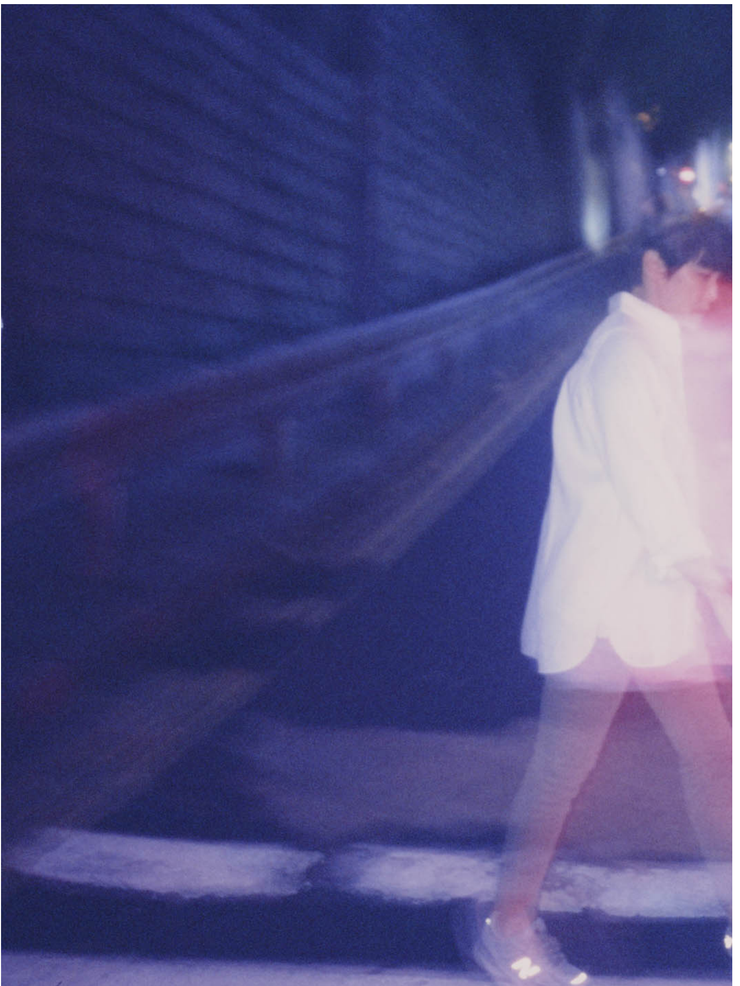
香港歌手何韵诗。