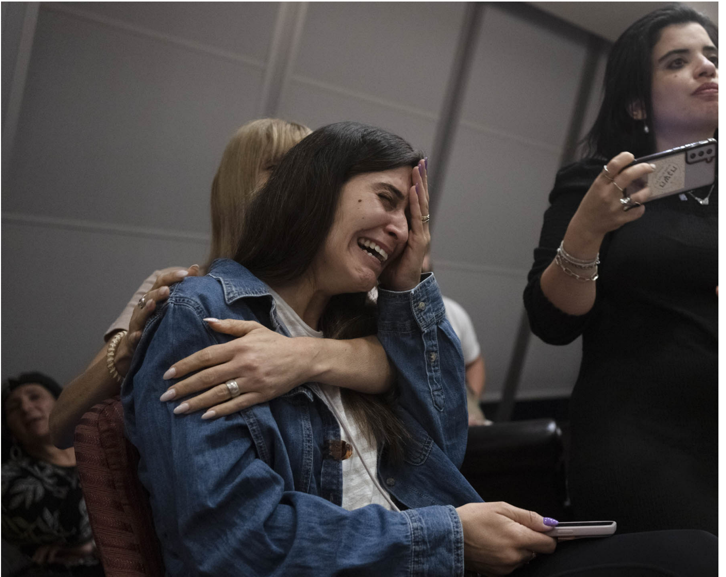
2023年10月8日，以色列拉马特甘，因哈马斯武装分子袭击而举行的记者会现场，一名失踪的以色列人亲属情绪激动。

战争开始前，我在巴勒斯坦西岸经历了突发的催泪弹投掷事件。接著，无预警的战争开始了。