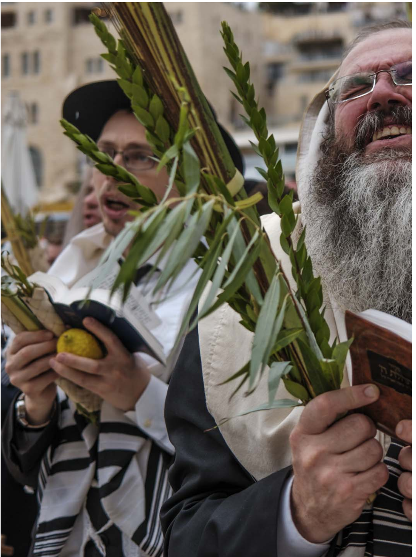
2023年10月4日，耶路撒冷的住棚节期间，一位极端正统的犹太人在西墙的牧师在进行祈祷仪式。