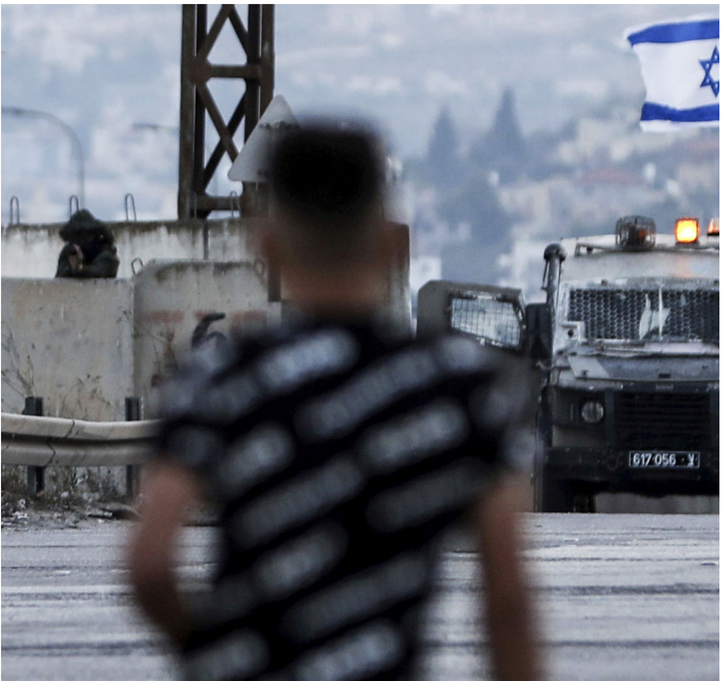
2023年10月8日，巴勒斯坦胡拉，在约旦河西岸的冲突中，一名巴勒斯坦年轻人站在以色列安全部队面前。

自从哈马斯10月6日周五凌晨开始袭击以来，以色列警方已关闭巴勒斯坦人进入耶路撒冷的过境点，即巴勒斯坦人被禁止从约旦河西岸通过检查哨进入耶路撒冷。巴人在这块土地持续面临著行动限制，长年被视为二等公民，而控制巴勒斯坦人行动的检查哨一直是各方争论的重点。这样针对性地长期对巴勒斯坦人限制行动，虽然某方面也是为了牵制哈马斯，但同时影响了所有滞留于巴勒斯坦西岸与以色列境内巴勒斯坦人的生活，让他们难以正常工作，甚至难以与家人团聚。这样的政策似乎也间接让巴勒斯坦人离开耶路撒冷。