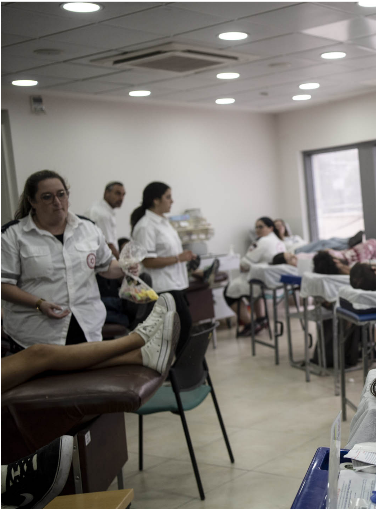
2023年10月7日，哈马斯武装分子对以色列发动史无前例的袭击，以色列人在耶路撒冷一个捐血站捐血。

当天傍晚，为了采买一些杂货，我决定前往东耶路撒冷的超市一趟。在安息日期间，西耶路撒冷像一座空城，没有任何店家营业，所有大众运输工具都停驶了。也因为不断的空袭，城内的氛围更加死寂与紧绷，连计程车都鲜少看到。走在路上，仅能看见警车与军人来回巡视，滴水不漏的监控著街上所有人的一举一动；而居民也用自己的方式武装自己，深怕另一场攻击又无预警地展开。