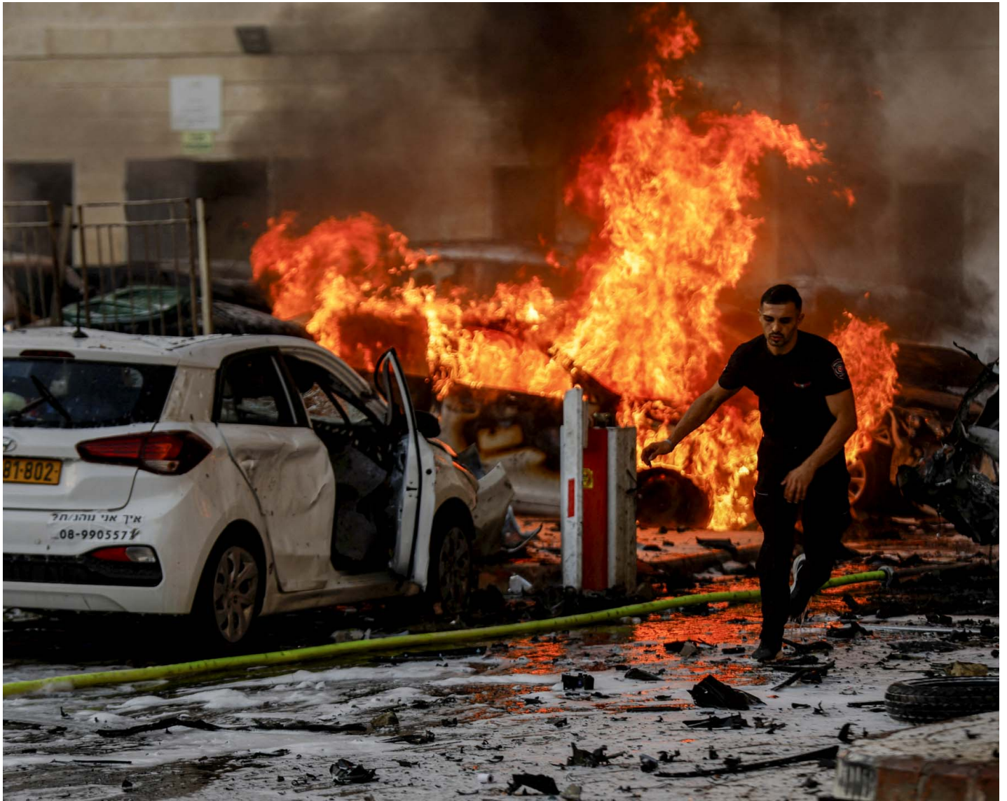
2023年10月7日，巴勒斯坦武裝組織哈馬斯 (Hamas) 宣布新軍事行動，以色列城市 Ashkelon 被從加薩地帶發射的炮彈空襲，汽車燃燒，一名男子在道路上奔跑。

近年來，以色列的政治長期由保守派控制。對巴勒斯坦人不妥協的聲量日益增大，雙方衝突越發激烈。