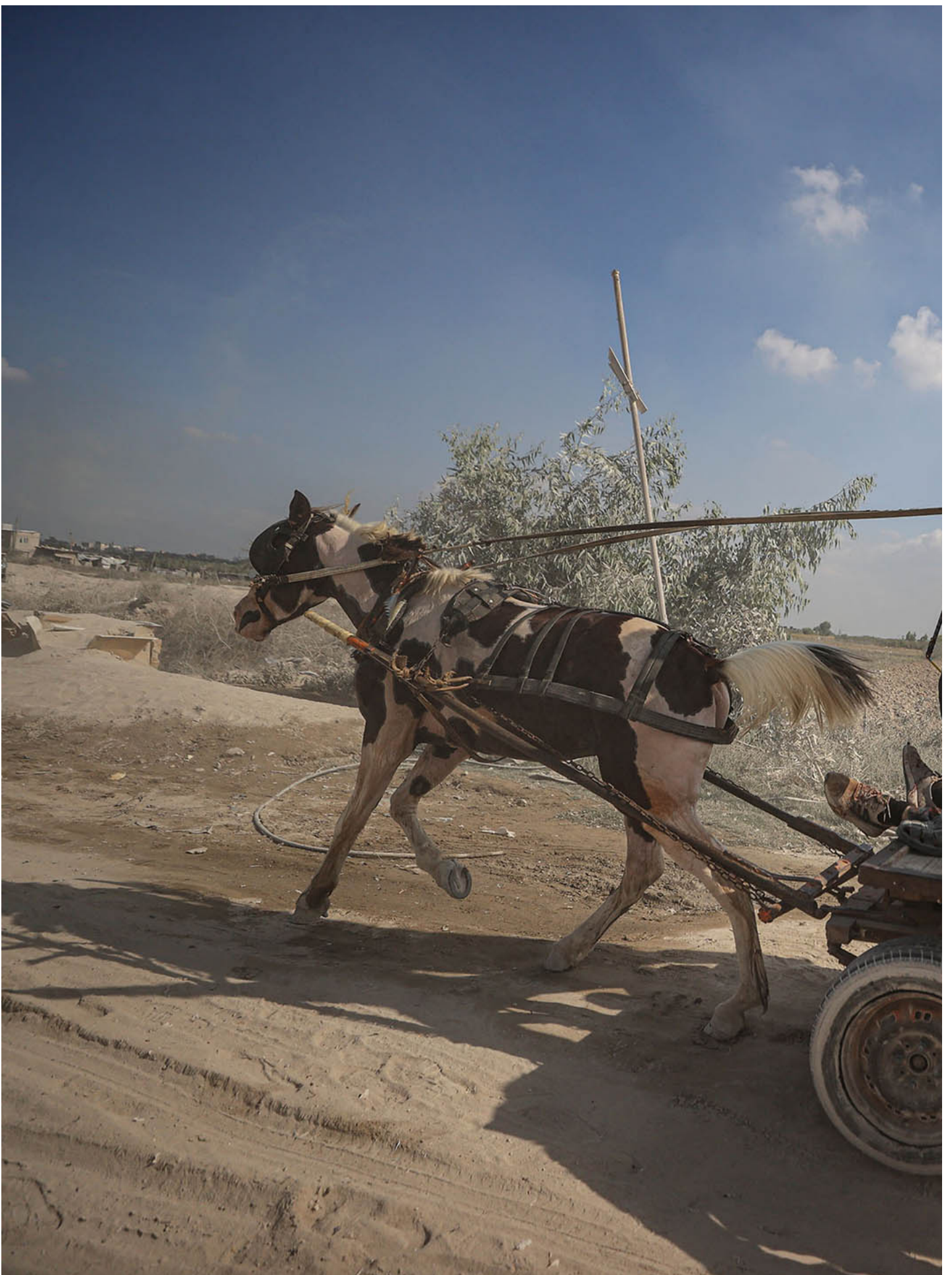
2023年10月7日，哈馬斯軍事派別卡薩姆旅的成員在加薩和以色列邊境的衝突中，傷者被帶離並送往以色列。

法塔赫控制的約旦河西岸地區是以色列定居點計劃的重點。2022年開始，以色列一直在對包括傑寧（Jenin）在內的巴勒斯坦抵抗運動開展軍事攻擊，以期削弱對方。2022年，共有150名巴勒斯坦人在以色列佔領軍的襲擊中喪生，其中包括國際知名記者夏琳·阿布·阿克萊赫（Shireen Abu Akleh）。2023年開始，局勢進一步升級，2月22日，以色列在對納布盧斯的軍事行動中打死了11名巴勒斯坦人，造成100多人受傷。法塔赫因此宣布停止與以色列的安全合作。