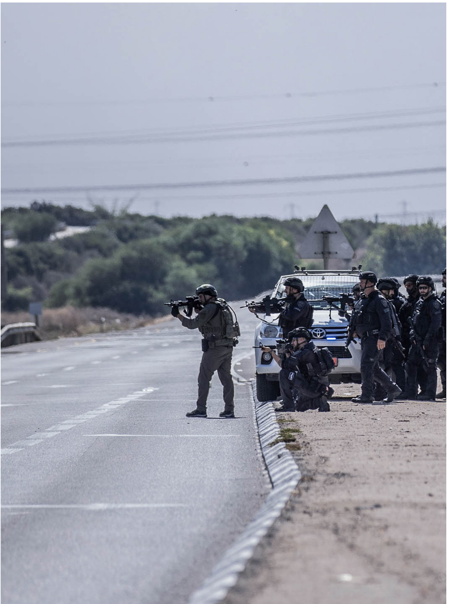
2023年10月7日，以色列阿什凱隆，以色列軍隊關閉了部分道路。

以色列媒體多數將攻擊稱為「恐怖襲擊」。總理內塔尼亞胡（台譯：納坦雅胡）則在哈馬斯突襲後發布聲明稱以色列已經處於戰爭狀態。「我們在開戰，不是軍事行動，是戰爭。」他宣布空襲加沙地區並動員預備役軍人。以色列軍方則表示哈馬斯方面已經向以色列發射了2500枚火箭彈。