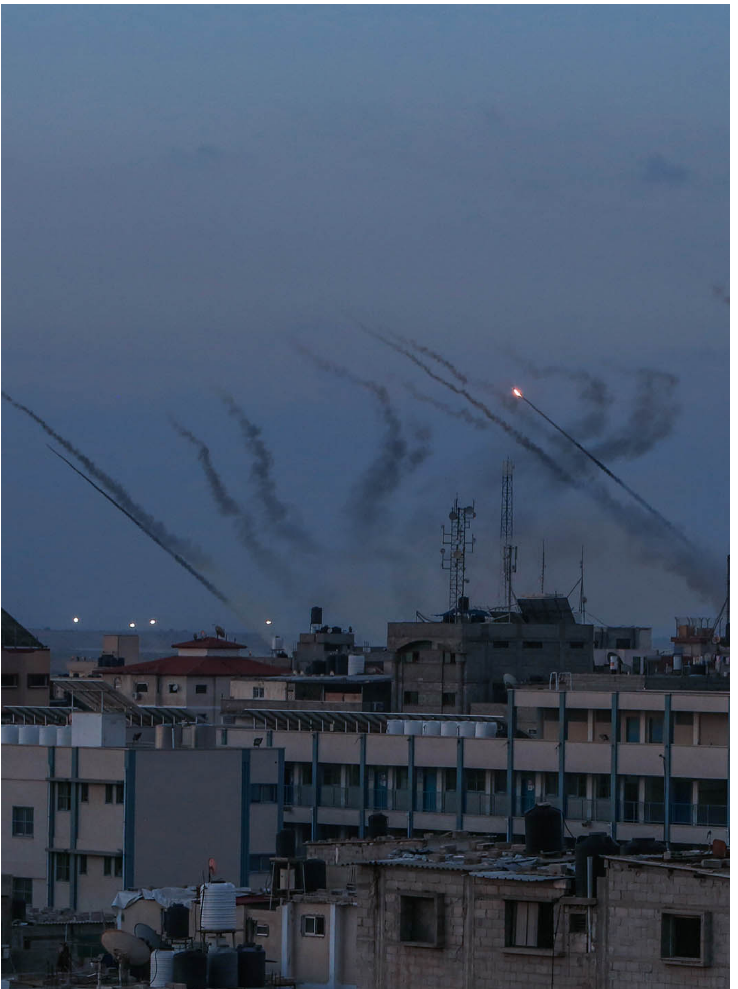
2023年10月7日，加薩加沙城的一次行動中，巴勒斯坦向以色列發射的炮彈。