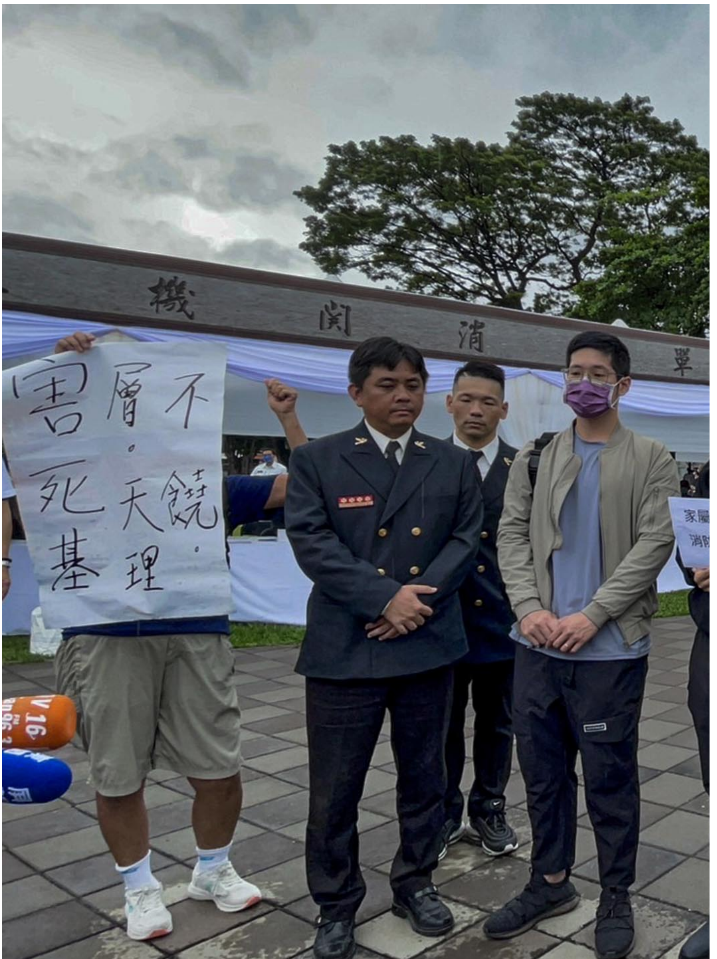
2023年10月6日，屏東，四名殉職消防員的家屬與消防員工作權益促進協會的成員在會場外召開記者會。

消促會秘書長陳彥凱在記者會上表示，2021年彰化喬友防疫旅館發生火警，造成一名消防員殉職，當時消促會便呼籲讓家屬參與災害事故調查會機制。如今又發生大火導致消防員殉職，屏東縣政府卻至今未向家屬說明事發經過，他們要求縣府儘速釐清事故真相。