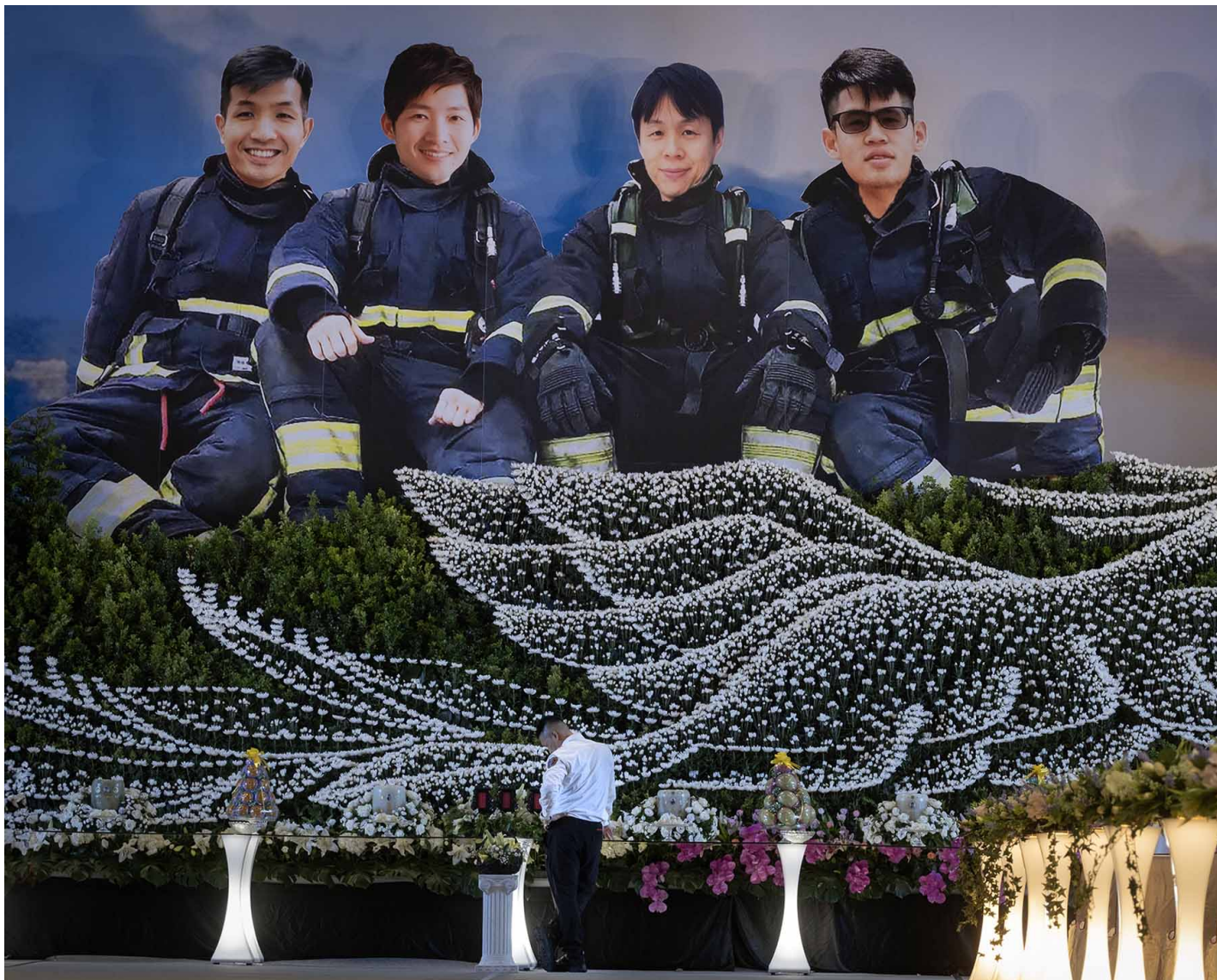
2023年10月4日，屏東，四位殉職消防員移靈至屏東縣立體育館。