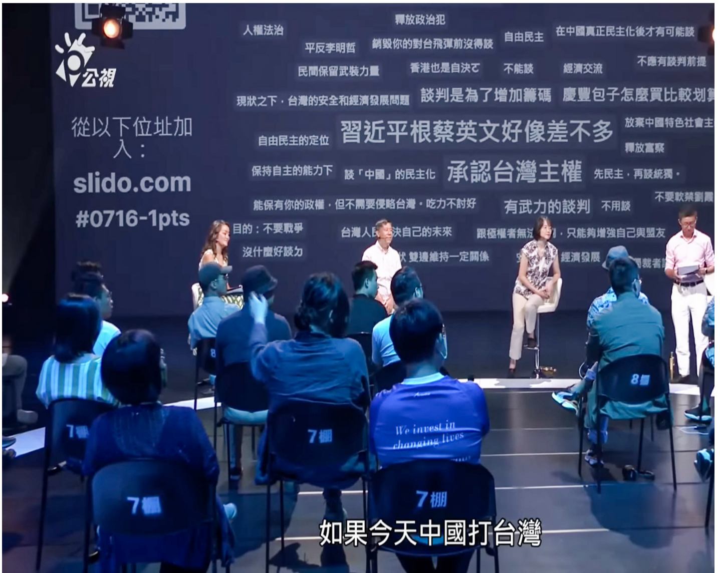
《公视主题之夜SHOW》于9月份推出一系列4集“战争系列”的公民论坛。

今年3月下旬，四名学者发表一份《反战声明》，后续也引发网路论争，形成反战派与备战派的线上辩论。