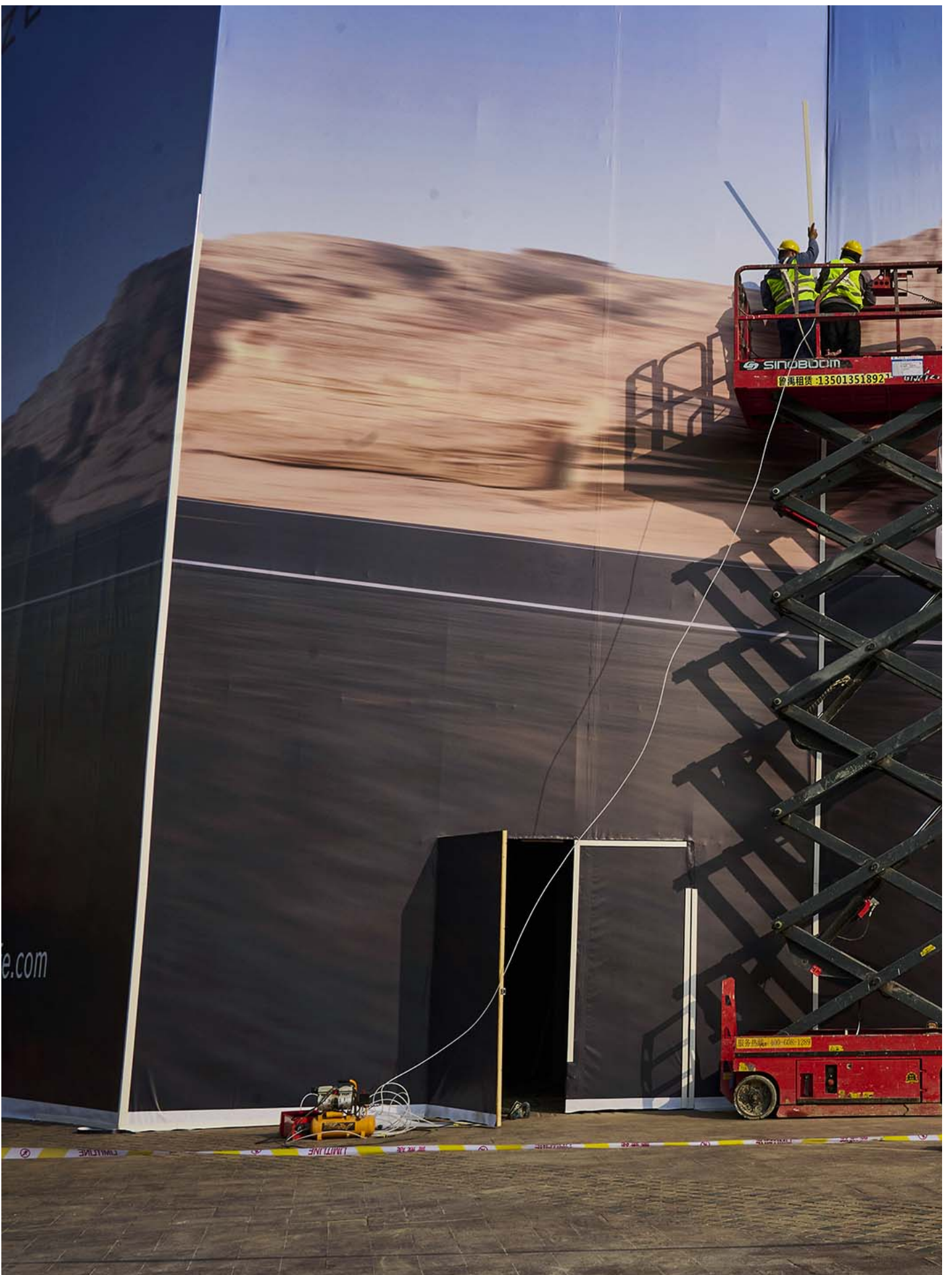
2023年3月31日，北京，工人们为中国电动车制造商安装一块大型广告牌。

此前的9月13日，欧盟委员会主席冯德莱恩（Ursula von der Leyen）在向欧洲议会发表年度演说时提出，欧盟将调查中国电动汽车是否受益于补贴并因此以更便宜的价格出口到欧盟。未来有机会考虑向中国电动车征收惩罚性关税。