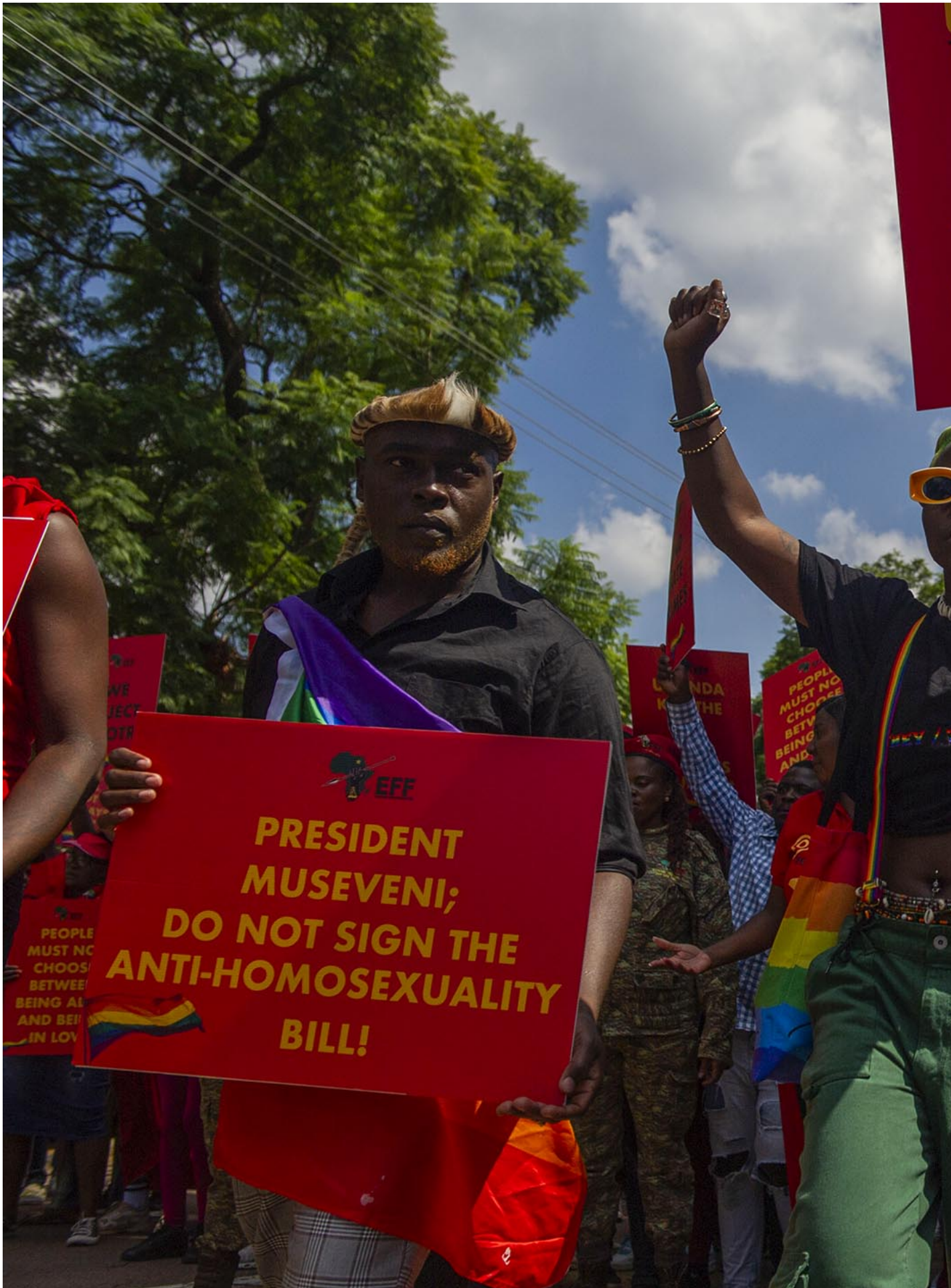
2023年4月4日，南非，一场反对乌干达反同性恋法案的游行。

很多同性恋者仍然在生活，而Ta们仍然需要一切，仍然需要食物、教育、社区等，但这些服务现在也走向低调。服务提供者仍然提供服务，但不通过明显的公开渠道。对我来说这是了不起的抵抗方式，因为我们不能面对政府的霸凌就屈服。