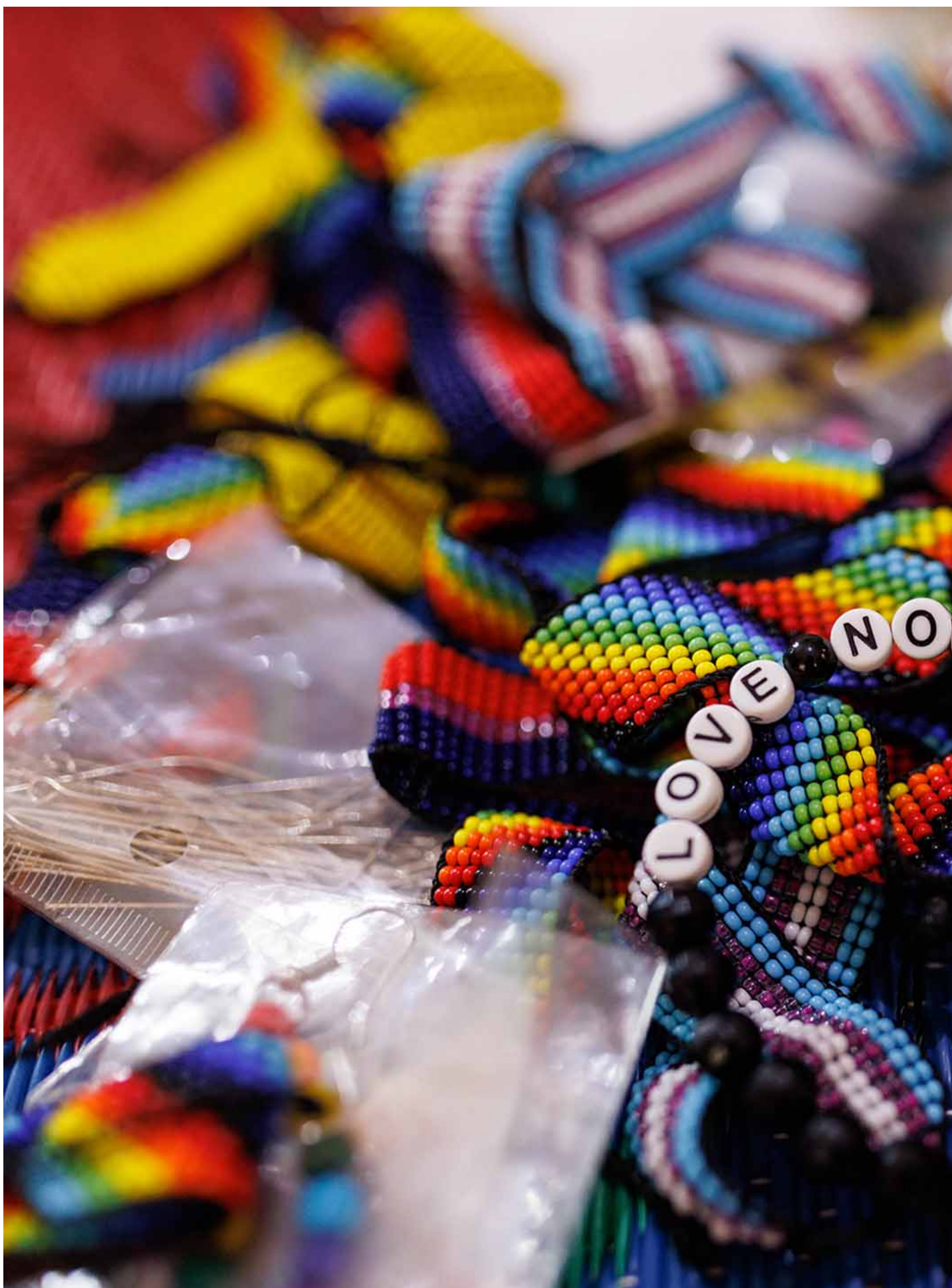
2023年4月24日，乌干达康培拉，一名女同性恋者制作首饰出售。

还有一个问题就是对白人的崇拜。类似“中国人和印度人非常富有”的刻板印象也非常多。而对某些人来说黑人是“不如白人”的，我们看到这种种族等级制度仍存在于乌干达，人们认为要文明就要像白人一样。如果你想向前走，就要看向东方或西方，而不是回头看自己的家乡。