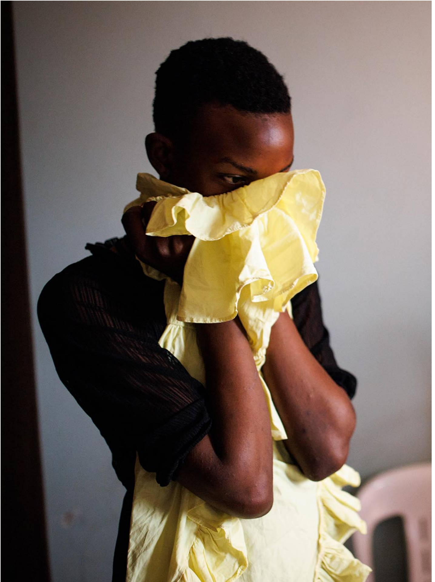
2023年4月23日，乌干达康培拉，一名跨性别女性在参加教会礼拜前挑选衣服。

作为泛非洲主义者，我一直告诉人们，我们必须反对歧视非洲同性恋者。他们既是非洲人，而且自豪地是非洲人，但同时也是同性恋者，Ta们并非来自任何西方国家。所有这些围绕著国家主权、帝国主义、西方通过人权论述的支配等等而形成的地缘政治问题，也是不同的非洲国家如何定位自己是否通过反同性恋法律的原因。