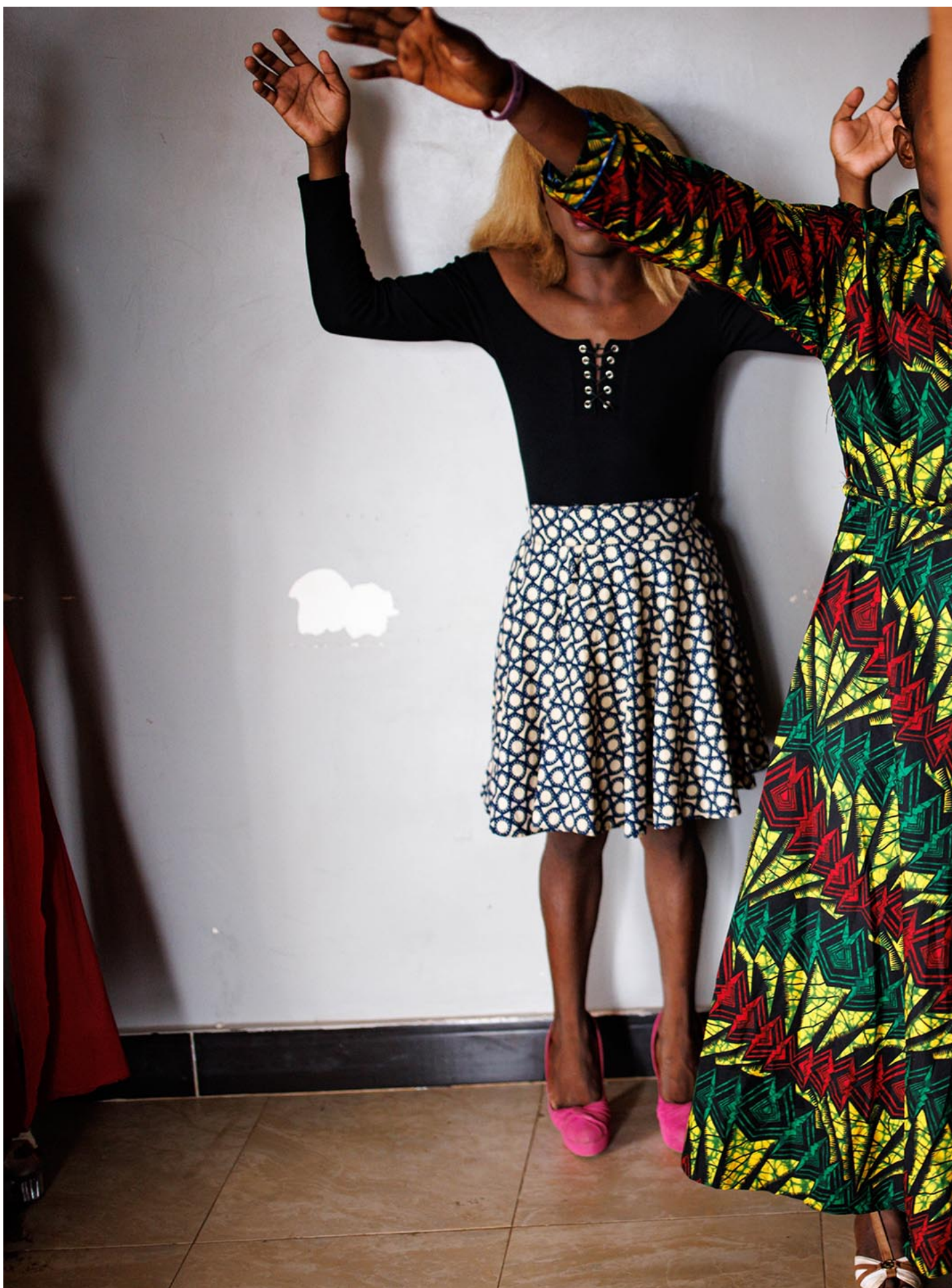
2023年4月23日，乌干达康培拉，跨性别女性参加教会礼拜。

新的反同法律使得“宣扬同性恋观念”可能被判处20年监禁。女性主义者生产的并不一定是同性恋知识，而是女性主义知识，但也可能被攻击为宣传同性恋。我认为这一切都很重要，教育、资讯、结盟、施加外部压力、法院请愿都是重要的抵抗形式。