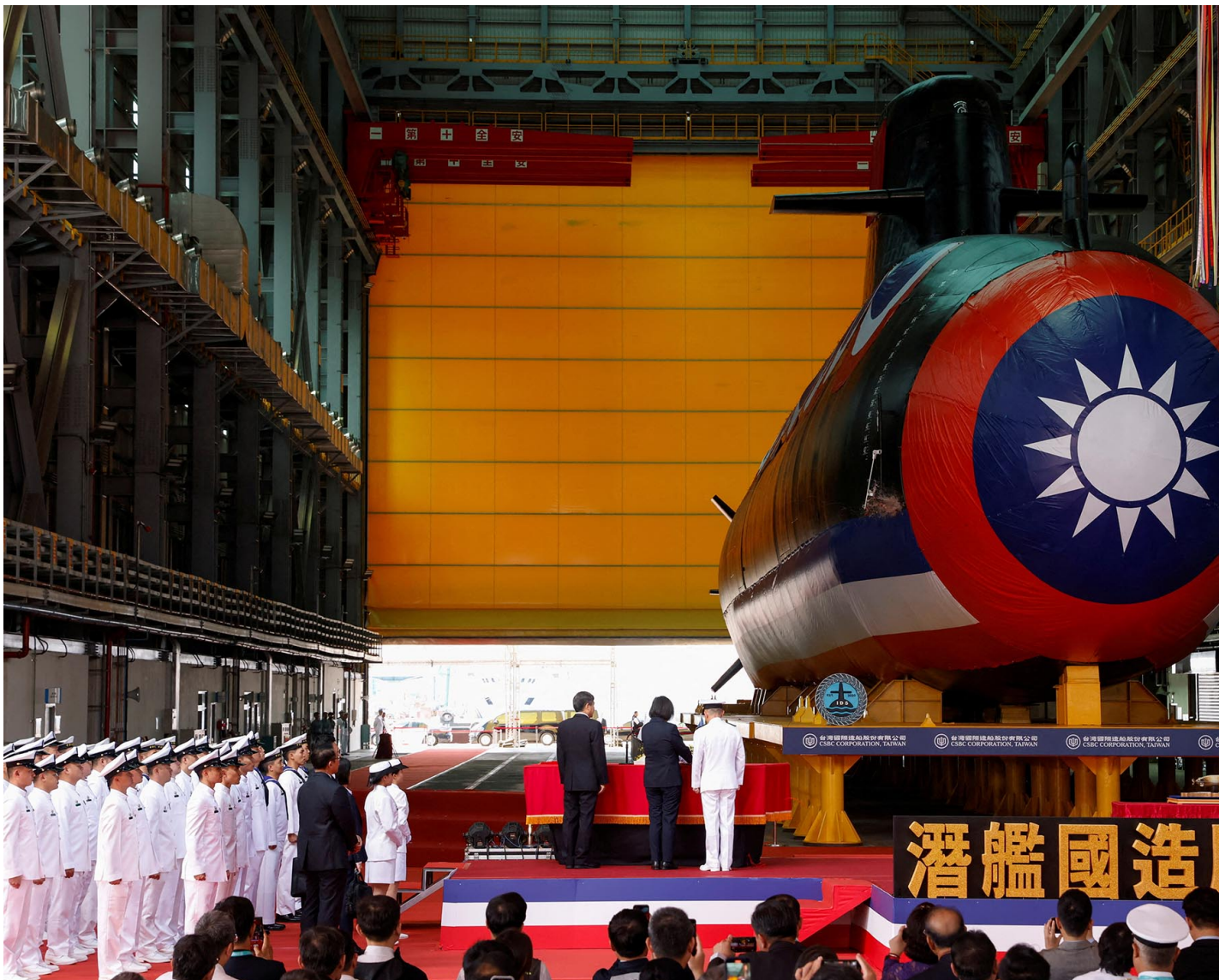
2023年9月28日，高雄，台湾第一艘国造潜艇“海鲲号”下水仪式。

后续潜舰是否建造、如何建造，关键在于原型舰的海试阶段会发现什么缺失，能够如何改正。