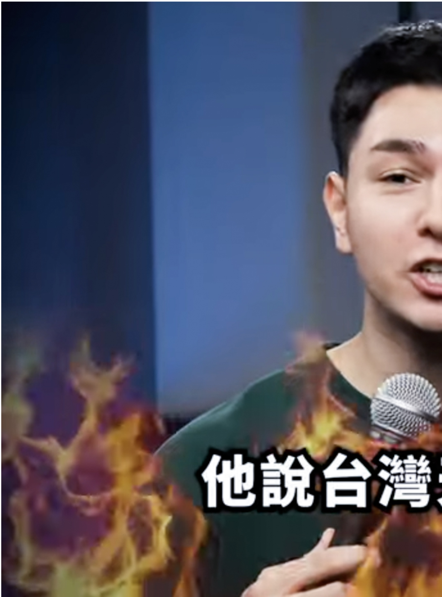
錫蘭Ceylan的Youtube影片。

對此，錫蘭指出是台媒在涉及他的報導中，經常忽視其為比利時籍的事實，僅因在中國大陸成長、生活的身份能引起台灣讀者情緒，便在報導中被強調，導致不熟悉其頻道長期語言風格的觀眾形成「一位具中國生活經歷的網紅惡言批評台灣」的印象，令來自社群平台的攻擊言論更加氾濫。