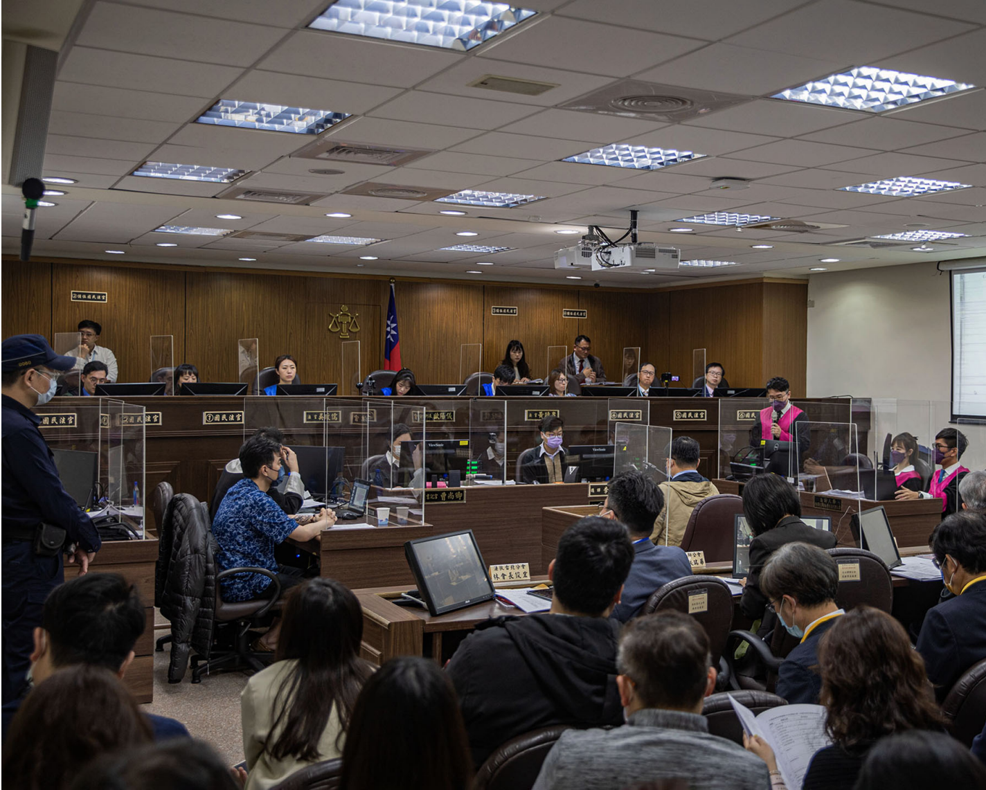
2022年3月24日，臺北地方法院，一場國民法官的模擬法庭。