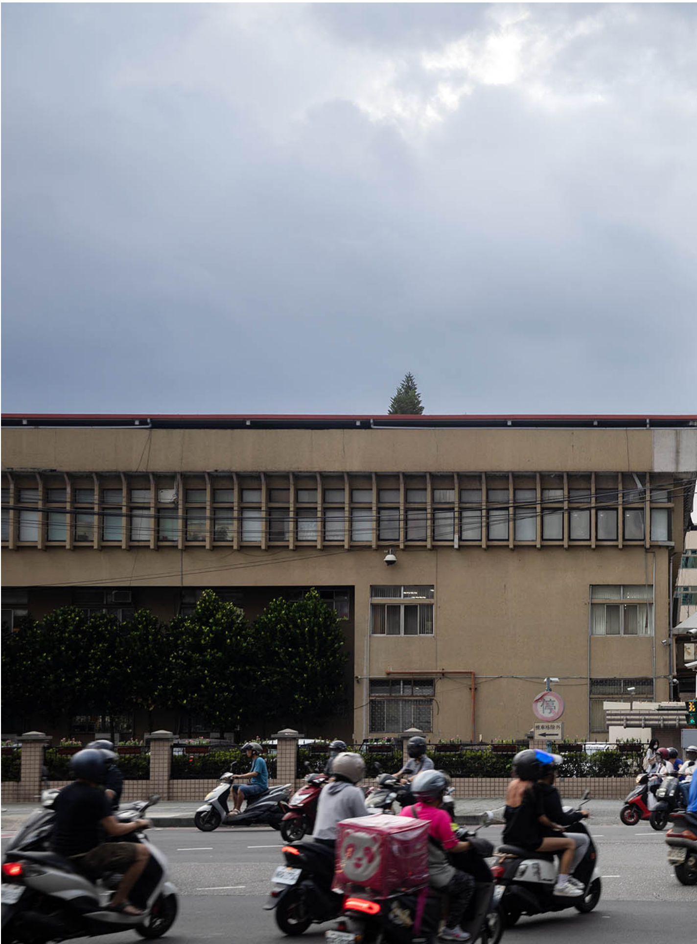
2023年7月21日，臺灣新北地方法院。

許宗力說，司法院正研議如何協助半官方的法扶基金會，在法扶律師團隊中，以專門承接國民法官案件的「任務編組」方式，強化辯護能力，進而使檢辯實力對等。