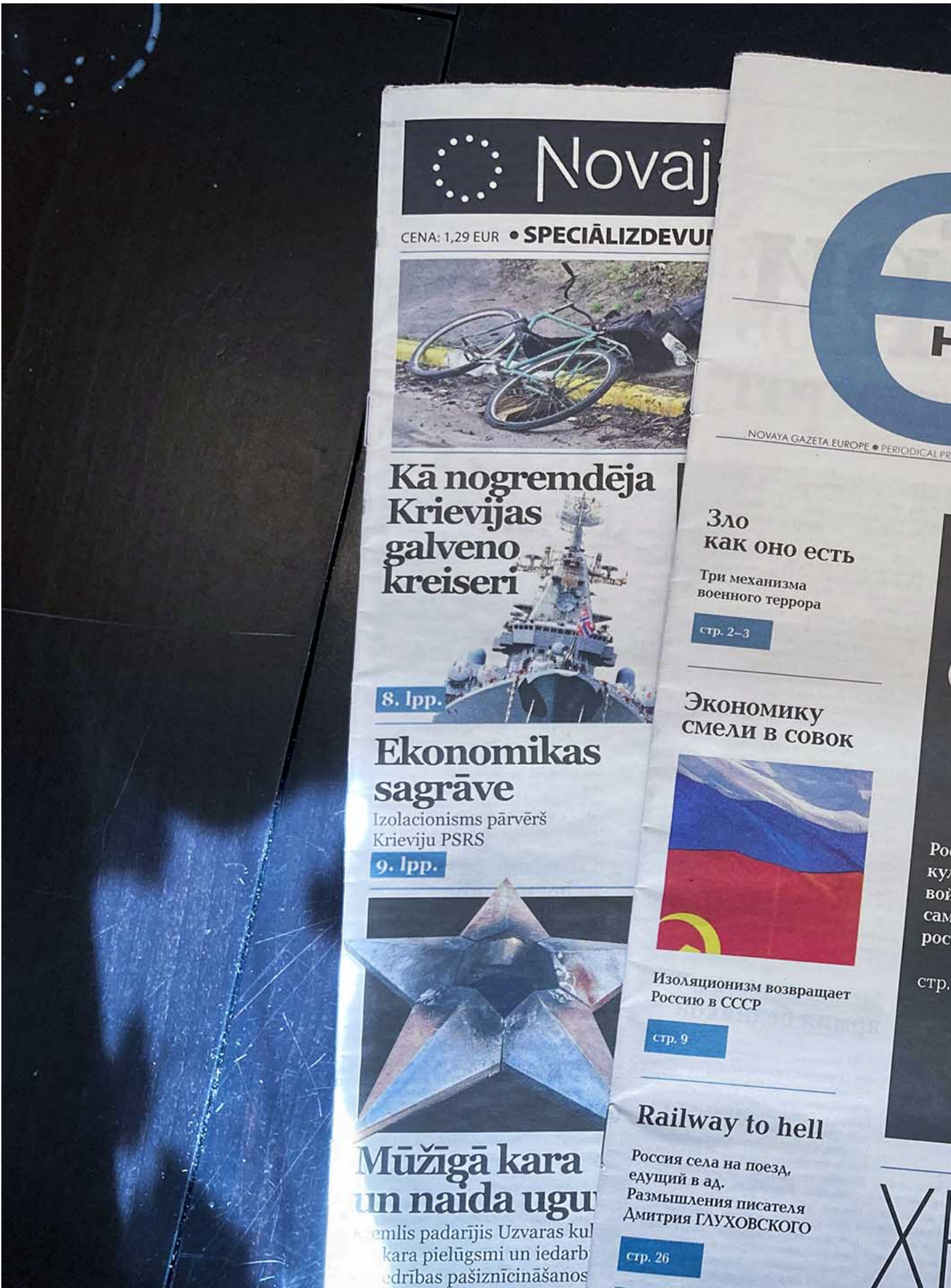
2022年5月6日，拉脫維亞版和俄羅斯版的《Novaya Gazeta. Europe》放在桌子上。