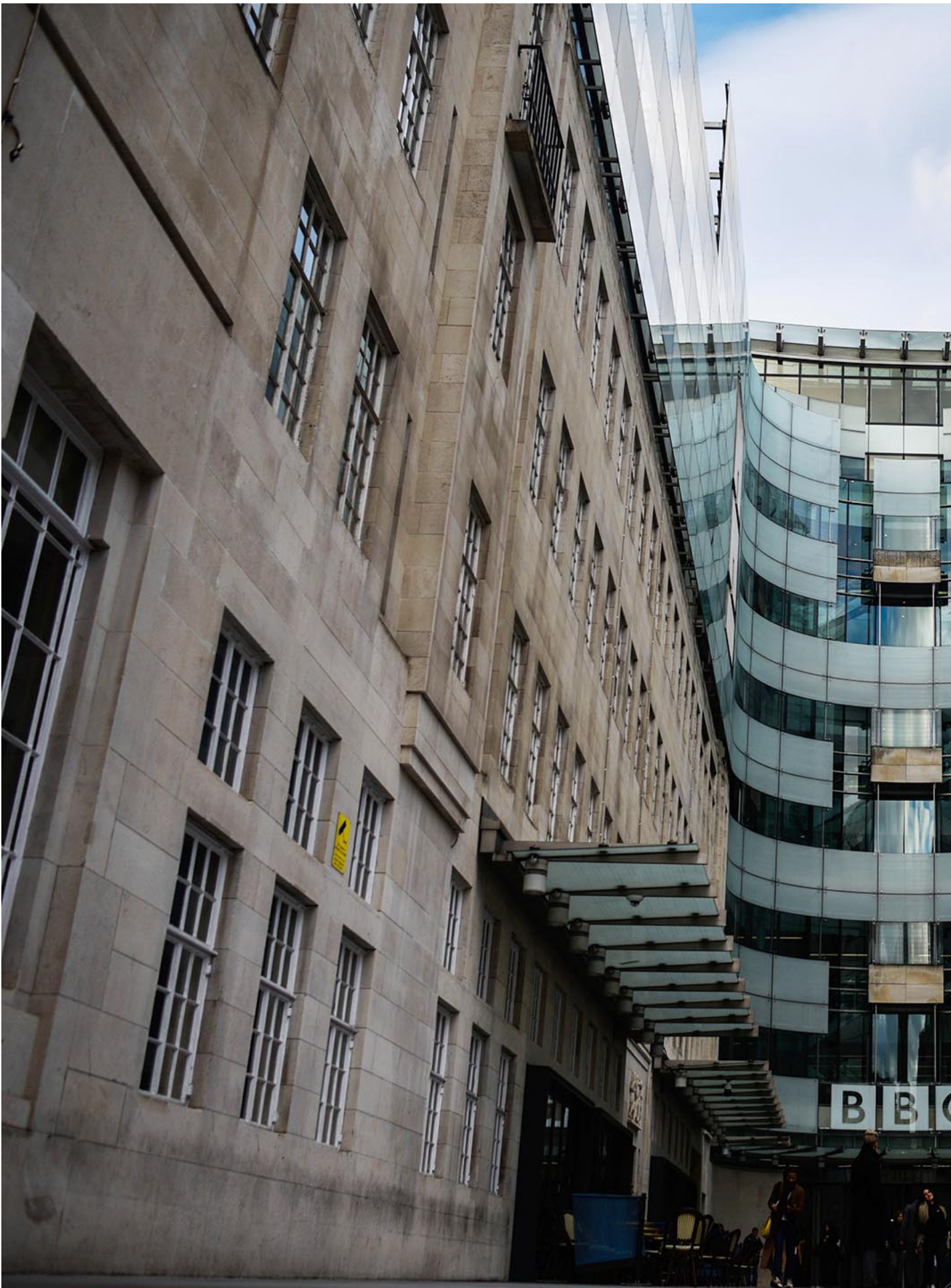
2020年1月29日，英國倫敦BBC廣播大樓。