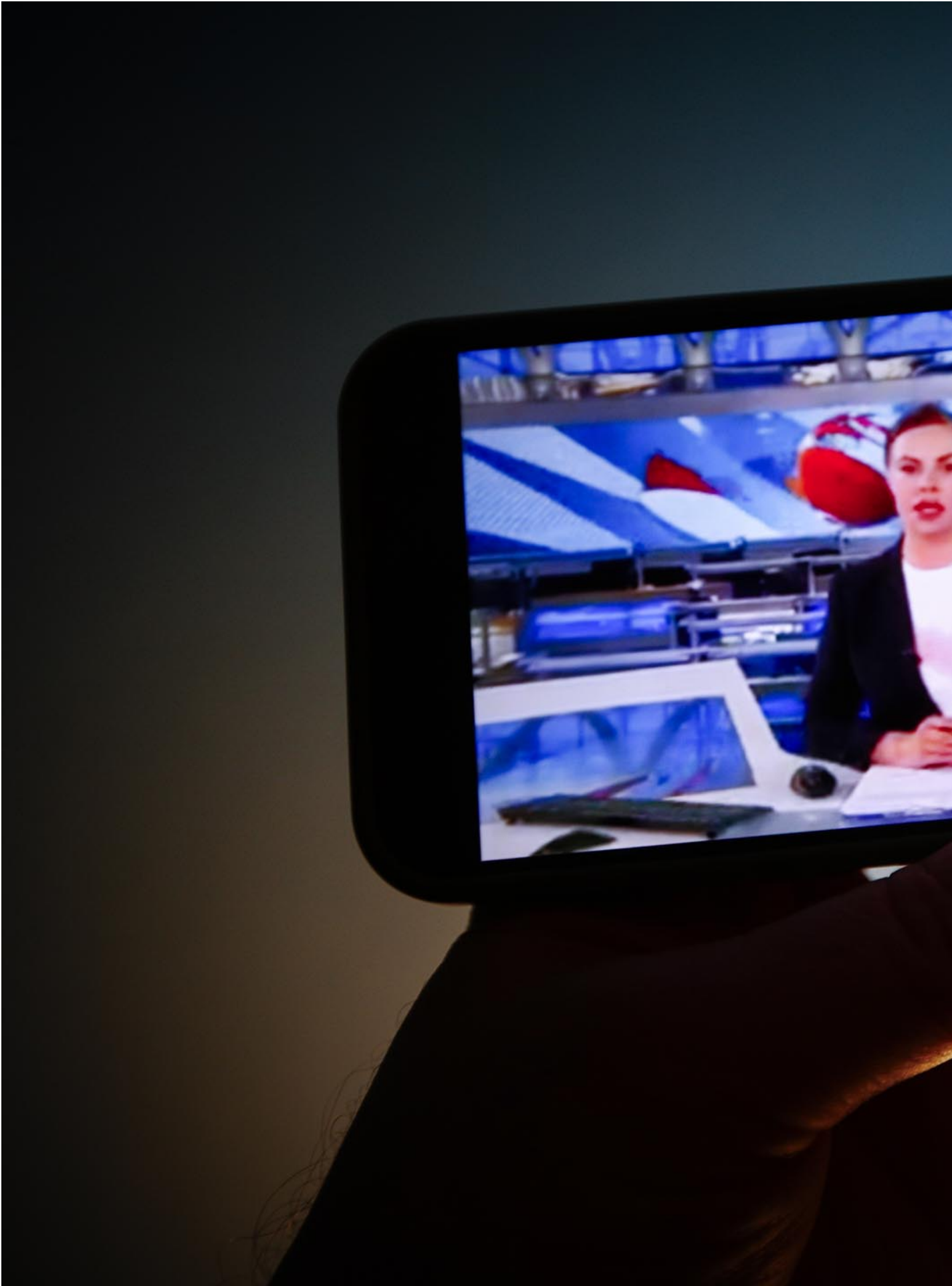
2022年3月15日，俄羅斯主要新聞頻道的晚間新聞在手機上播出，節目被一名抗議烏克蘭戰爭的婦女打斷。