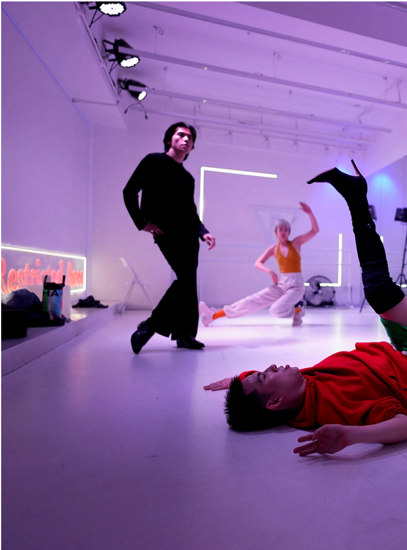
2023年5月13日，中國上海，酷兒正在為演出前熱身。