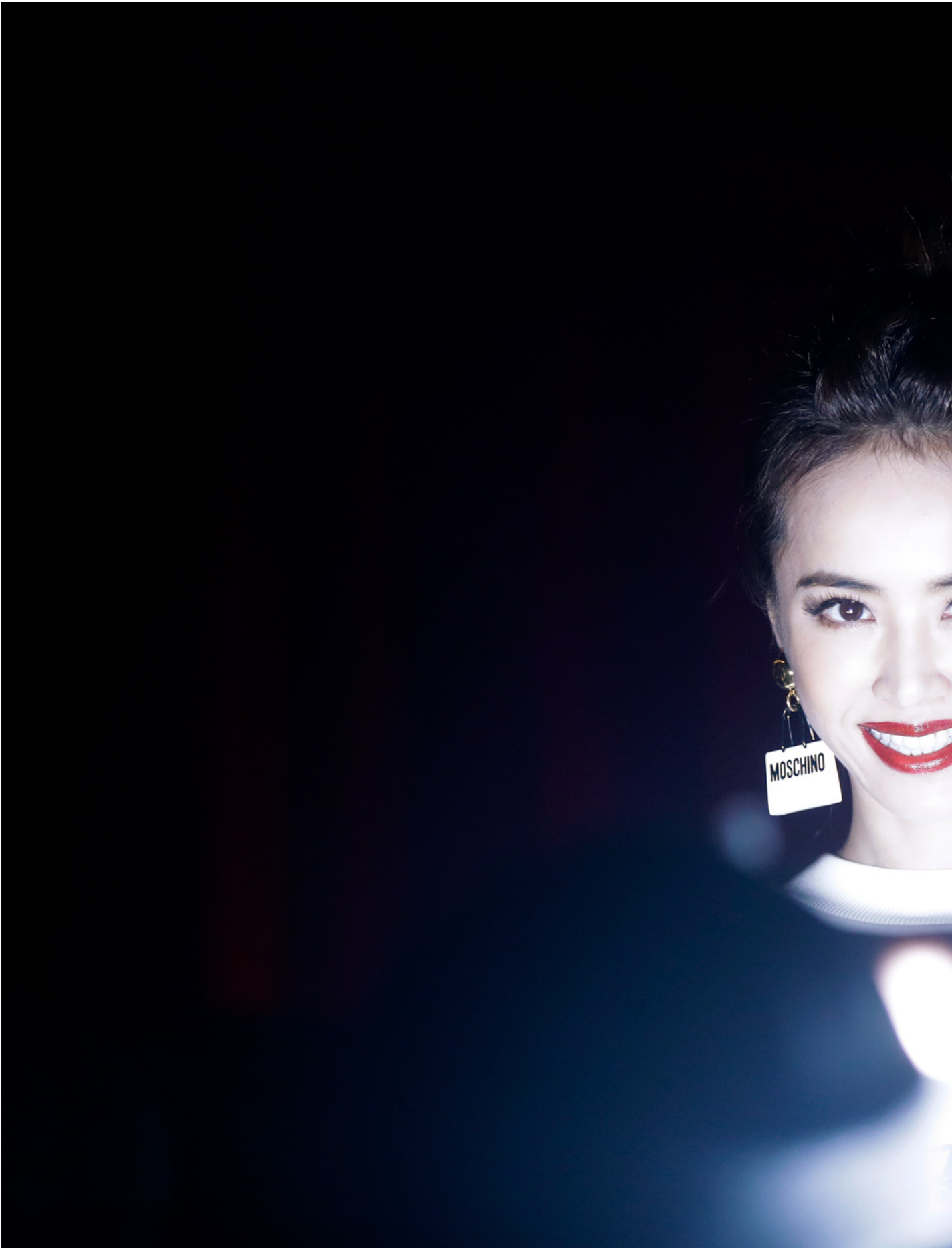
2017年2月23日，意大利，台灣歌手蔡依林出席活動。

從噤聲的社會組織、被舉報的星巴克彩虹杯，到演唱會裏不再出現的《玫瑰少年》，中國酷兒空間再度收縮。