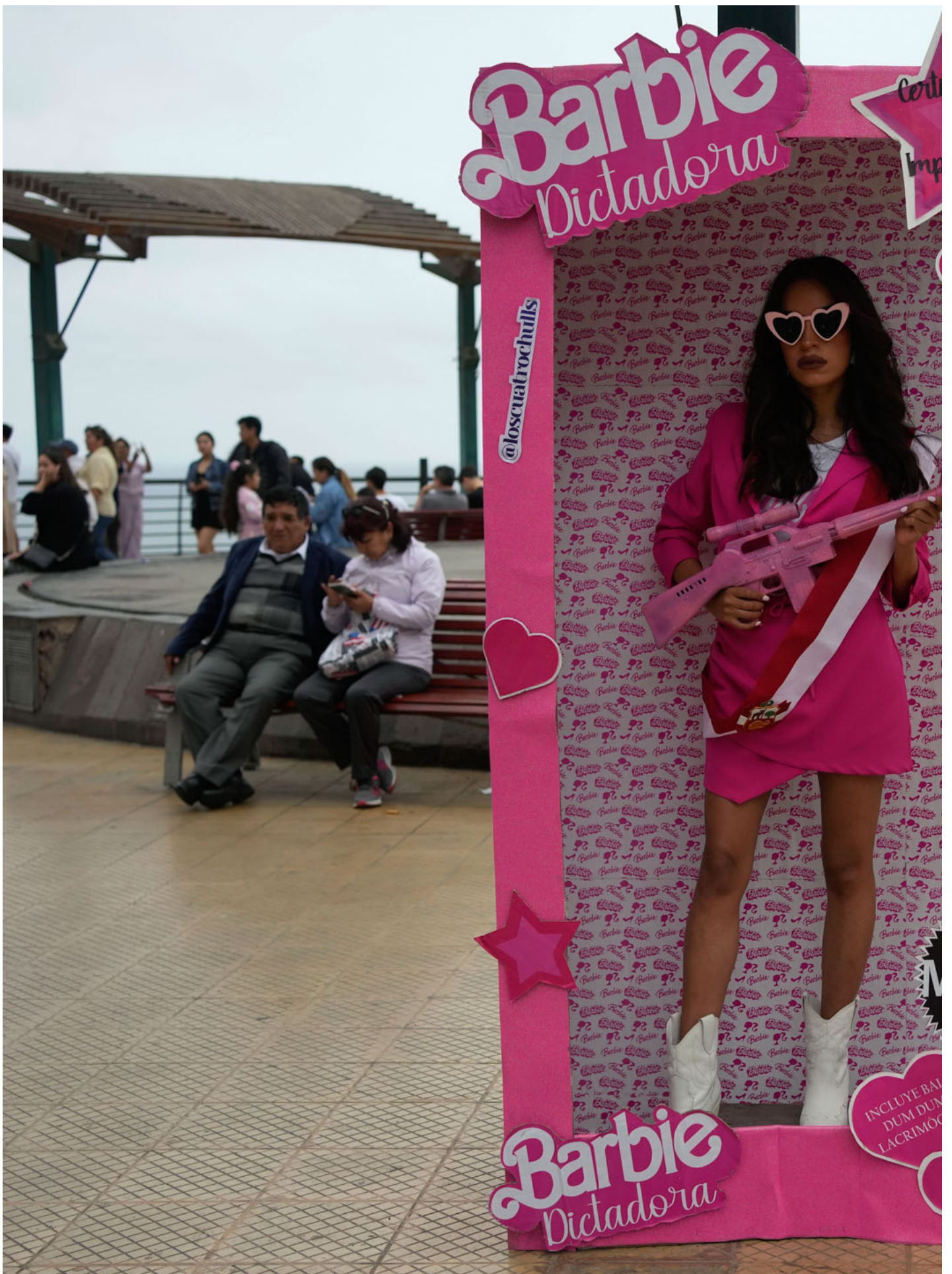
2023年7月22日，秘鲁，一名示威者打扮成芭比抗议，要求总统下台。

在《芭比》中，出现了很多戏仿影史名片的镜头，《2001太空漫游》，《黑客帝国》和《教父》——这些经典科幻文本原本都含有男性中心主义（androcentrism）的特质，但格蕾塔将其解构，用喜剧的方式化用在自己的表达中，形成了一种戏谑感。片头对《2001太空漫游》人类文明诞生的戏仿，女孩们用芭比娃娃砸烂了婴儿娃娃，迎来了巨型芭比；而对应《黑客帝国》经典“红蓝药丸”这种人类命运的“终极救世主选择”，则是怪人芭比掏出的高跟鞋与勃肯鞋，Kendom分崩离析之际一群肯兵戎相见的场面时，格蕾塔把扎克伯格正义联盟中刀光剑影和血流成河拍成了过家家。