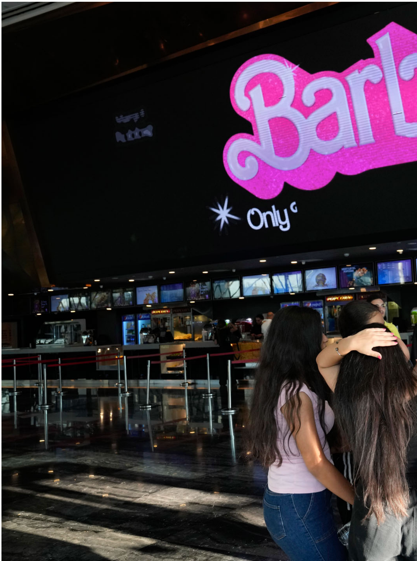
2023年9月7日，黎巴嫩，观众站在电影院售票柜台前聊天。

电影前半段，看似在展现女性之间的友谊和她们的快乐，叙事重心和视觉重心其实都在Ken身上，相当异性恋话语中心甚至是男性话语中心，几乎很少描述芭比们之间的情感活动。这就是给女性量身制造的幻想世界。在太多的荧幕中我们都可以看到这样的叙事，女性之间的情感草草带过，只当作一种背景板，叙述中心仍旧在和男性的关系上。同时，虽然女性什么都可以做，但是女性的所有行为和动机还是围绕男性的。