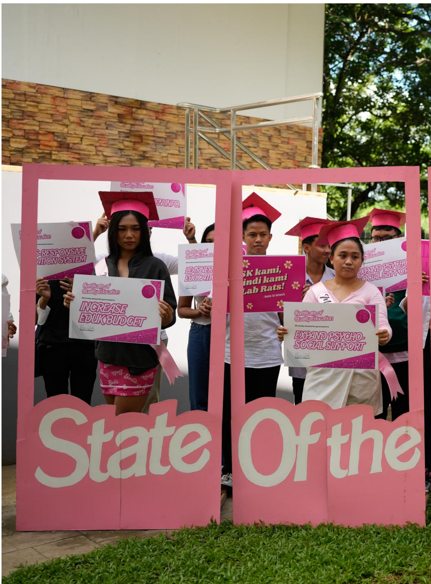
2023年7月21日，菲律宾，穿着芭比主题服装的学生高举口号标语，抗议当地教育部门涉嫌腐败的问题。

而实际在电影行业中，性别不平等仍旧是一个很严重的问题。获得导演资格的女性往往预算较少，即使她们的电影制作完成，她们也面临着一场艰苦的战斗。同时，成功的女性电影人掩盖了行业和电影节的性别不平等数据，她们在“25部最佳女导演电影”和“68部你不能错过的女性导演电影”等榜单中名列前茅。但在（男性）全部的榜单中却几乎查无此人。