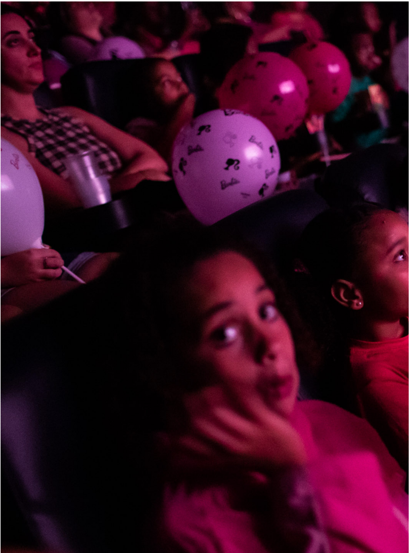
2023年7月22日，巴西，孩子在贫民窟看电影。

这部电影充满对经典电影素材的重现或指涉，绝对不是“致敬”，而是一种“戏仿”和“讽刺”。往往只有男性才有权力使用讽刺。我们在银幕上几乎找不到属于女性的幽默讽刺剧。诚然“幽默”和“讽刺”是一种具有颠覆权力的工具。而它也可以既是展现优越也是贬损的工具。男性题材在使用这个工具时，他们往往会倾向于那些社会地位较低的人使用这个工具，即使是卓别林的讽刺剧，在试图表达对社会的不满的同时，也是丑化底层人民（卓别林自己）本身。而后来演变为讽刺丑化上层阶级的时候，这种丑化都是暗含着男性内在的暴力和破坏性的，死亡的结局。在“芭比”中无论是对于男性经典电影的镜头的“讽刺”还是对于“Ken”的男性气质的讽刺都是及其温和的，像对待“宝宝”一样对待他们，没有任何暴力性和破坏性。而这种轻幽默的方式也是在表达一种对于被建构男性气质神话的蔑视——“不过如此”。有时幽默会比严肃更有力量。