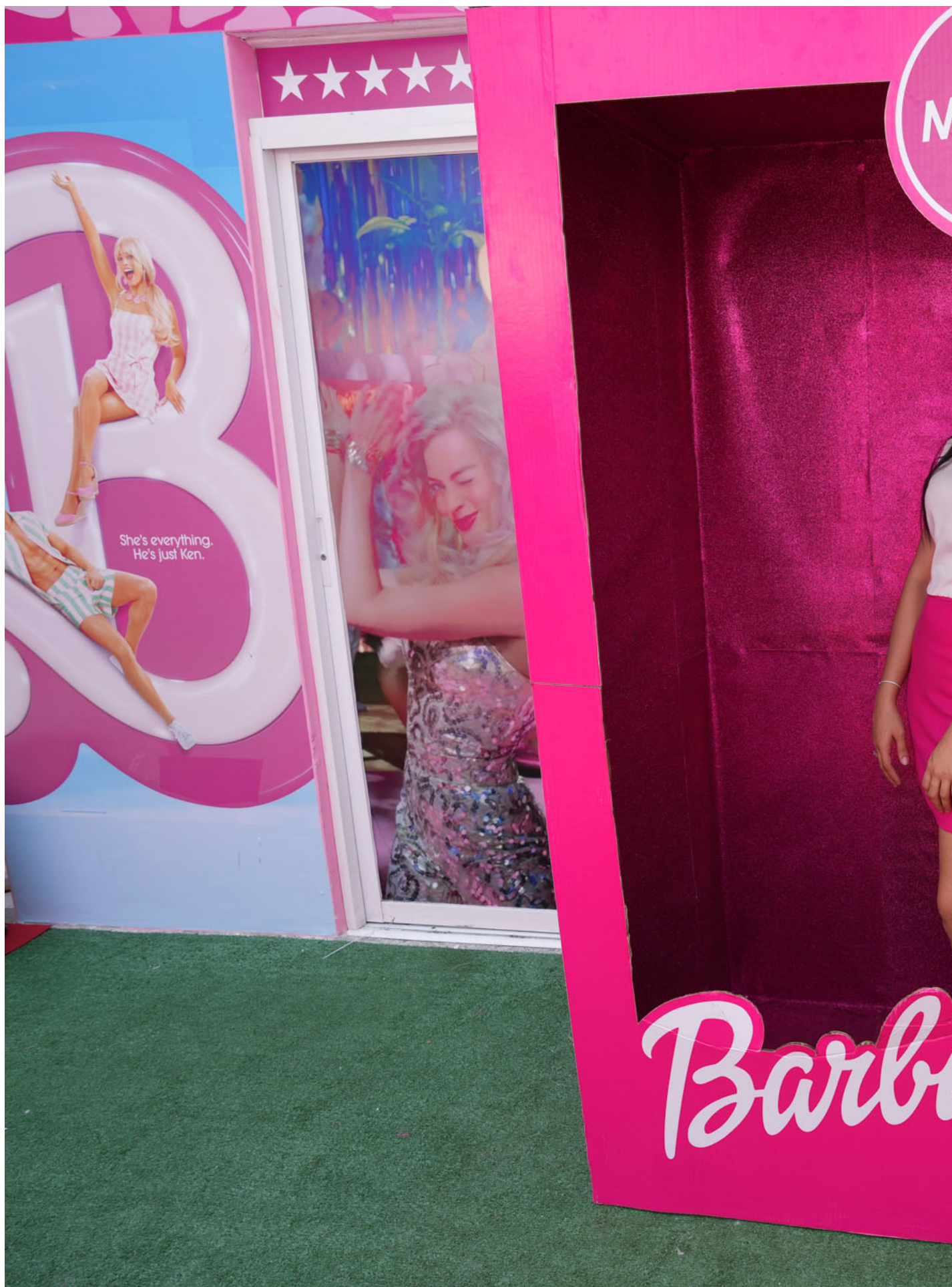
2023年7月21日，厄瓜多尔，一家人在芭比的主题餐厅拍照。

例如在《前途似锦的女孩中》，女孩突然睁开眼，看着镜头说：hey，你在做什么。《燃烧女子的肖像》中，Céline Sciamma 探索了画家与被画体之间平等的视线的交流与欲望的渴求。在男性艺术家的美术史，画家与被画体之间总是充满了权力不平等，被画体是客体，是被看，是无力的。而画家总是直视审视着被画体，被画体的形象由画家的眼睛和手所塑造。